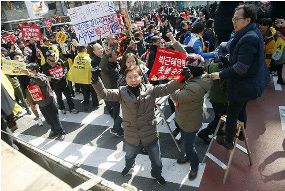
환호하는 시민들 '당실당실'