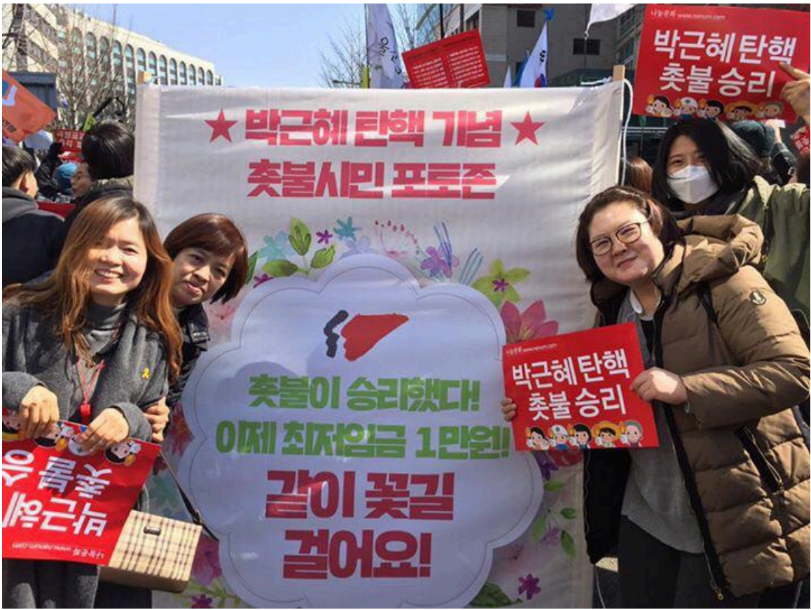
탄핵축하 포토존 현수막 앞에서 사진촬영하는 시민들