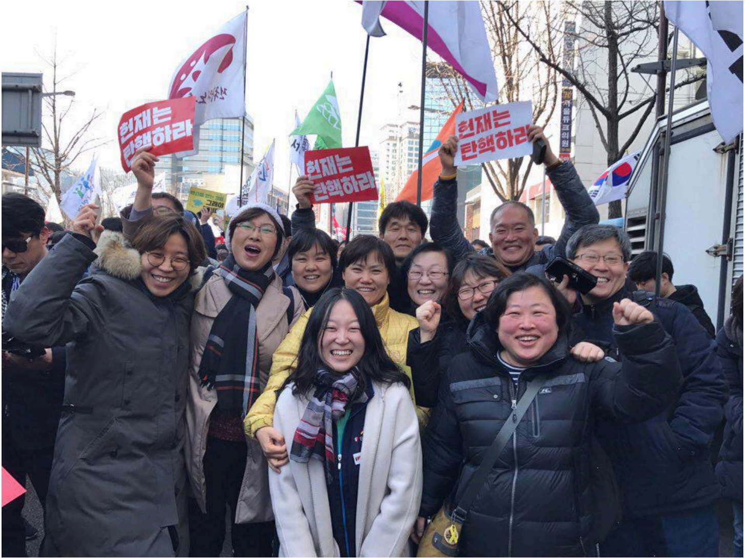
전원일치 탄핵인용 직후 기뻐하는 민주노총 성원들