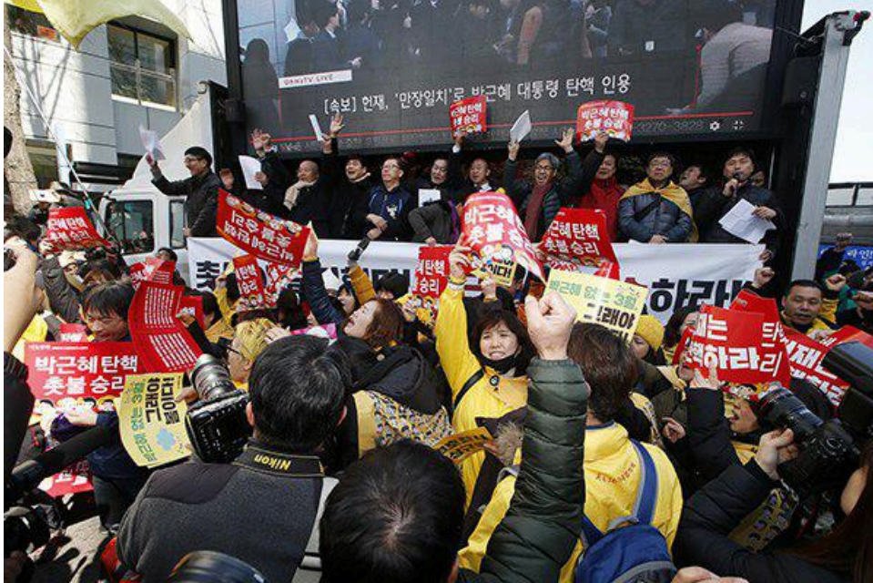
탄핵결정 발표에 환호하는 시민들

“대통령 박근혜를 파면한다!”, 국민들을 가장 기쁘게 한 역사적 한마디였다.