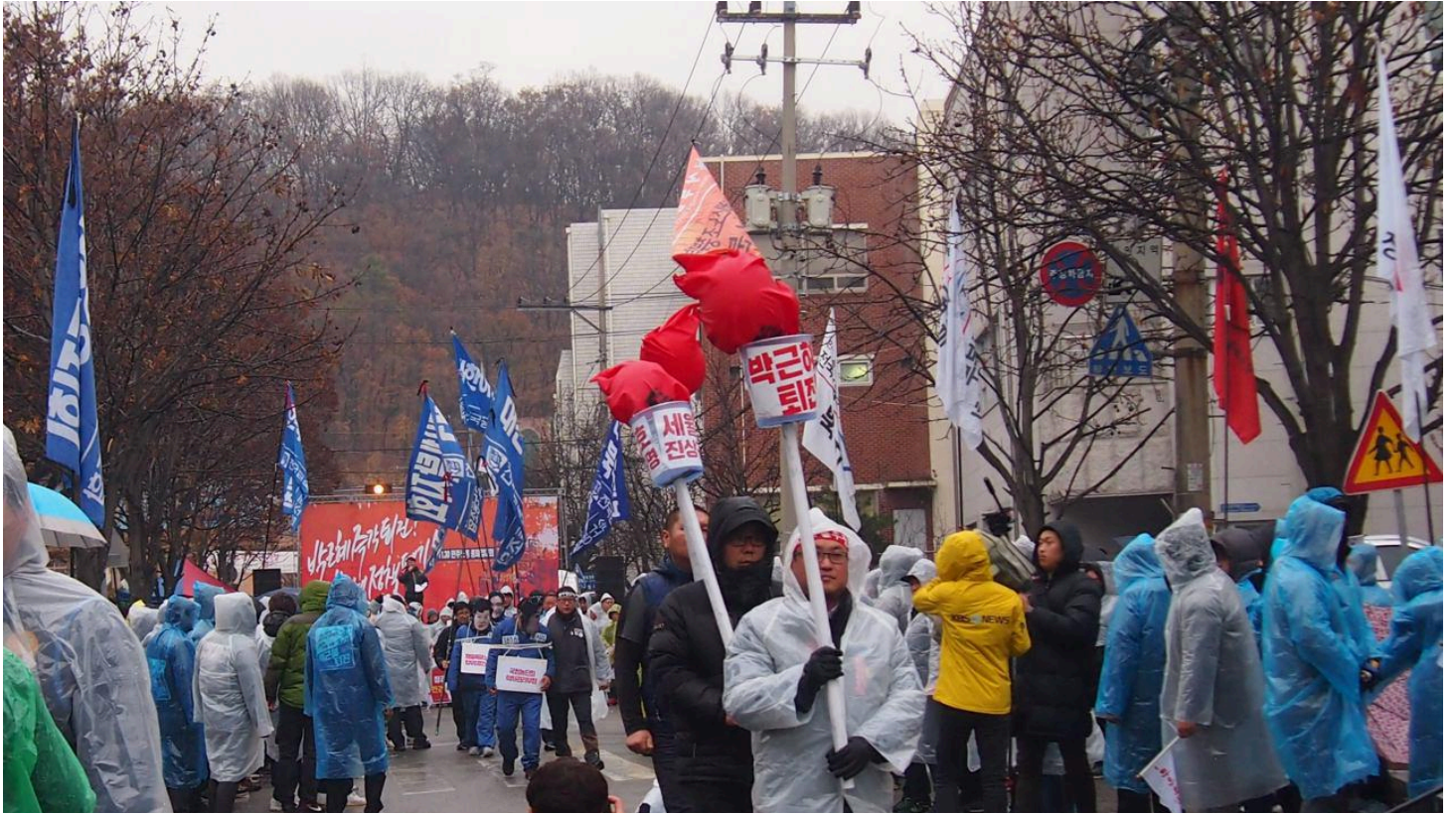
비오는 날씨에 모형햇불 등장