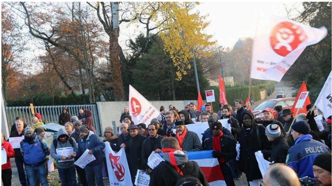
스위스 제네바 한국대사관 앞에서 열린 박근혜 퇴진 총파업 지지 집회