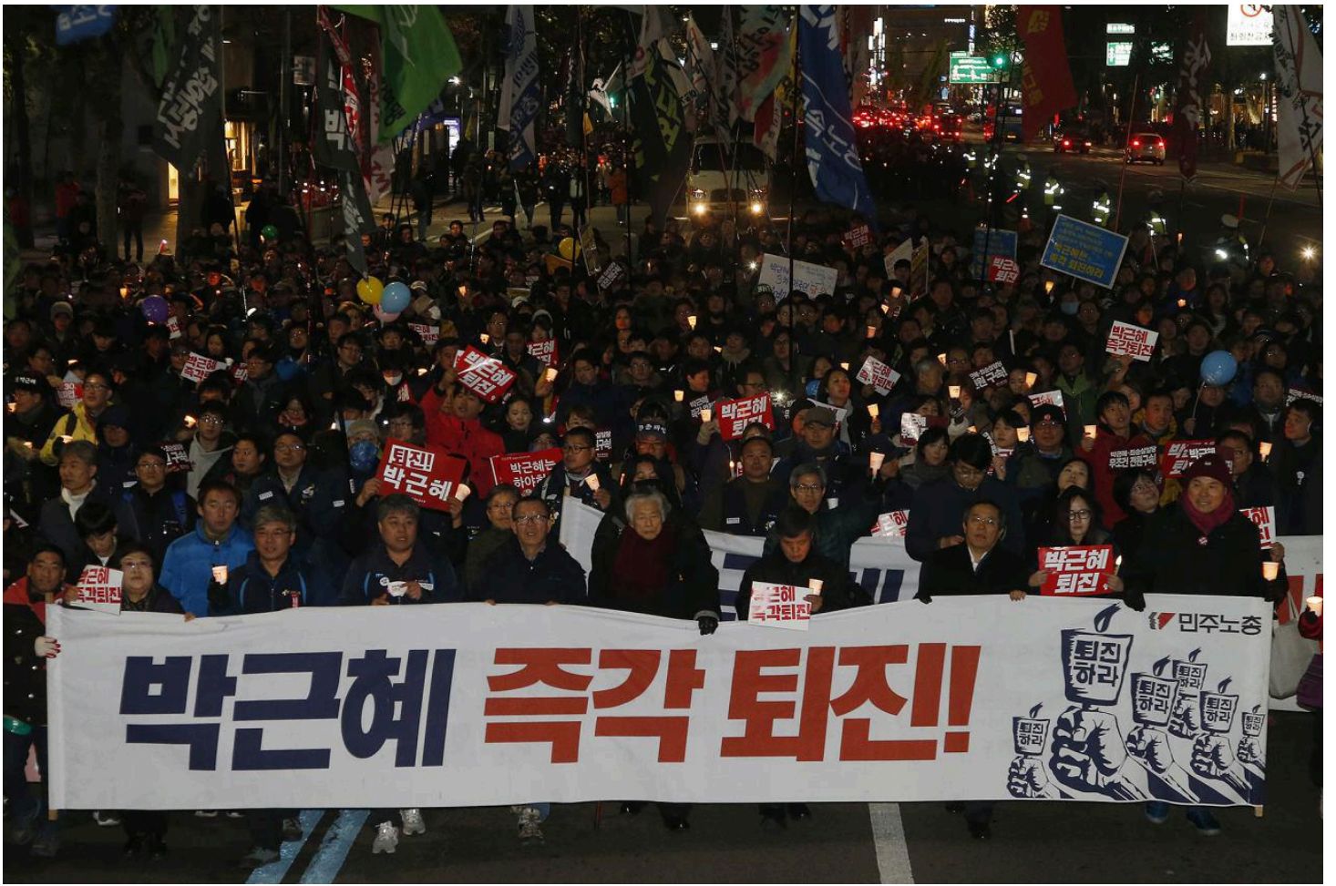
문화제 후 청와대 방향으로 다시 행진하는 노동자들