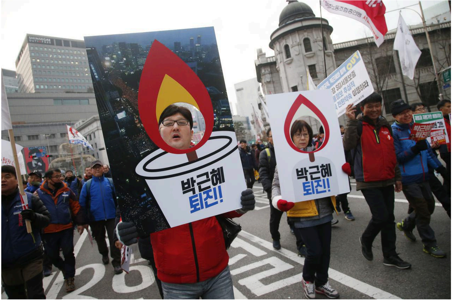
거리행진에 나선 촛불노동자