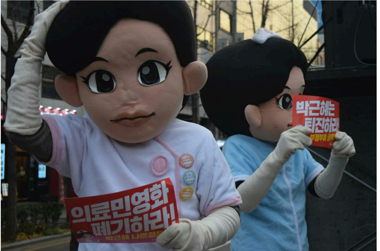
보건의료노조의 퍼포먼스 인형