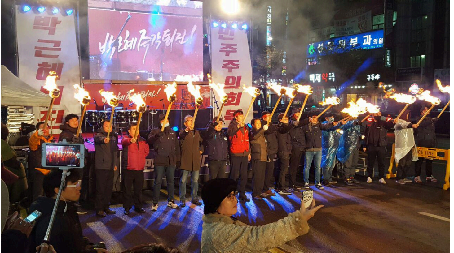
촛불은 햇불이 된다. 세종충남지역 조합원들