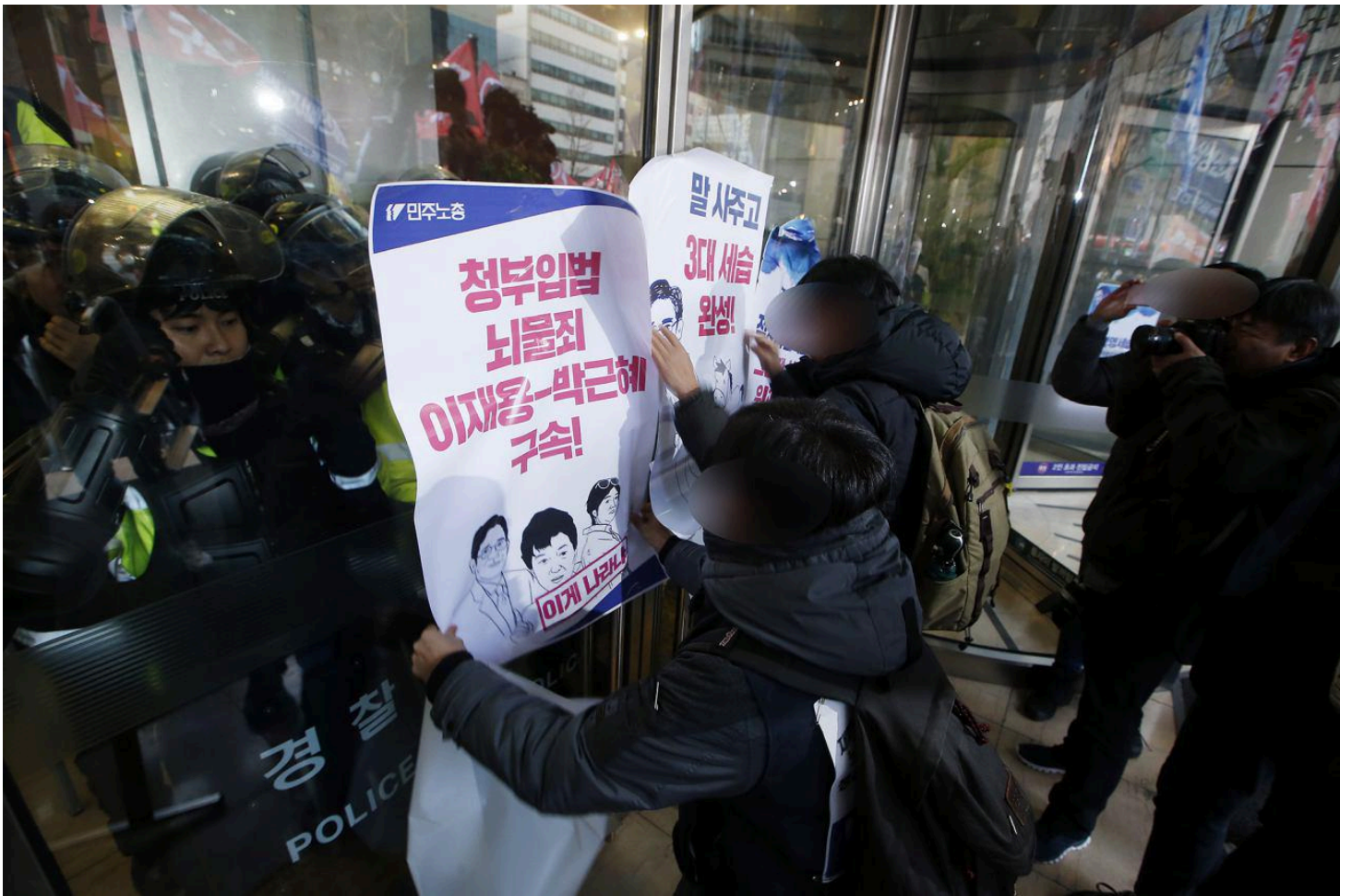
재벌도 공범, 총수 구속하라 ... 박-최순실 게이트 연루 재벌사에 규탄 유인물 붙이는 시민들