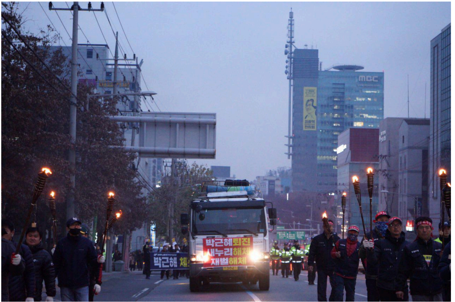
횃불 든 대구노동자들