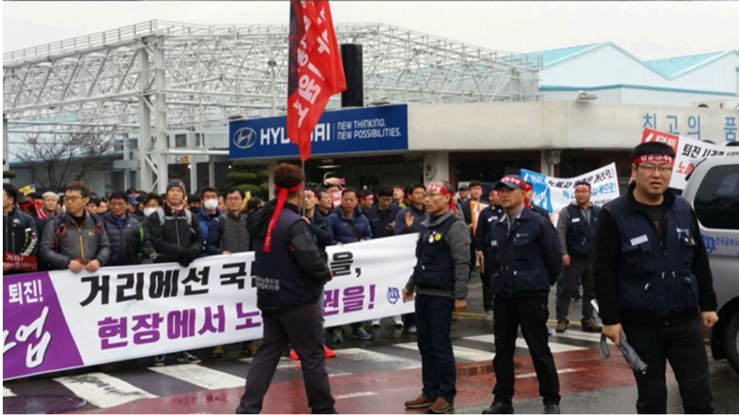
파업행진에 나서는 현대중공업과 현대자동차 노동자들