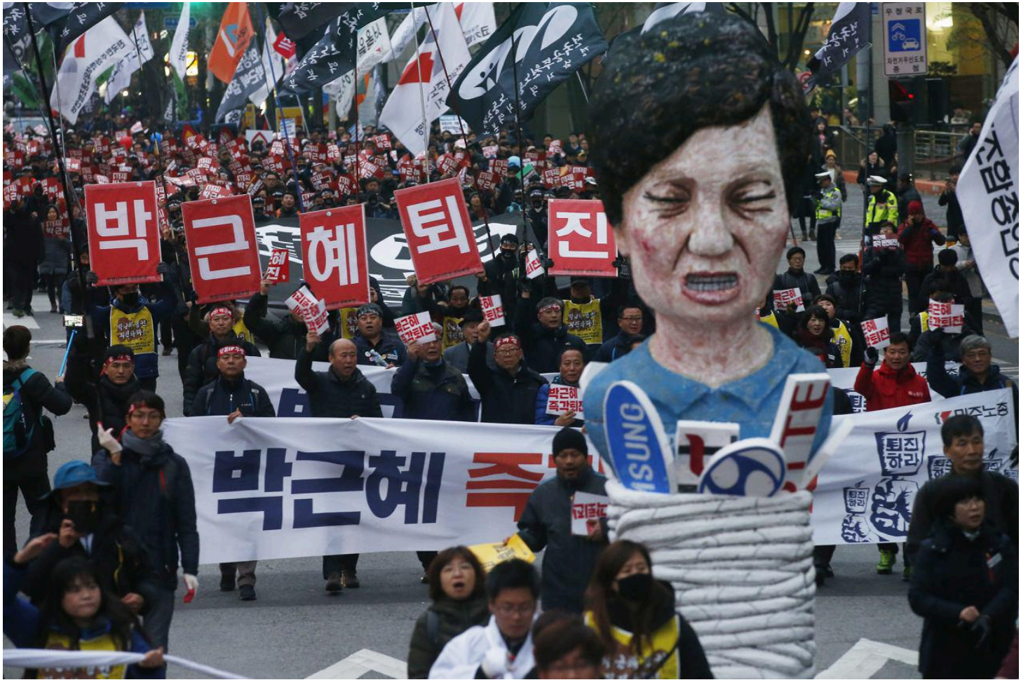
박근혜 구속 상징물을 끌고 행진하는 민주노총 조합원들

“재벌체제도 바꾸자” ... 민주노총 박-최순실 게이트 연루 재벌사 규탄행진