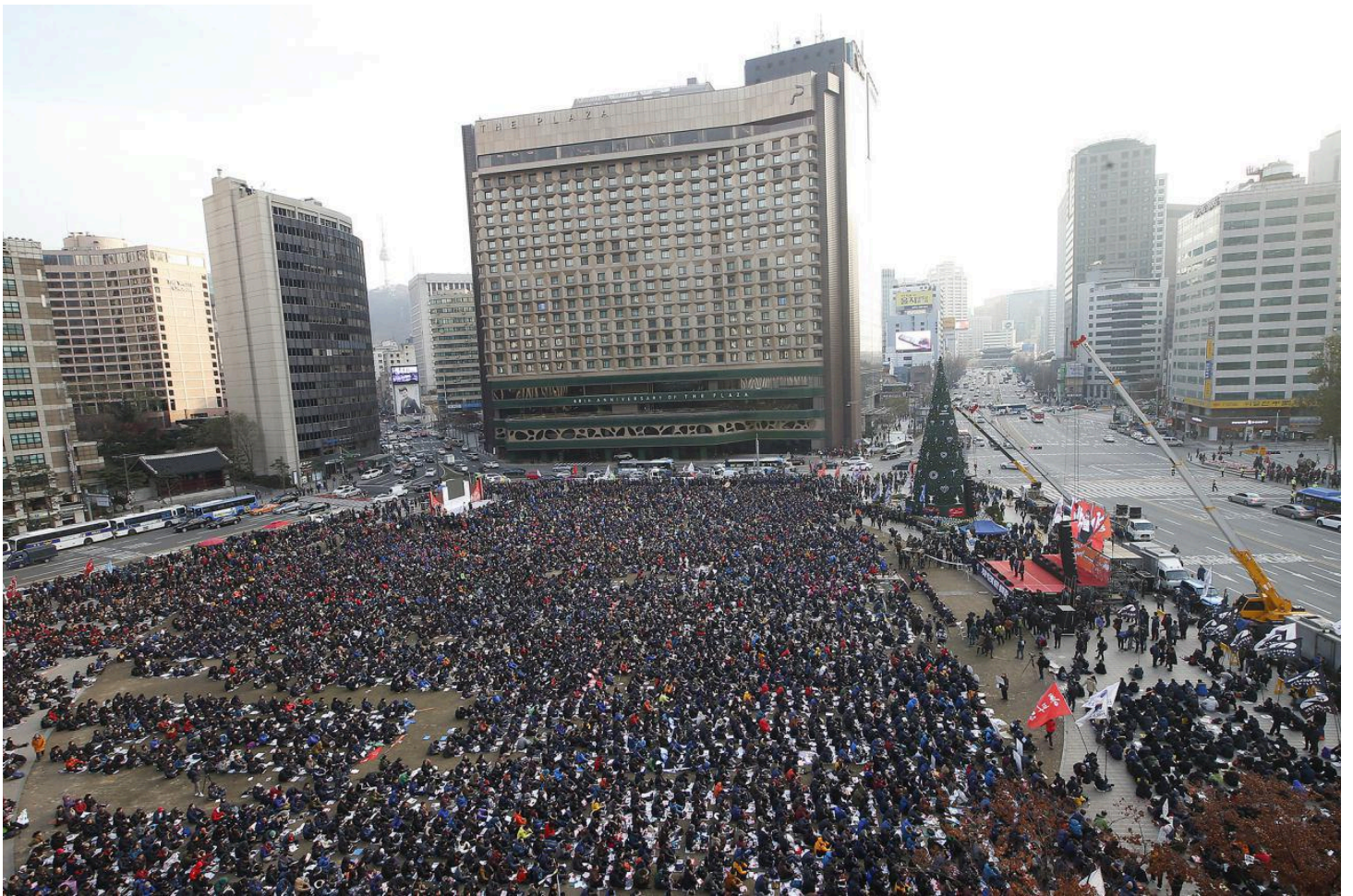
박근혜 퇴진! 박근혜 정책 폐기! 민중총파업 수도권대회에 모인 민주노총 2만여 조합원과 농민, 노점상 등

대통령이 3차 담화를 발표해 국민의 뜻을 거부하고 책임을 국회에 돌리자, 민심은 국민을 농락했다며 다시 분노했다. 평일임에도 서울 광화문을 비롯해 전국 곳곳에서 박근혜 퇴진 촛불이 모였고, 주말의 거대한 촛불시위를 다시 예고했다. 분노에 앞장선 것은 민주노총이다. 민주노총은 대통령 담화가 발표된 바로 다음 날인 오늘 22만 조합원이 총파업에 돌입하고, 서울 2만 전국적으로 6만 여명이 즉각 퇴진을 요구하는 총파업대회와 촛불집회를 이어갔다.