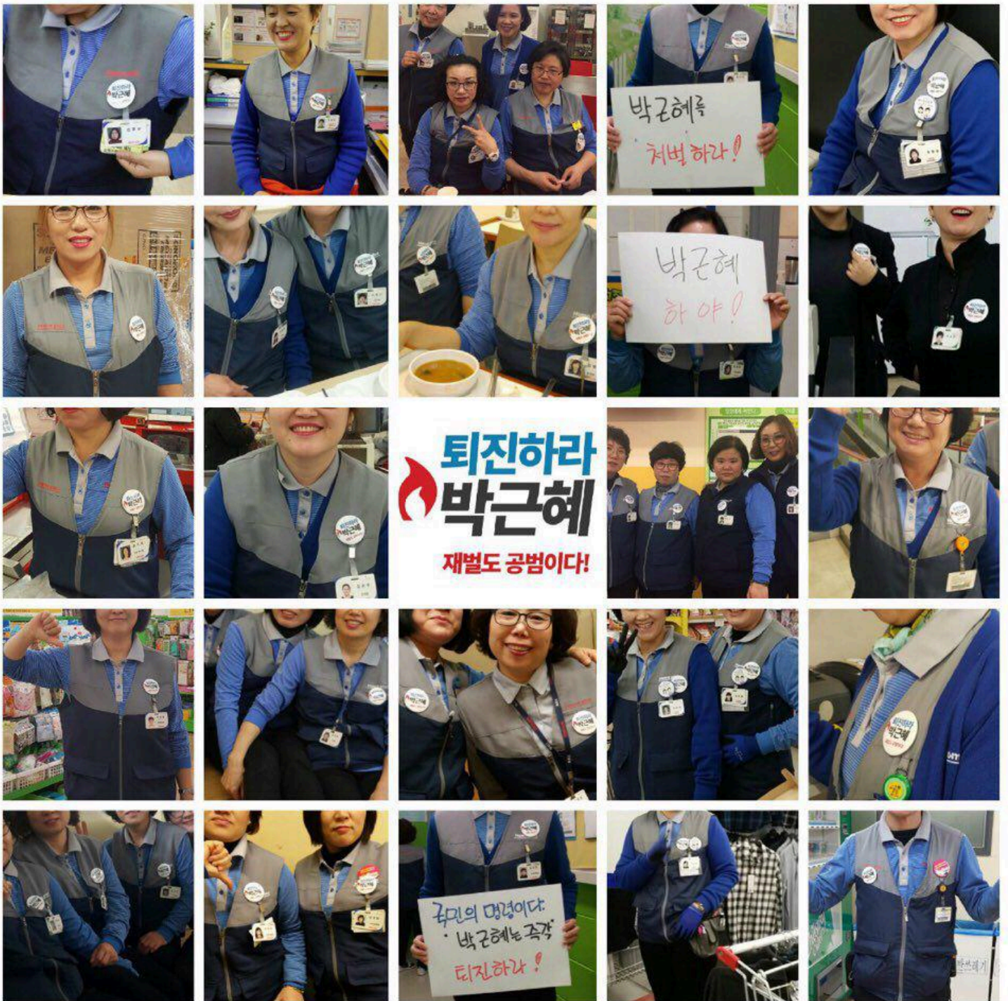
박근혜 퇴진 촉구 사업장행동에 나선 서비스연맹 조합원들의 버튼달기