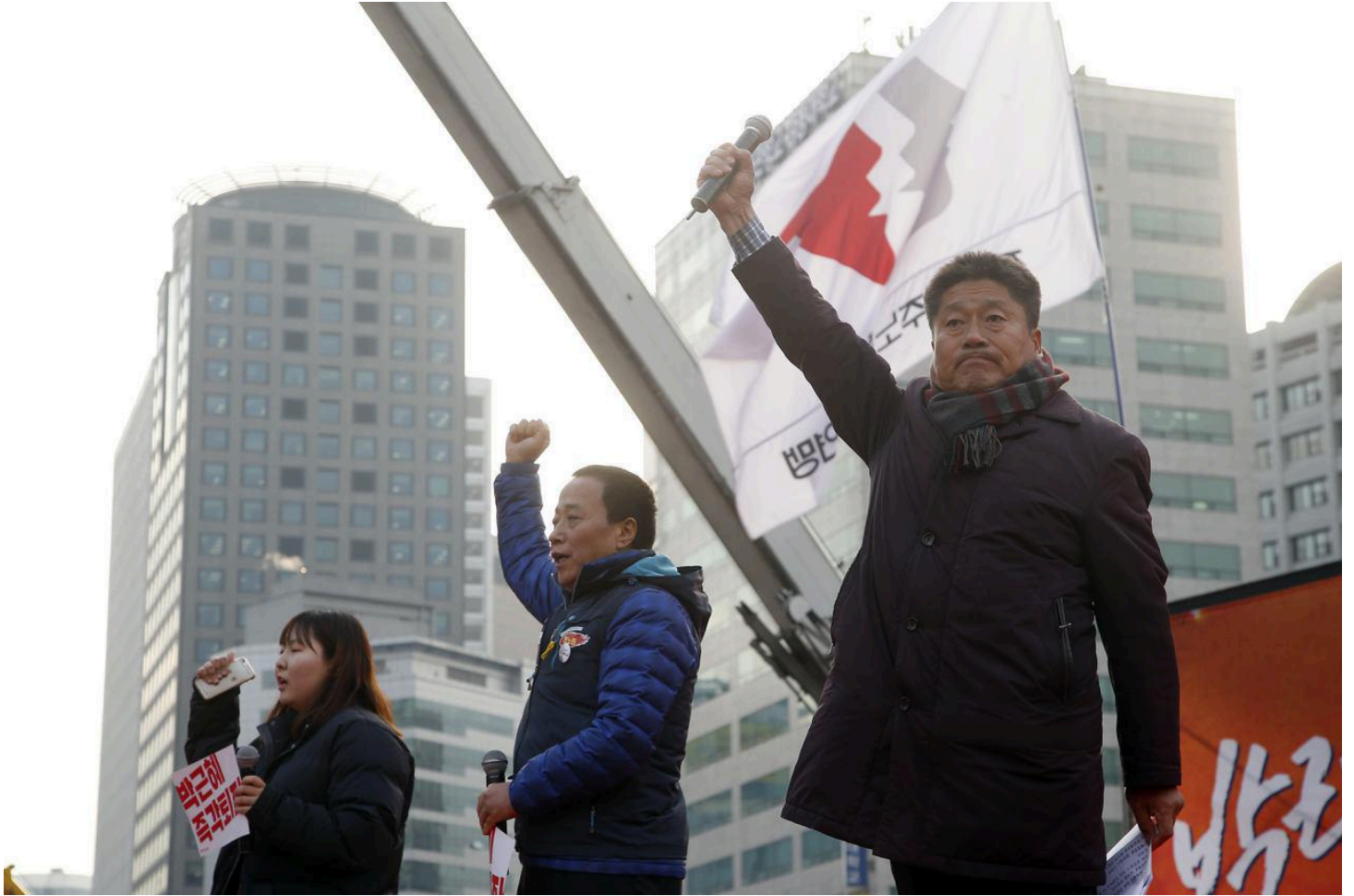
민중총파업, 민주노총과 연대투쟁에 나선 농민, 빈민, 학생 단체 대표자들

한편, 울산에서는 87년 노동자대투쟁 이후 최초로 현대중공업 노동자들이 파업 후 행진에 나서 현대자동차 노동자들과 합류했고, 스위스, 뉴질랜드, 프랑스, 캐나다 등의 한국 대사관 앞에서는 박근혜 퇴진과 민주노총 총파업을 지지하는 해외 노동자들의 국제연대 행동이 벌어지기도 했다.