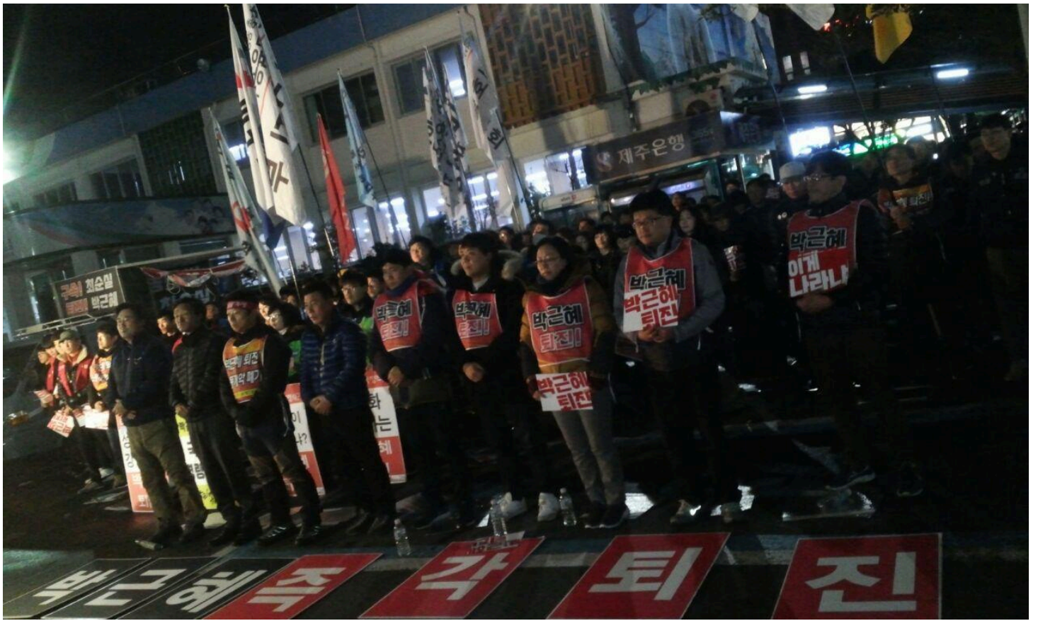
최남단 제주노동자도 파업대회 개최