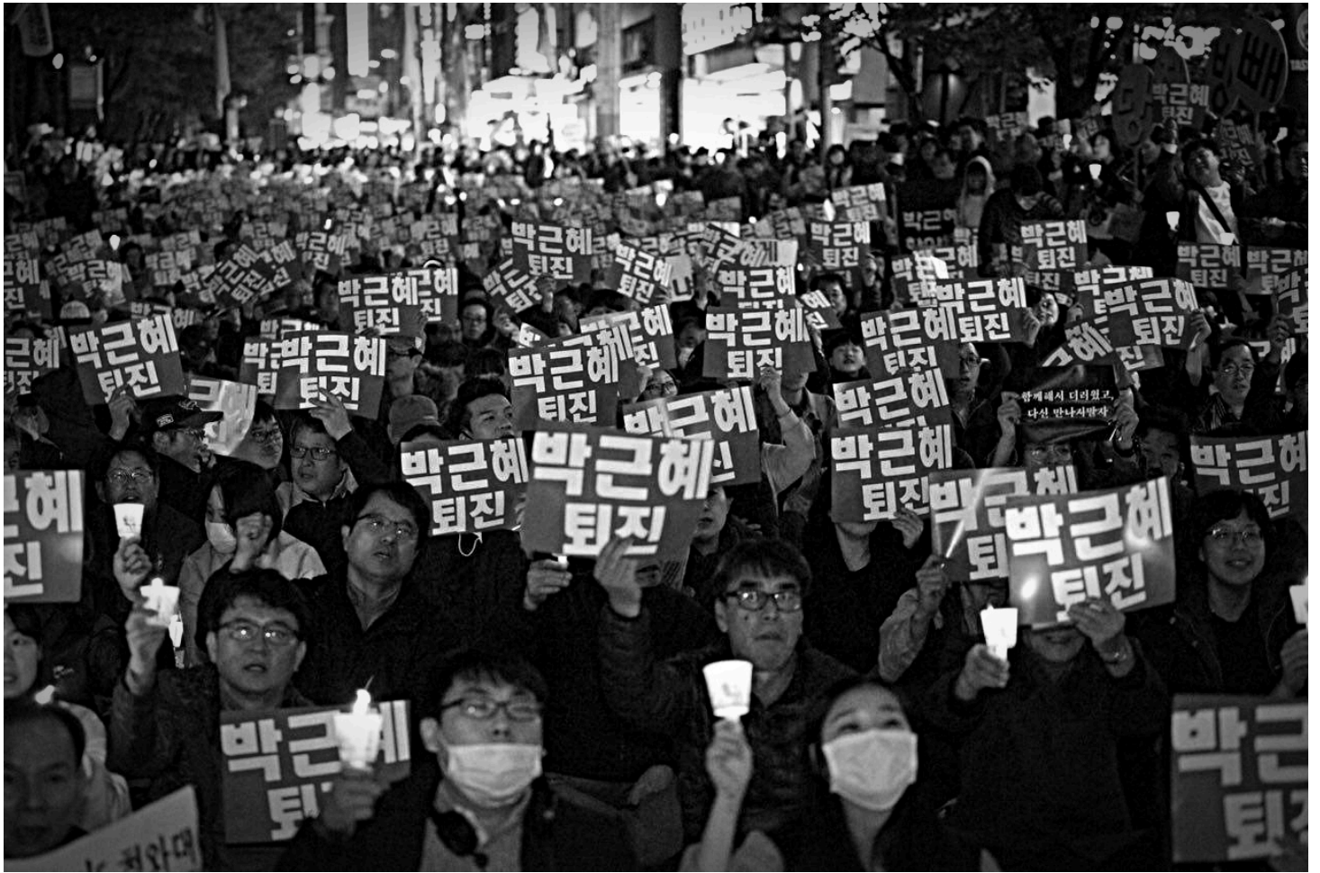
박근혜의 고향 대구, "박근혜는 퇴진하라!"