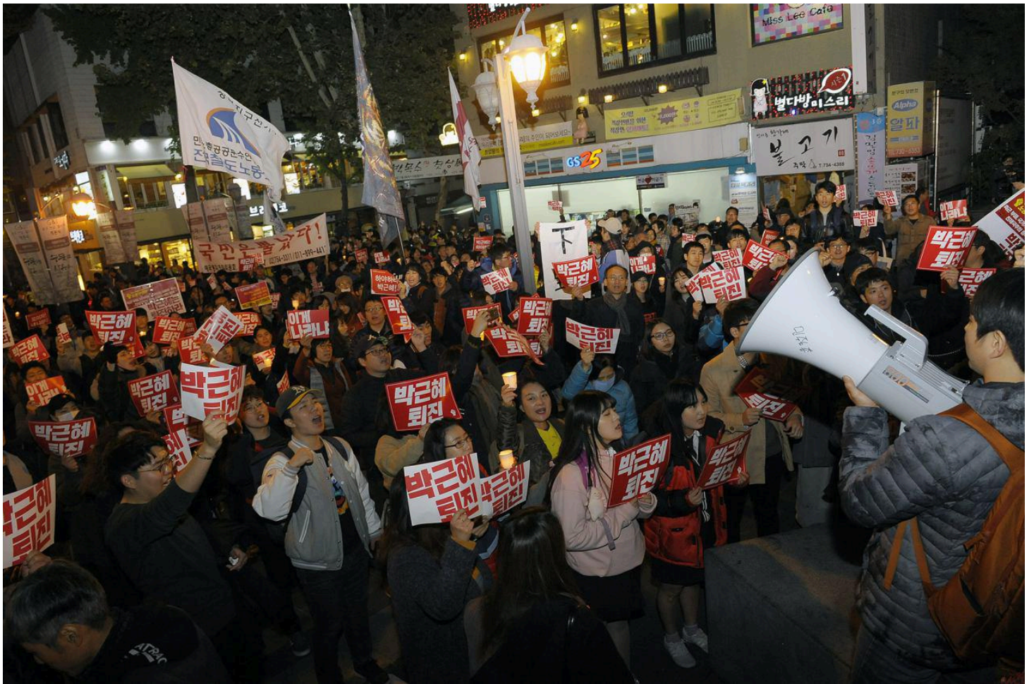
행진하는 시민들

지난 토요일엔 모두의 예상을 넘어 선 규모의 시민들이 거리로 쏟아져 나왔다. 시위의 열기도 높아 대통령 하야를 촉구하는 민심이 얼마나 폭발적인지 증명했다. 이에 민중총궐기투쟁본부는 월요일부터 매일 저녁 촛불집회를 개최했고, 다시 주말이 가까워오자 전국이 다시 촛불로 술렁이고 있다.