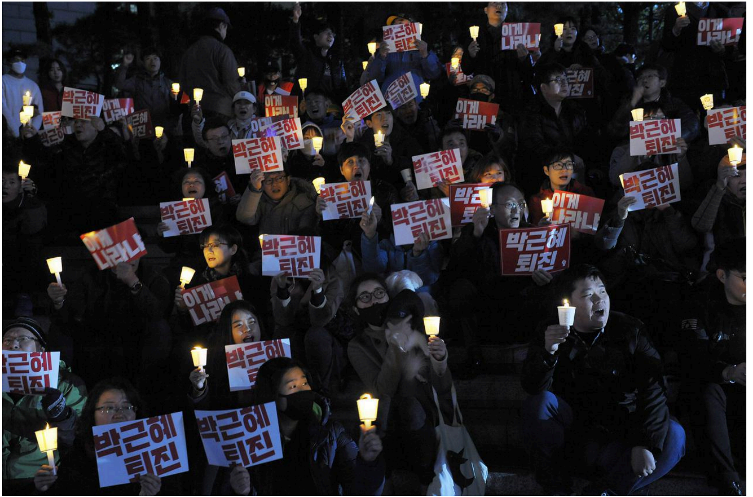
3일 서울지역 촛불집회

5일 촛불은 집회-행진-집회로 진행. 공식집회 후에도 시민 자유발언대 지속