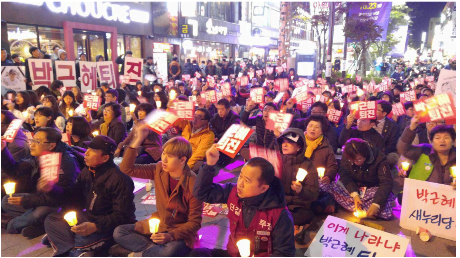
대통령 퇴진 촉구하는 충북도민들