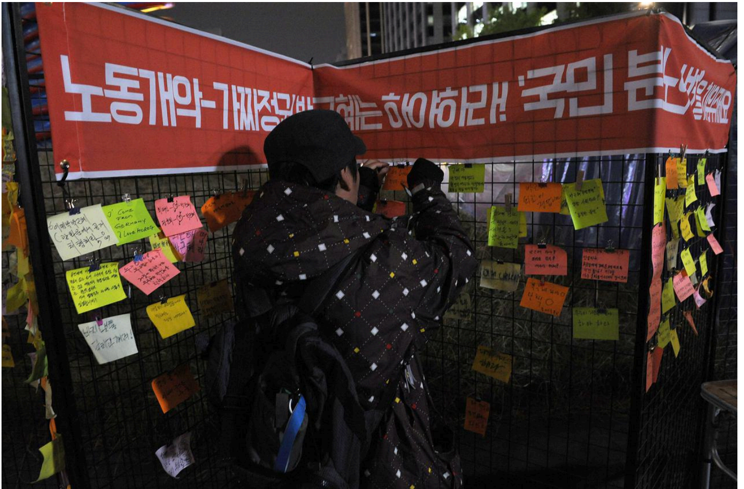
청계광장 '분노의 벽'에 포스트잇 붙이는 시민