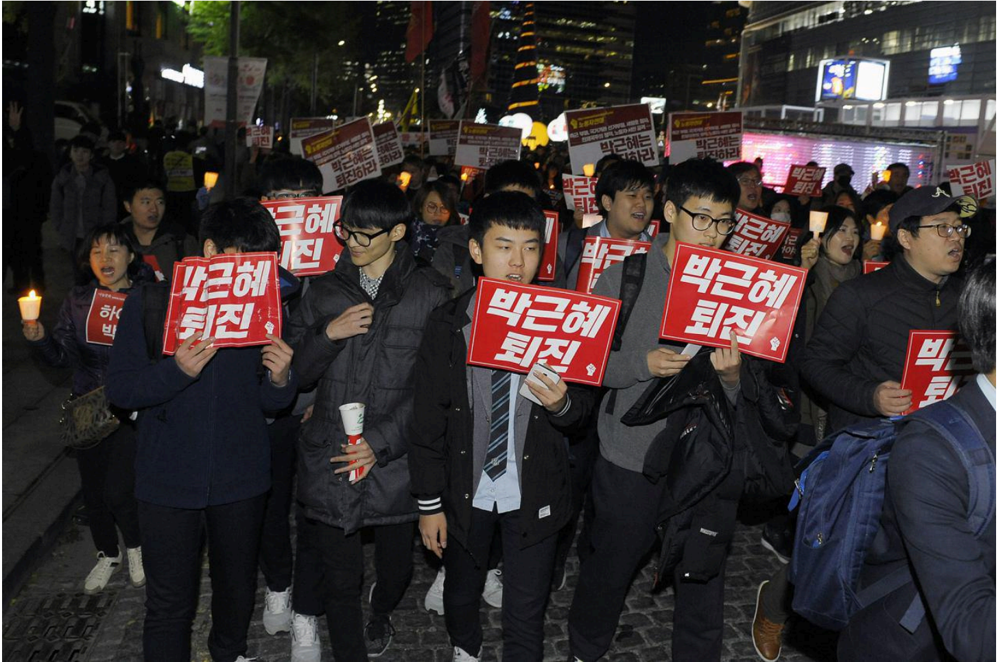
젊은 학생들의 참여 열기가 높다

민중총궐기 투쟁본부는 오는 5일에도 지난 토요일의 규모를 넘어서는 시민들이 촛불시위에 참여할 것으로 전망했다. 이날은 국가폭력으로 사망한 백남기 농민의 장례식에 이어 16시부터 1부 촛불집회로 '광장에서 분노를 표출하다'가 열리고, 곧이어 '거리의 민주주의를 구현하다'를 주제로 행진이, 다시 19시부터는 광화문에서 2부 촛불집회 '촛불을 들고 박근혜 퇴진을 외치다'가 개최된다. 그리고 20시 경부터는 민중총궐기 주체가 아닌 시민들의 자발적 참여로 다양한 자유발언 등 '광장의 민주주의를 구현하기' 집회가 이어질 예정이며, 주변에서 부대행사도 열린다.