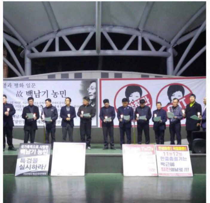
전남지역 집회