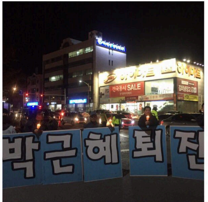
충남지역 촛불집회