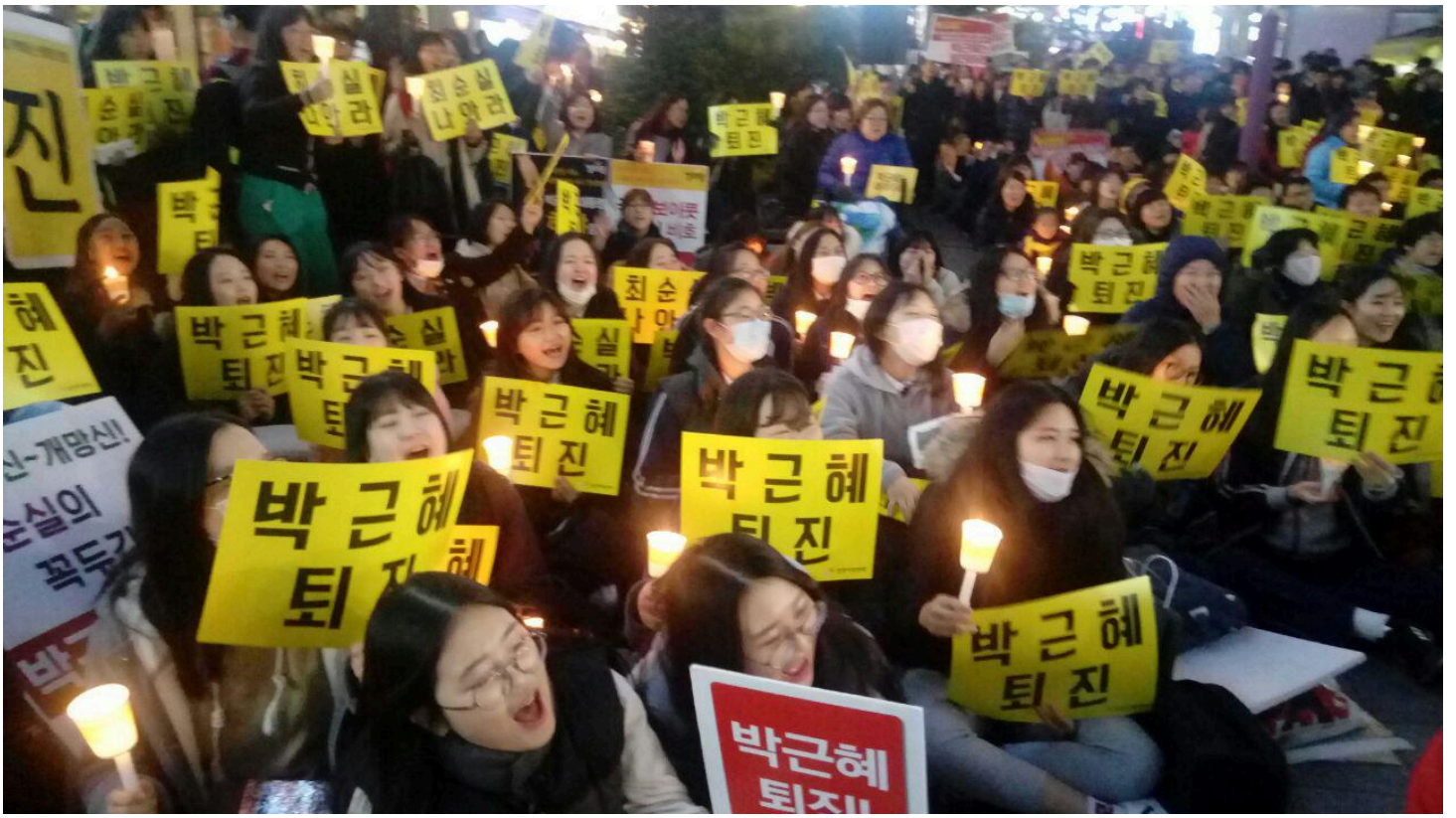
인천지역 집회에 참가한 젊은이들