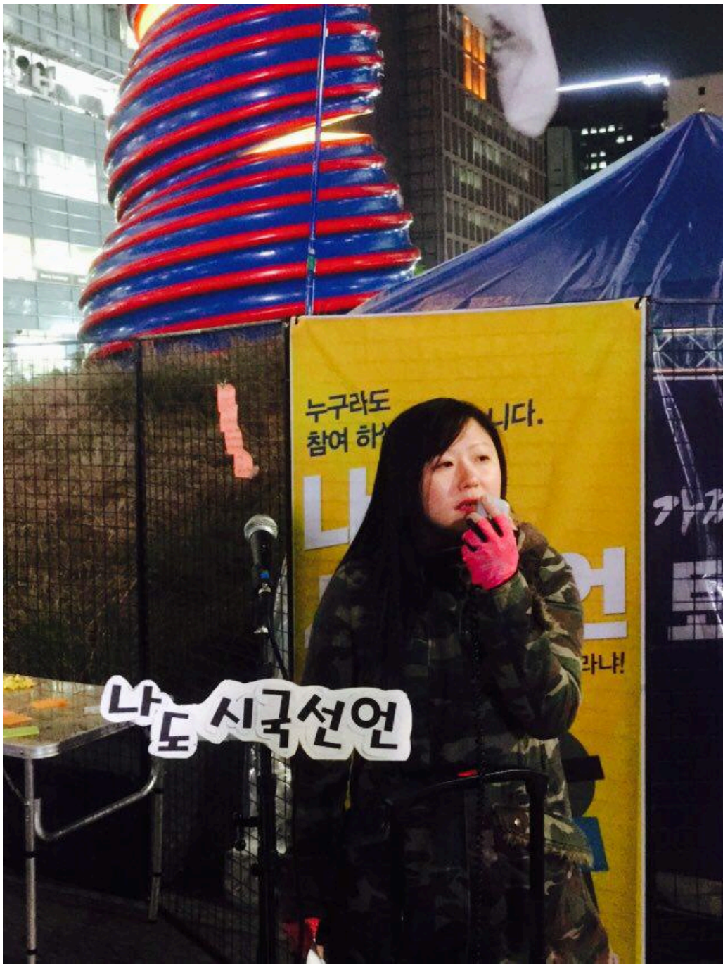
민주노총 시국행동 부대행사인 '나도 시국선언'에 참여한 시민