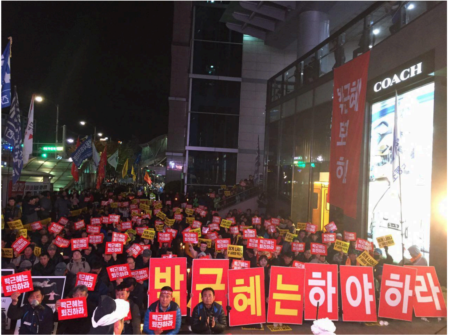
경기지역 박근혜 퇴진 시위