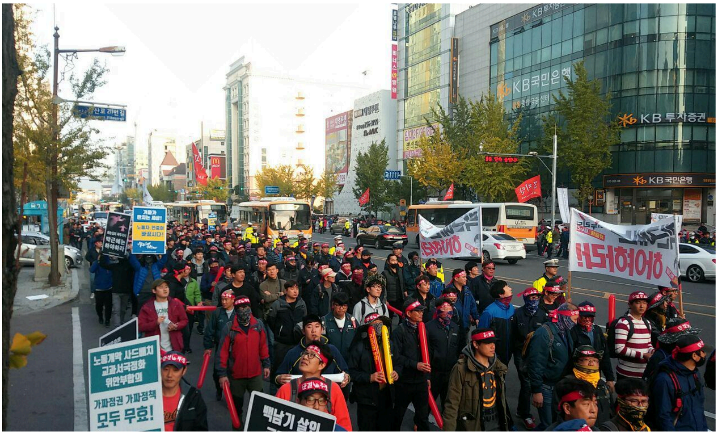
대통령 하야 외치며 행진하는 현대중공업 노동자들