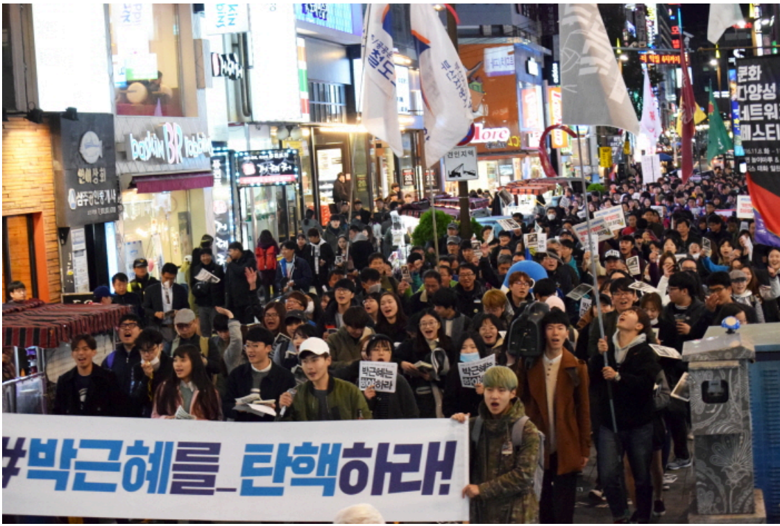
부산지역 하야집회