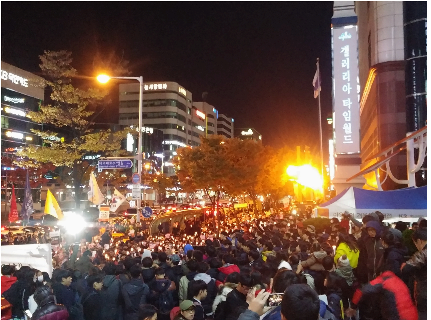
대전지역 하야 시위