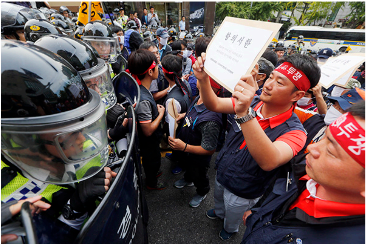
▲ ◎ 변백선 기자

금속노조 투쟁승리 결의대회를 마친 후 정몽구 회장에게 항의서한을 전달하기 위해 이동하자 경찰병력이 길목을 막았다. ◎ 변백선 기자