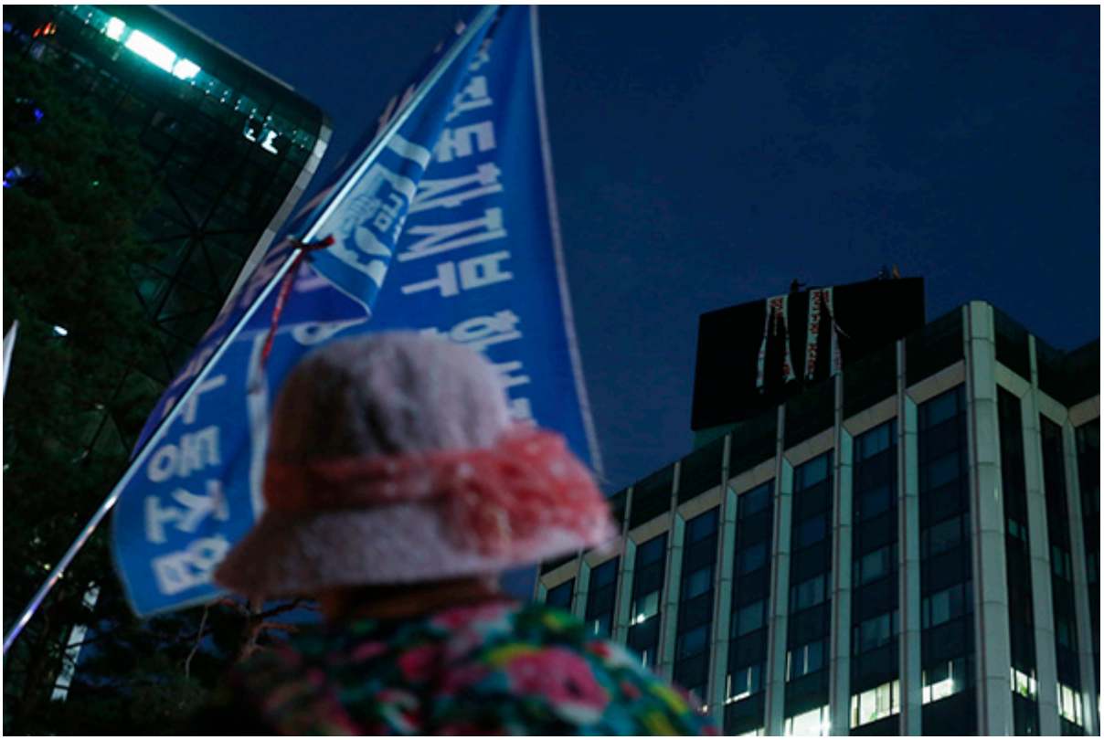
▲ © 변백선 기자

고공농성 100일 문화제 참가자들이 국가인권위원회 옥상 광고탑을 올려다 보며 2명의 조합원을 걱정했다. © 변백선 기자