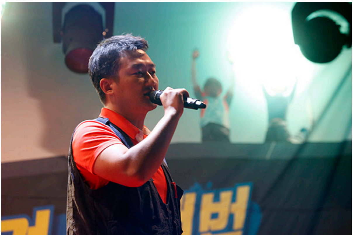
▲ © 변백선 기자

고공농성 100일 문화제 참가자들이 국가인권위원회 옥상 광고탑을 올려다 보며 2명의 조합원을 걱정했다. © 변백선 기자