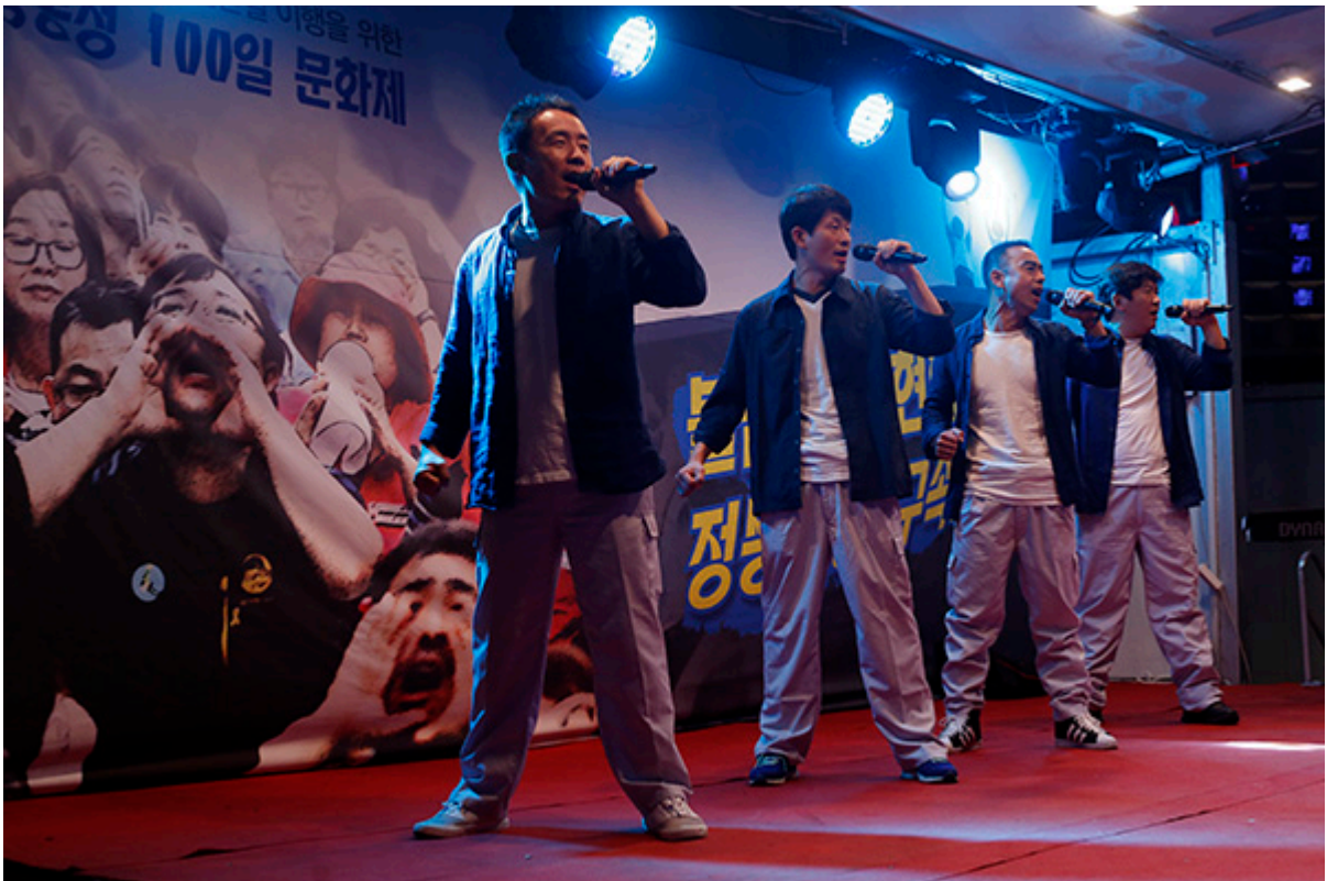
▲ © 변백선 기자