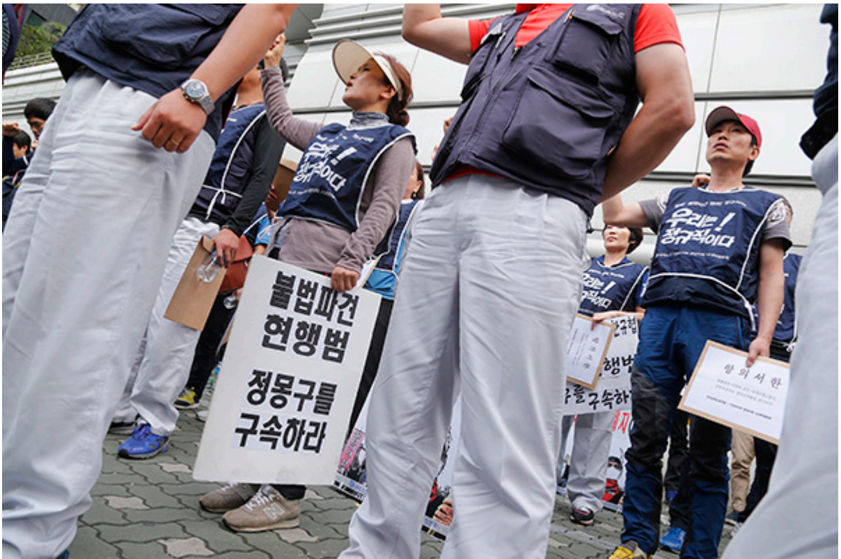
▲ © 변백선 기자

문화제 참가자들이 모든 프로그램을 마친 후 촛불로 '승리' 글씨를 만들고 있다. © 변백선 기자