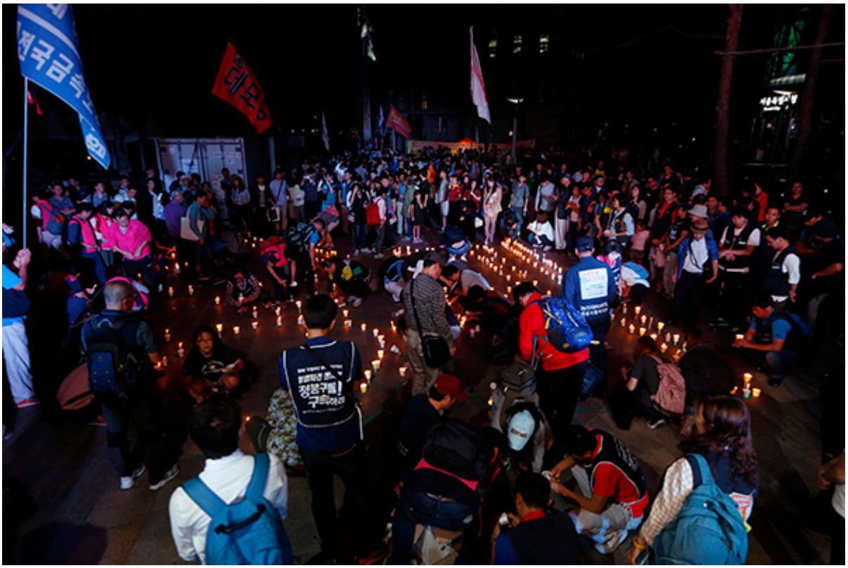
▲ © 변백선 기자

문화제 참가자들이 모든 프로그램을 마친 후 촛불로 '승리' 글씨를 만들고 있다. © 변백선 기자