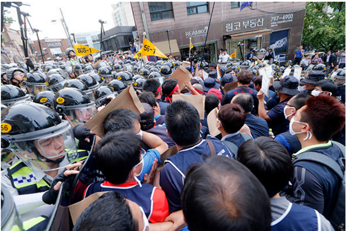
▲ ◎ 변백선 기자

금속노조 투쟁승리 결의대회를 마친 후 정몽구 회장에게 항의서한을 전달하기 위해 이동하자 경찰병력이 길목을 막았다. ◎ 변백선 기자