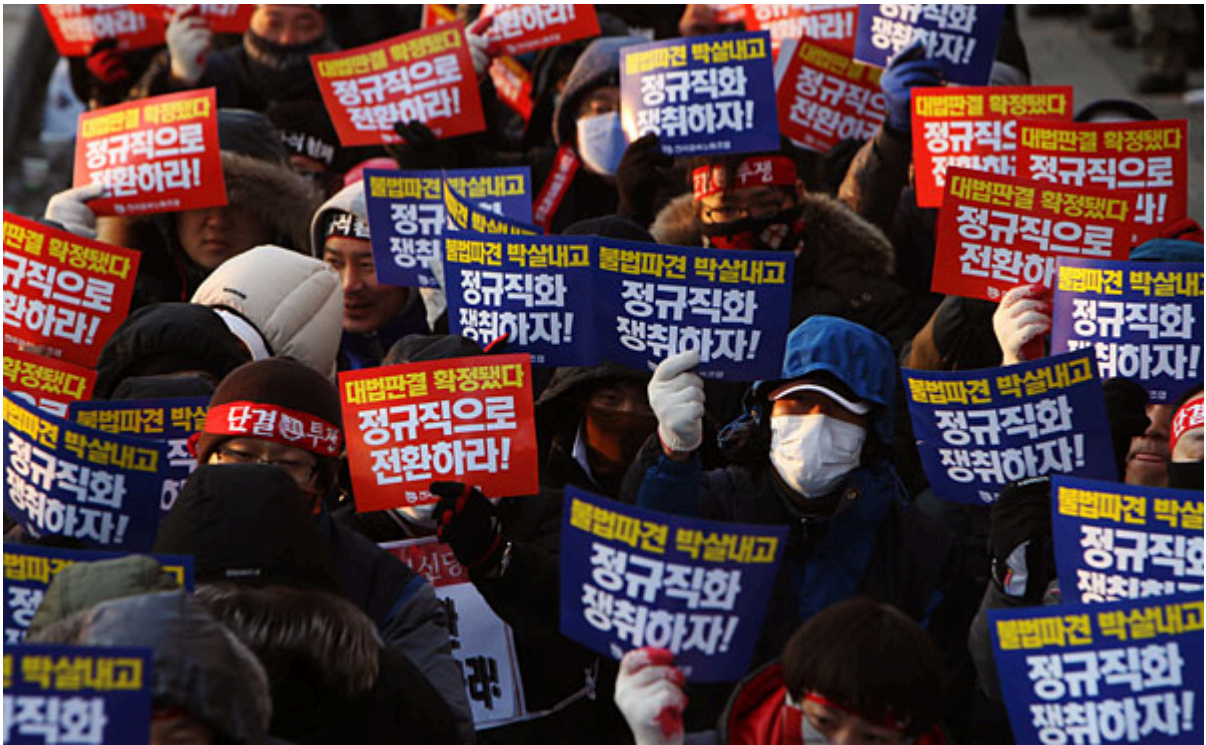
▲ 12일 서울 양재동 현대차그룹 본사 앞에서 열린 '대법원 판결 이행과 현대차 불법파견 정규직화를 위한 금속노동자 결의대회'에 참여한 금속노조 조합원들이 정규직화를 촉구하는 구호를 외치고 있다.