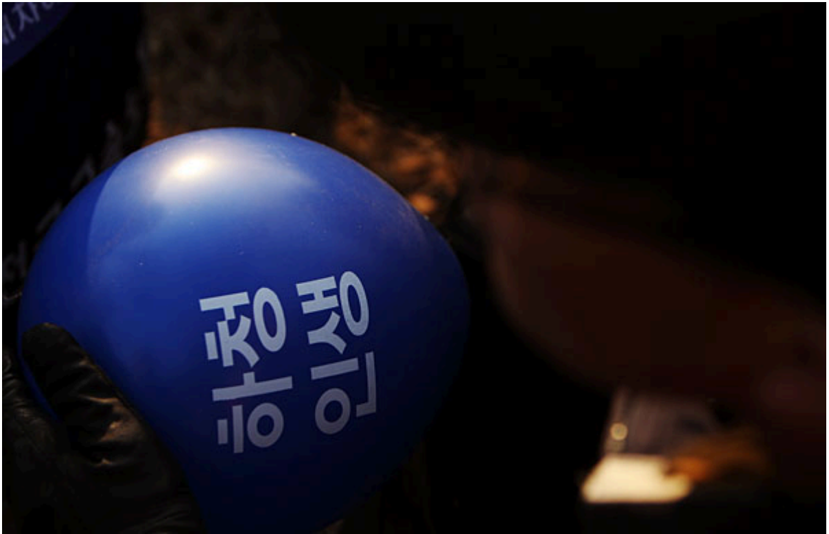
▲ 12일 서울 양재동 현대차그룹 본사 앞에서 열린 '대법원 판결 이행과 현대차 불법파견 정규직화를 위한 금속노동자 결의대회'에 참여한 현대차비정규지회 조합원이 '하청인생'이 적힌 풍선을 들고 결의대회에 참여하고 있다.