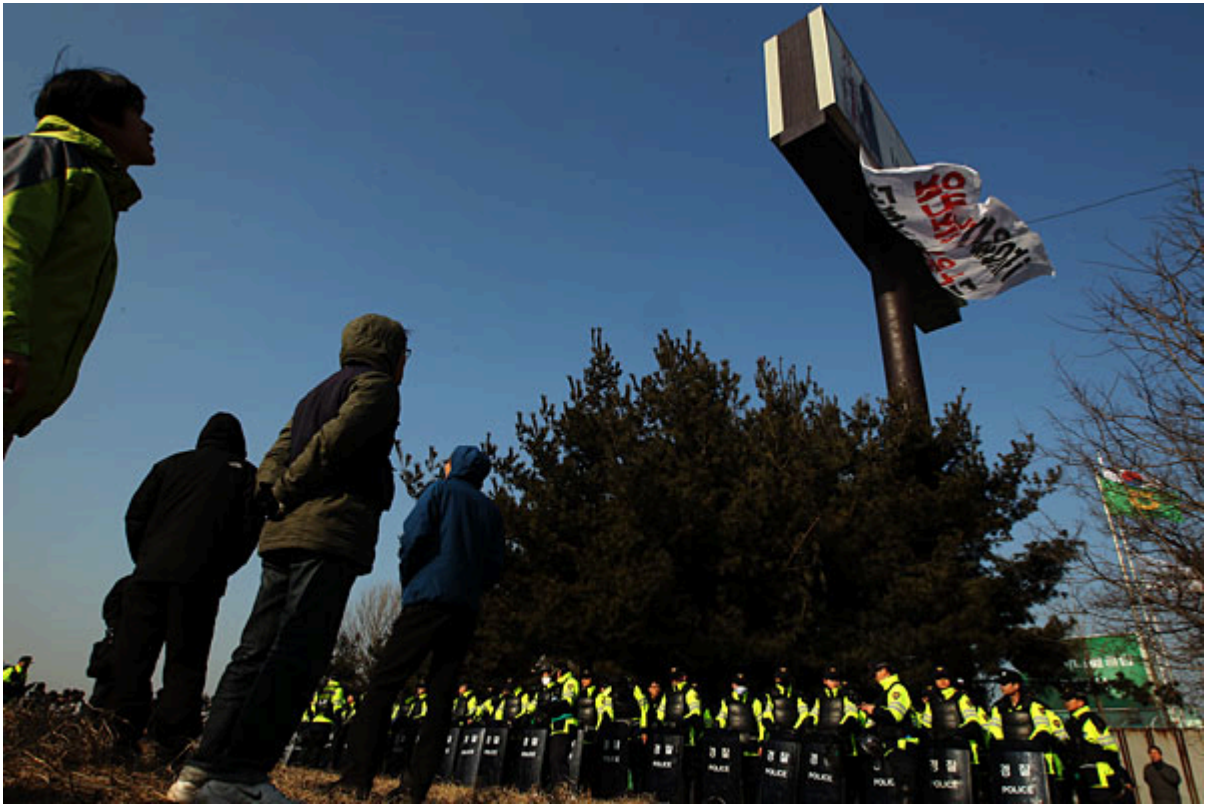
▲ 12일 고공농성에 돌입한 현대차비정규지회 노덕우 전 수석부위원장과 김태운 조합원을 응원하기 위해 온 금속노조 조합원들이 광고 탑 아래에서 농성장을 올려다 보고 있다.