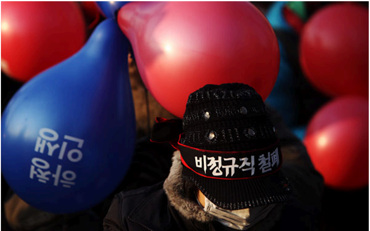
▲ 12일 서울 양재동 현대차그룹 본사 앞에서 열린 '대법원 판결 이행과 현대차 불법파견 정규직화를 위한 금속노동자 결의대회'모습.이명익기자