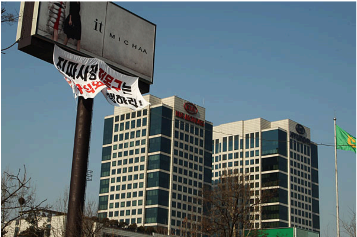
▲ 현대차비정규지회 노덕우 전 수석부위원장과 김태윤 조합원이 12일 양재동 현대.기아차 사옥 옆 30m 광고 탑 위에서 고공농성 돌입 한 후 '진짜사장 정몽구는 정규직화 시행하라'는 현수막을 펼쳐 보이고 있다.이명익기자