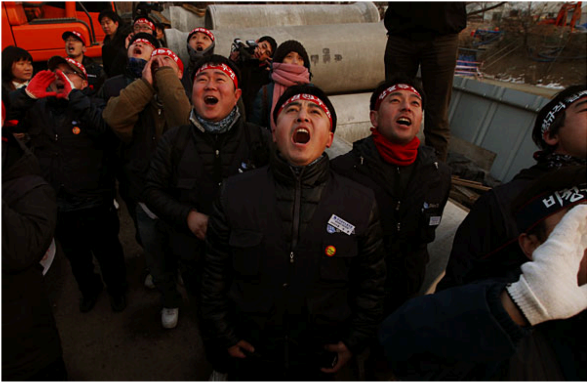
▲ 고공농성에 들어간 현대차비정규지회 두 조합원을 응원하기 위해 온 현대차비정규지회 지도부들이 광고 탑 위 조합원들에게 응원의 함성을 보내고 있다.