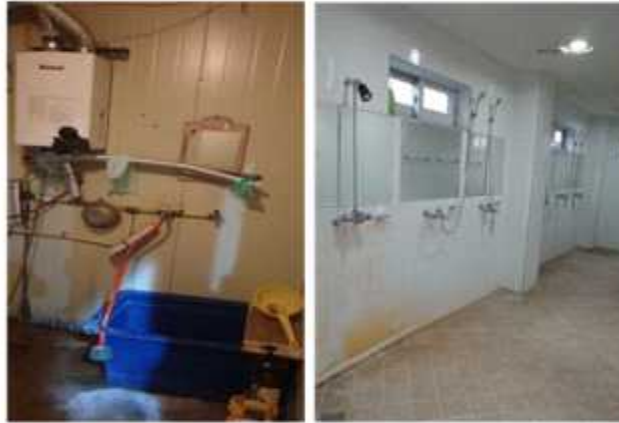
▲청주시 민간위탁 사업장 샤워실(좌), 직접운영 샤워실(우)