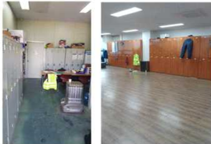
▲청주시 민간위탁 사업장 탈의실(좌), 직접운영 탈의실(우)