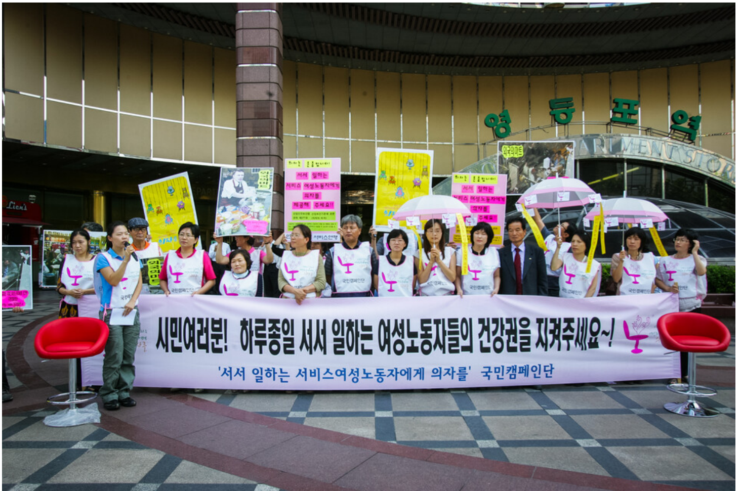
민주노총과 서비스연맹이 여성단체와 함께 28일 오후 서울 영등포역 앞에서 '서서 일하는 서비스 여성 노동자에게 의자를' 캠페인을 갖고 서서 일하는 여성노동자들의 건강권을 지켜주자며 선전전을 벌이고 있다.