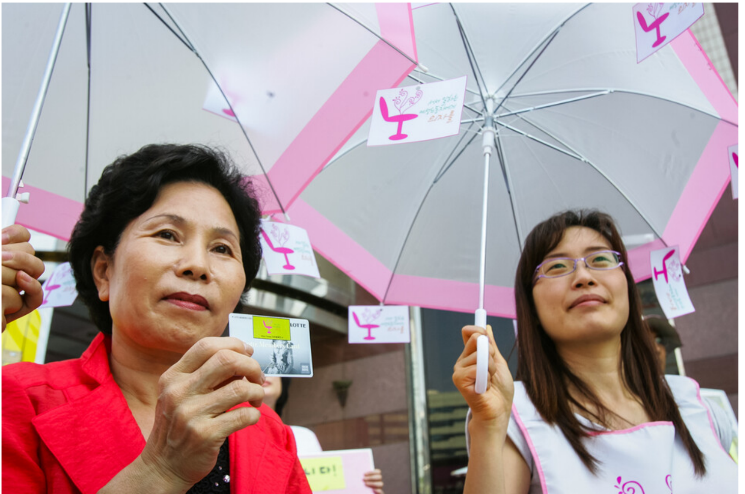
민주노총과 서비스연맹이 여성단체와 함께 28일 오후 서울 영등포역 앞에서 '서서 일하는 서비스 여성 노동자에게 의자를' 캠페인을 갖고 서서 일하는 여성노동자들의 건강권을 지켜주자며 선전전을 벌이고 있다.