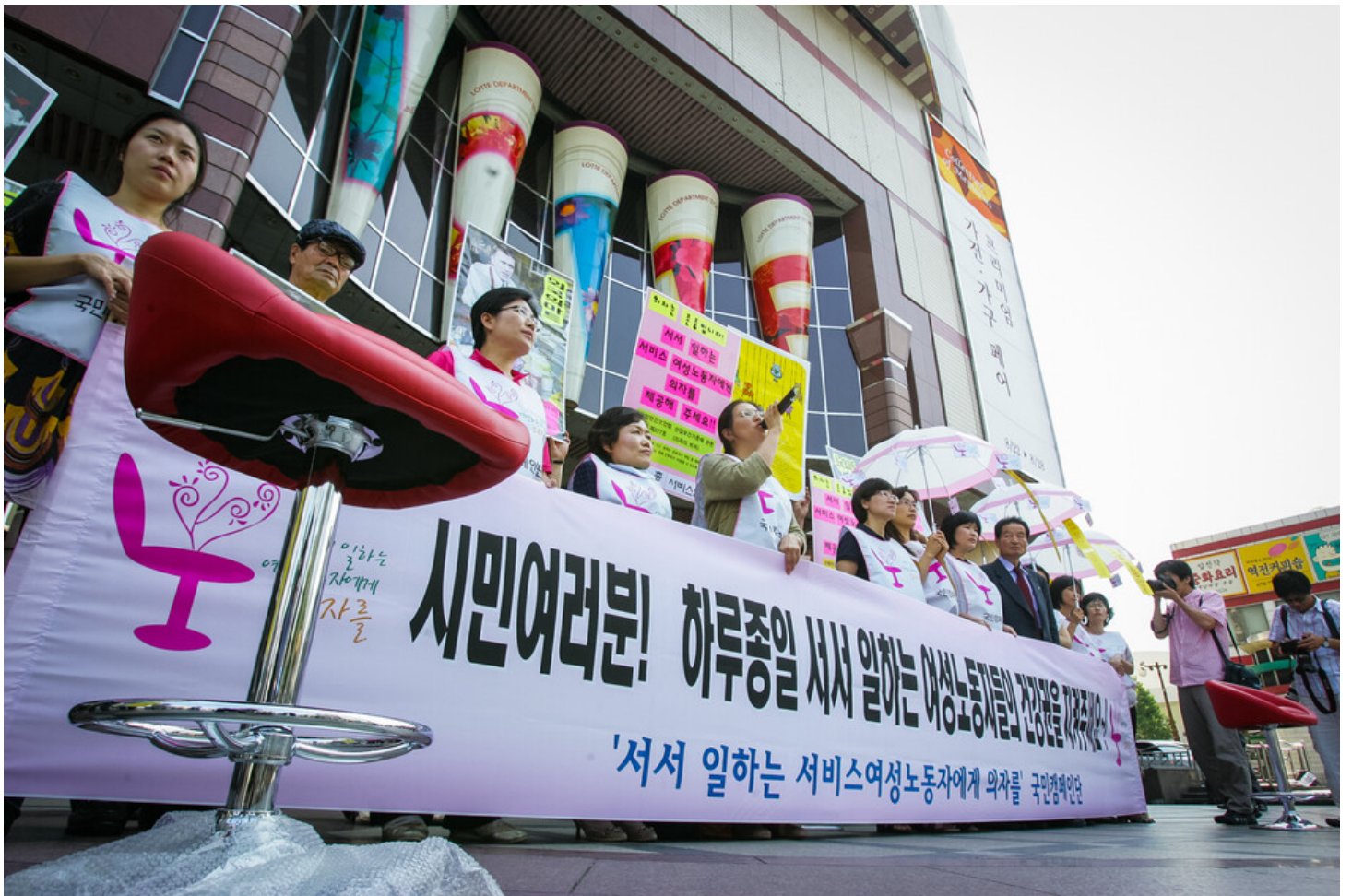
민주노총과 서비스연맹이 여성단체와 함께 28일 오후 서울 영등포역 앞에서 '서서 일하는 서비스 여성 노동자에게 의자를' 캠페인을 갖고 서서 일하는 여성노동자들의 건강권을 지켜주자며 선전전을 벌이고 있다.

민주노동당이 오랜 기간동안 서서 일하는 여성노동자 건강권 확보를 위해 애써왔고, 민주당도 범국민 의자캠페인에 대해 상당한 관심을 기울이고 있는 것으로 알려졌다. 감정노동자들이 일상적으로 겪는 '산업재해'에 버금가고 끝내 과도한 스트레스때문에 '우울증과 자살'로 이어지는 현실이다.