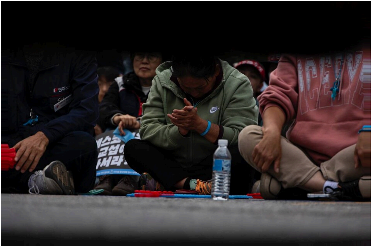
민주노총과 아리셀 산재피해가족협의회, 아리셀참사대책위원회가 29일 오후 4시 경기 광주시 에스코넥 본사 앞에서 중대재해 참사 해결을 촉구하는 집회를 열고 책임자 처벌과 교섭을 요구했다. 아리셀 중대재해 참사 128일을 맞은 이날까지 유가족은 에스코넥 본사 앞에서 20일째 농성 중이다.