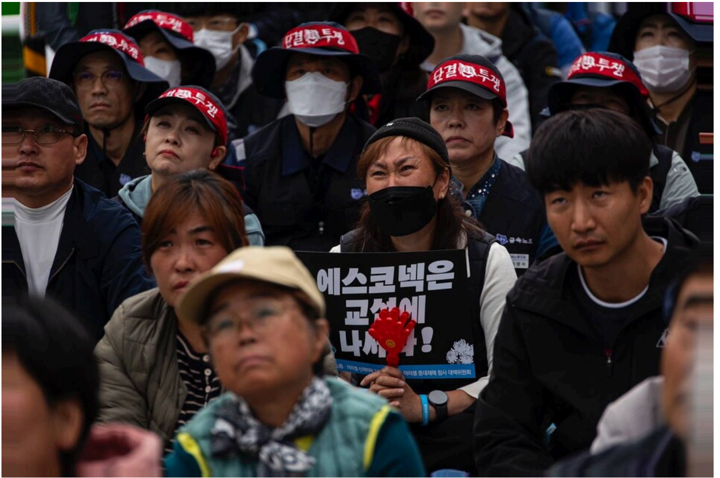
민주노총과 아리셀 산재피해가족협의회, 아리셀참사대책위원회가 29일 오후 4시 경기 광주시 에스코넥 본사 앞에서 중대재해 참사 해결을 촉구하는 집회를 열고 책임자 처벌과 교섭을 요구했다. 아리셀 중대재해 참사 128일을 맞은 이날까지 유가족은 에스코넥 본사 앞에서 20일째 농성 중이다.