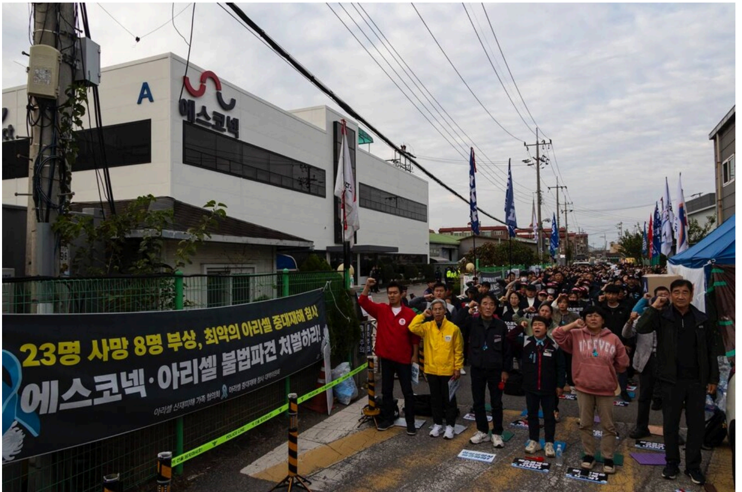
민주노총과 아리셀 산재피해가족협의회, 아리셀참사대책위원회가 29일 오후 4시 경기 광주시 에스코넥 본사 앞에서 중대재해 참사 해결을 촉구하는 집회를 열고 책임자 처벌과 교섭을 요구했다. 아리셀 중대재해 참사 128일을 맞은 이날까지 유가족은 에스코넥 본사 앞에서 20일째 농성 중이다.