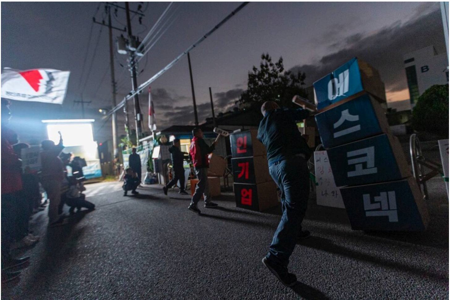
민주노총과 아리셀 산재피해가족협의회, 아리셀참사대책위원회가 29일 오후 4시 경기 광주시 에스코넥 본사 앞에서 중대재해 참사 해결을 촉구하는 집회를 열고 책임자 처벌과 교섭을 요구했다. 참가자들이 에스코넥 본사 앞에서 상징의식을 하고 있다.