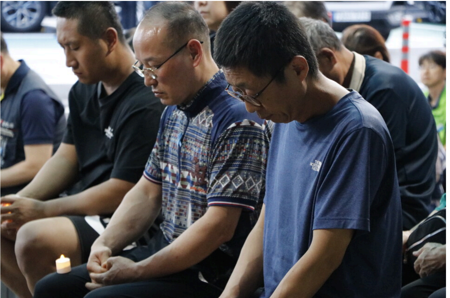
7월 5일 다섯번째 아리셀 중대재해 시민추모제가 화성시청 본관 앞에서 진행됐다.