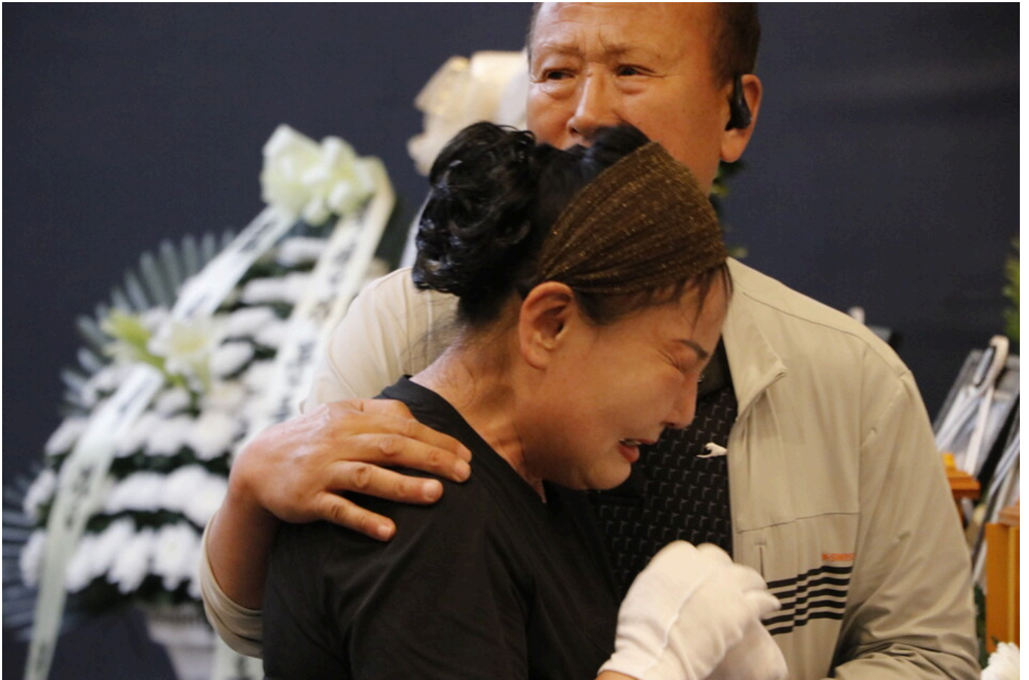
7월 5일 다섯번째 아리셀 중대재해 시민추모제가 화성시청 본관 앞에서 진행됐다.

아리셀 중대재해 참사를 상징하는 색깔이 유족의 뜻에 따라 하늘색으로 결정됐다. 유족들은 논의 끝에 아리셀 중대재해 참사를 기억하고 재발 방지를 다짐하는 상징색을 '하늘색'으로 결정했다. 화성시 '모두누림센터'에는 '수원 노란리본공작소' 활동가들이 방문해 유가족과 함께 상징색으로 정한 '하늘색 리본'을 만들어 나누어 달았다.