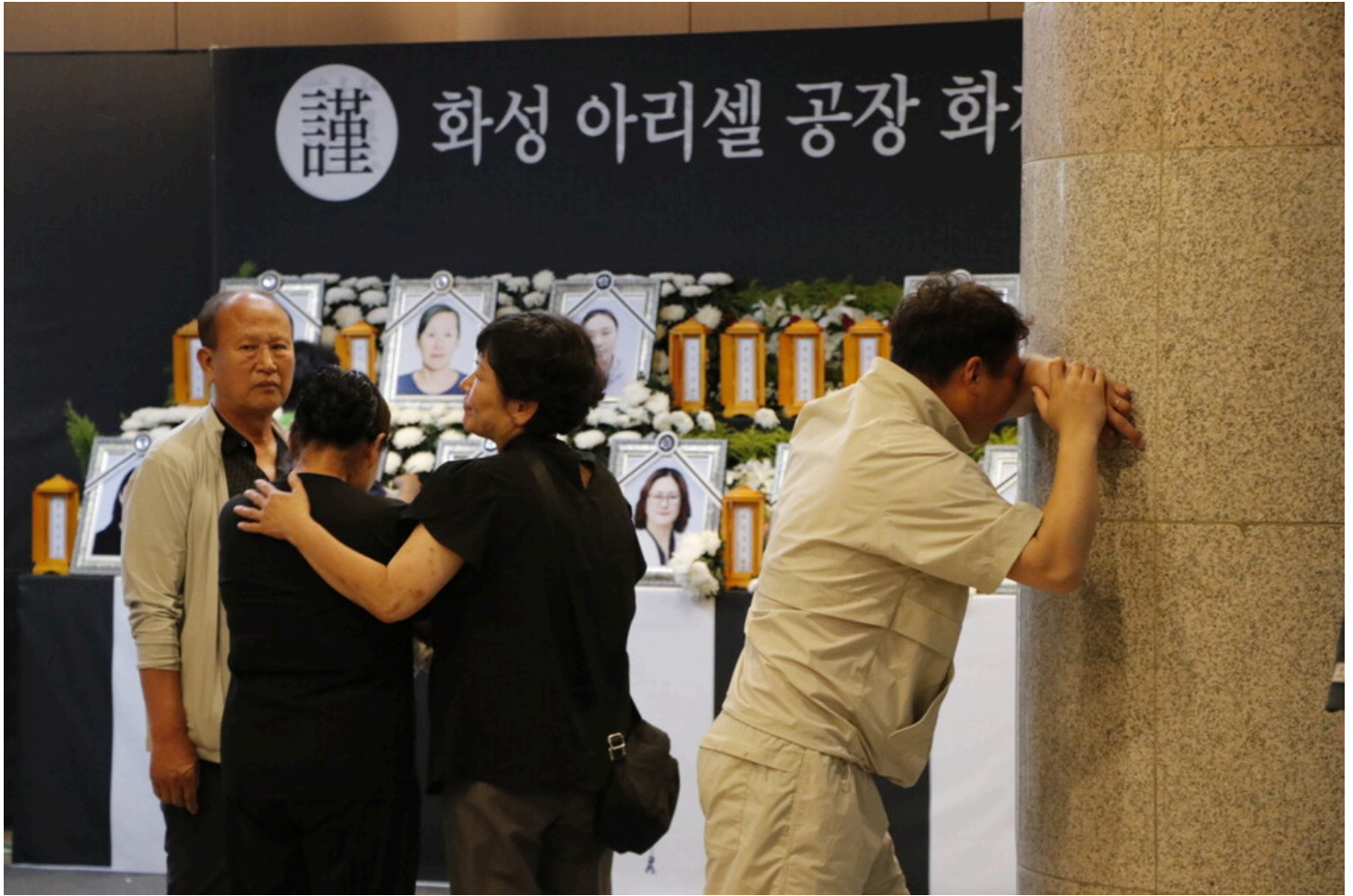
7월 5일 다섯번째 아리셀 중대재해 시민추모제가 화성시청 본관 앞에서 진행됐다.

아리셀과의 첫번째 교섭, 사측은 아무런 준비도 없었다 시민추모제 "더이상 노동자가 죽음에 내던져지지 않게"