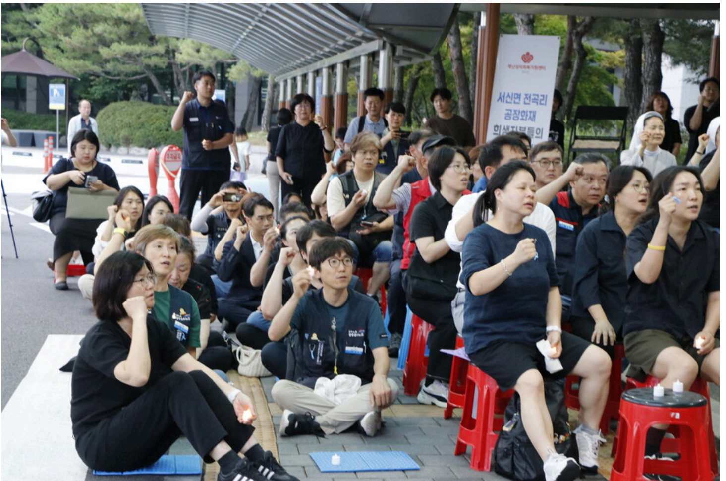
7월 5일 다섯번째 아리셀 중대재해 시민추모제가 화성시청 본관 앞에서 진행됐다.