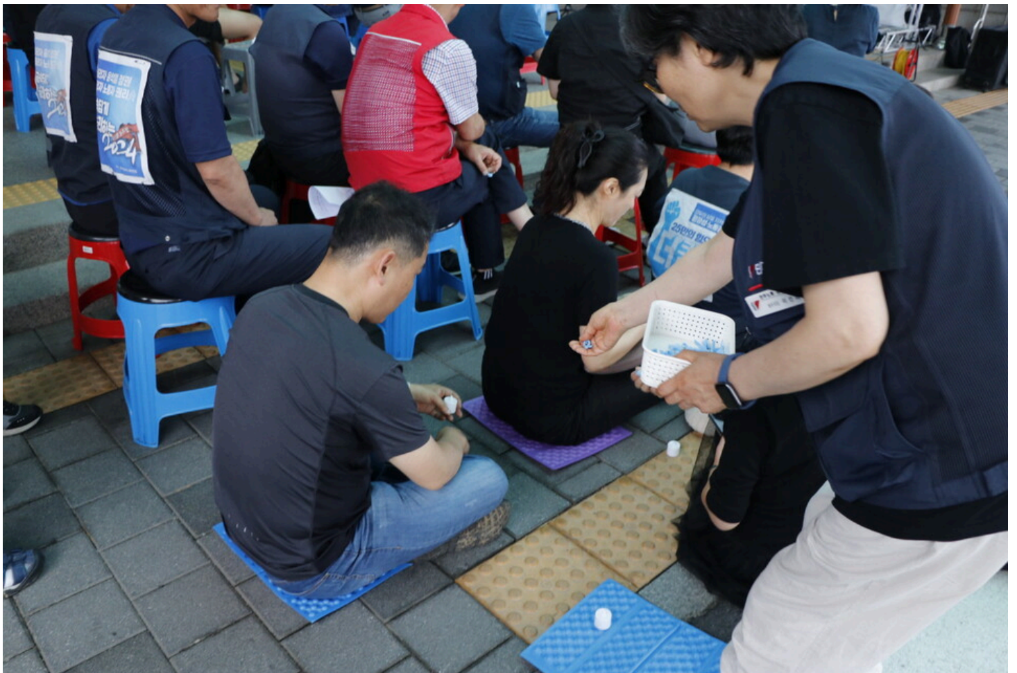
7월 5일 다섯번째 아리셀 중대재해 시민추모제가 화성시청 본관 앞에서 진행됐다.