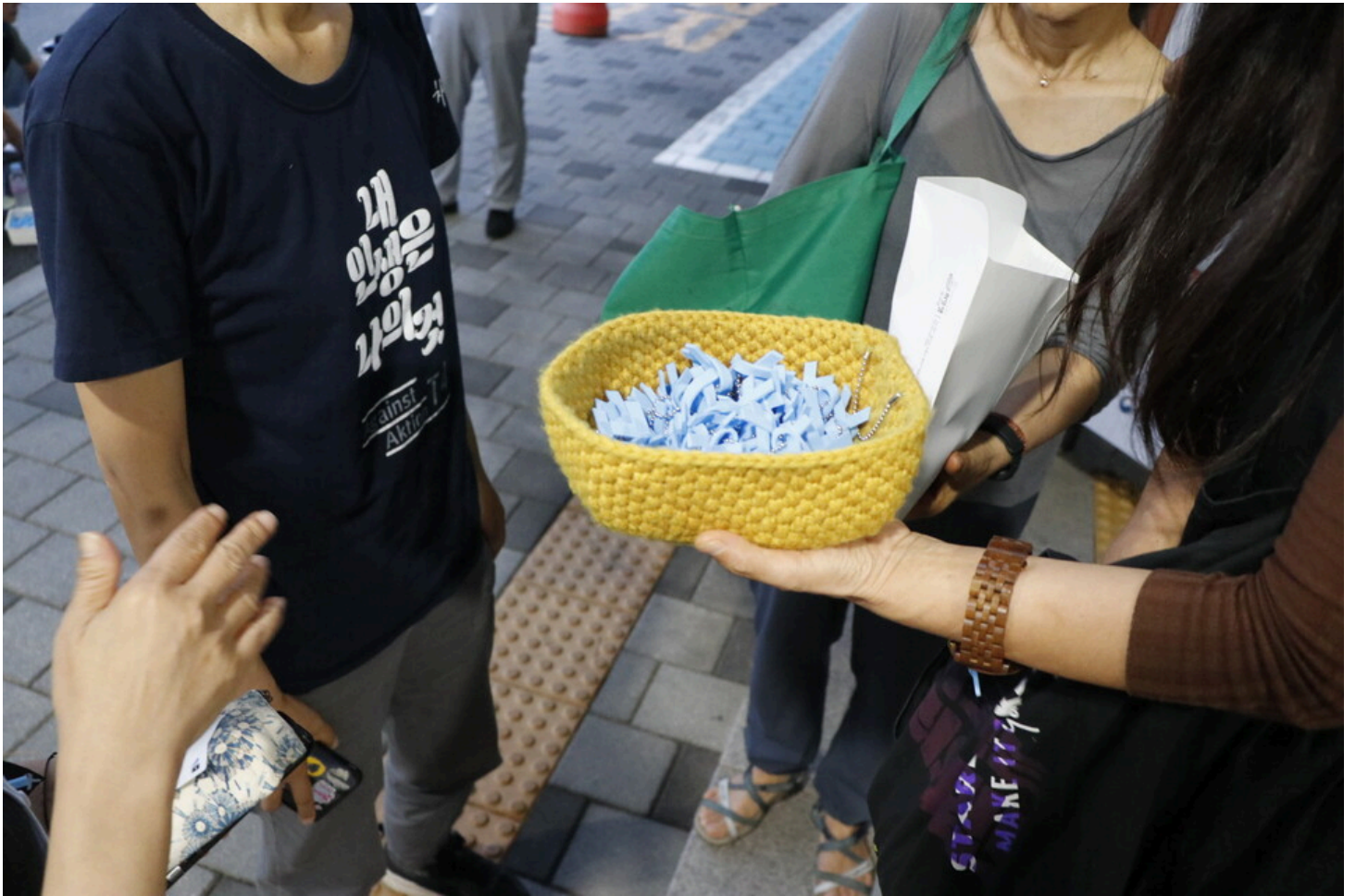
7월 5일 다섯번째 아리셀 중대재해 시민추모제가 화성시청 본관 앞에서 진행됐다.