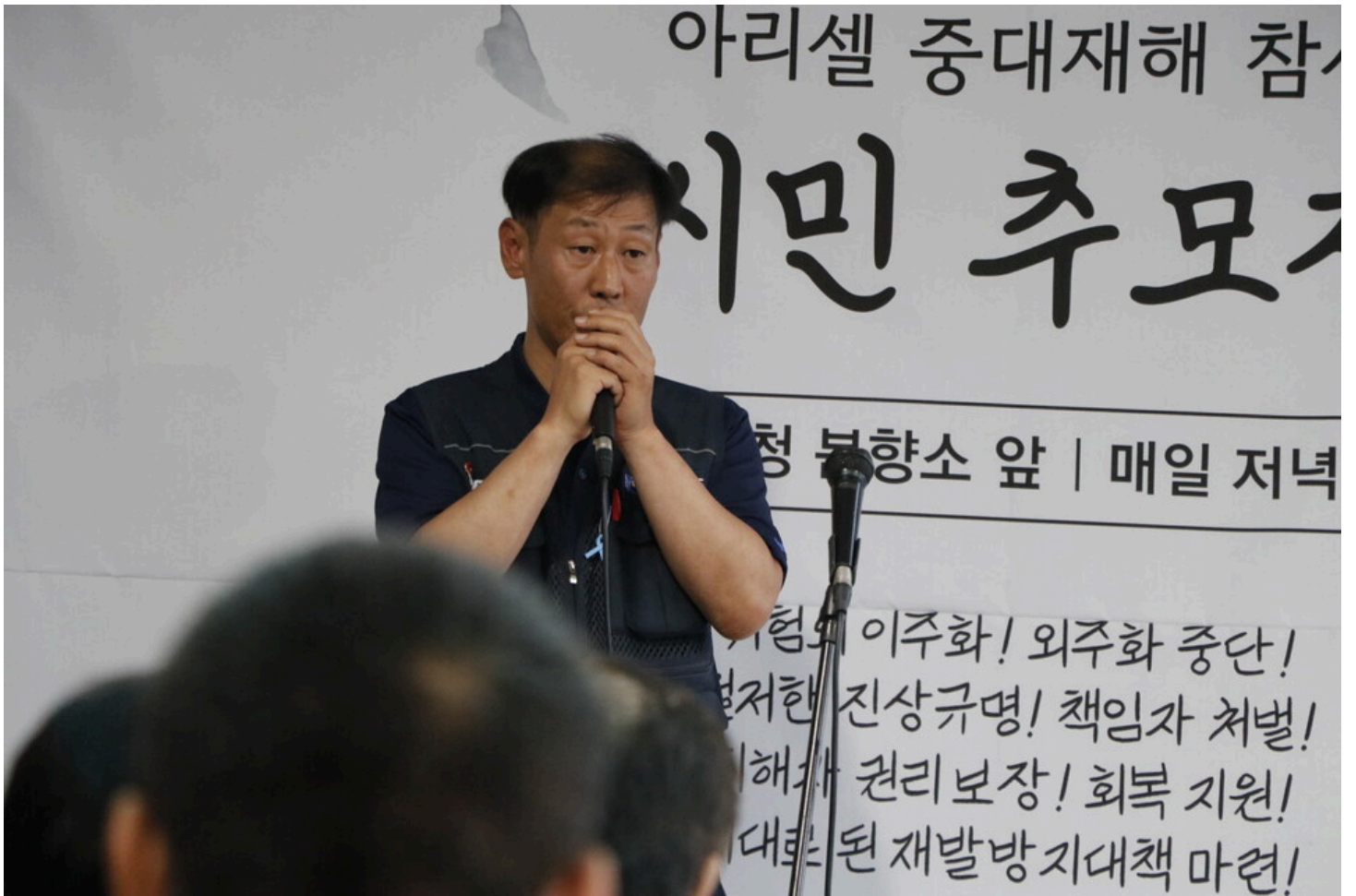
7월 5일 다섯번째 아리셀 중대재해 시민추모제가 화성시청 본관 앞에서 진행됐다.