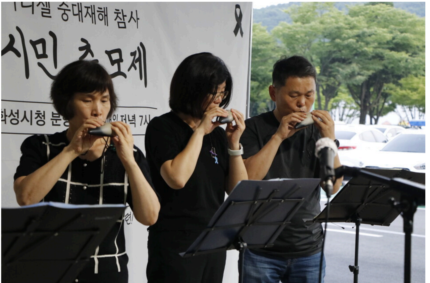
7월 5일 다섯번째 아리셀 중대재해 시민추모제가 화성시청 본관 앞에서 진행됐다.