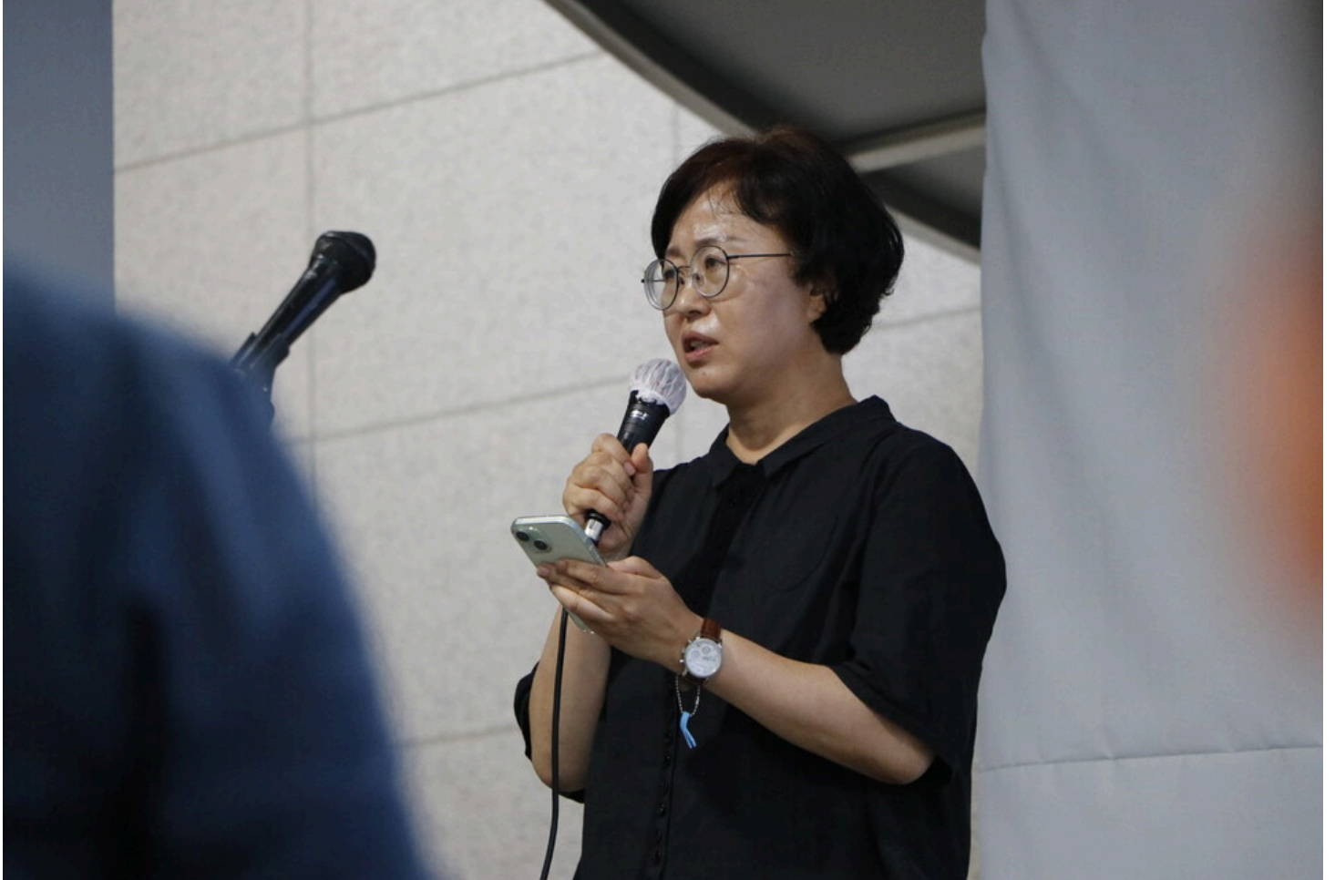
7월 5일 다섯번째 아리셀 중대재해 시민추모제가 화성시청 본관 앞에서 진행됐다.