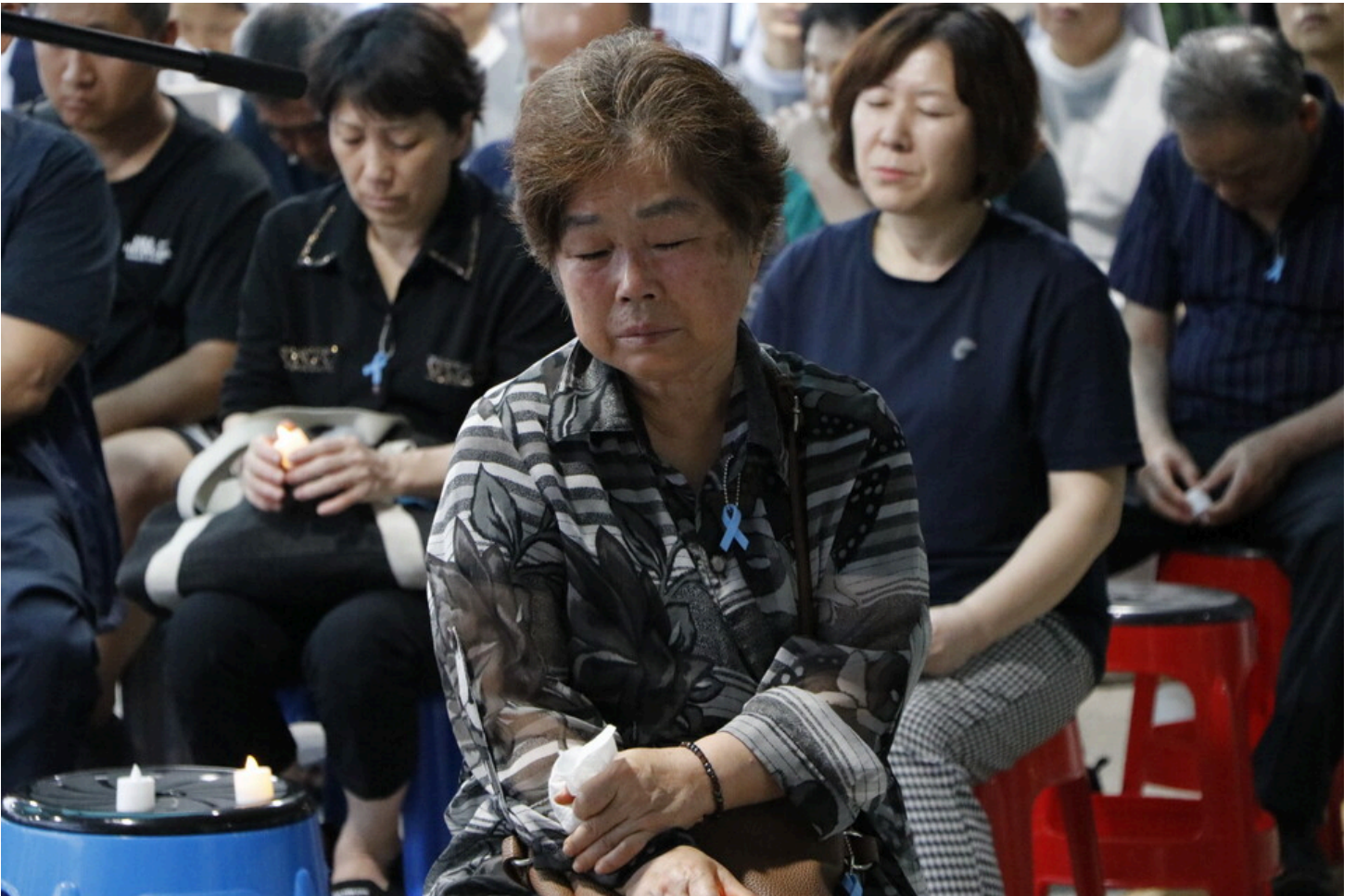
7월 5일 다섯번째 아리셀 중대재해 시민추모제가 화성시청 본관 앞에서 진행됐다.