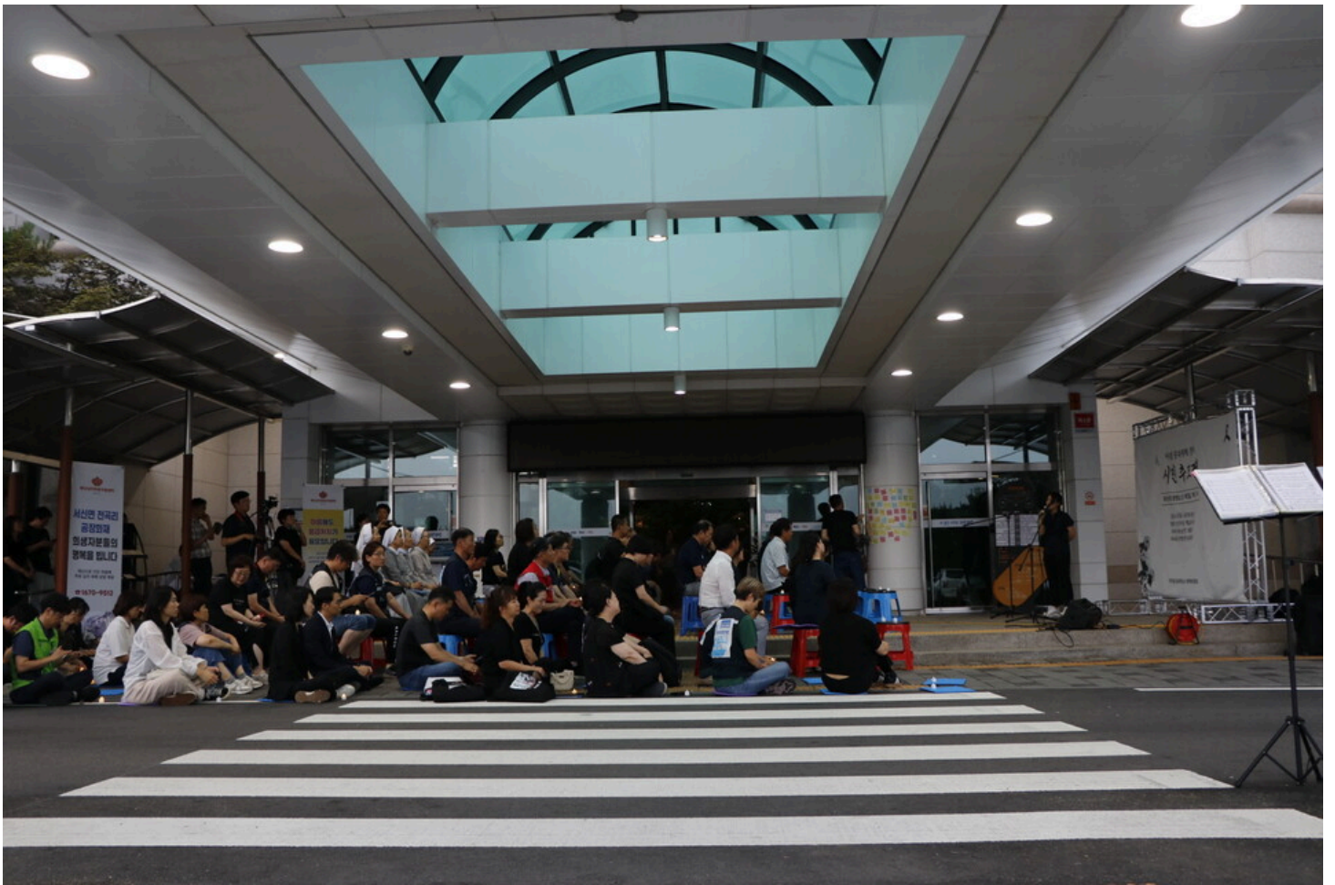
7월 5일 다섯번째 아리셀 중대재해 시민추모제가 화성시청 본관 앞에서 진행됐다.