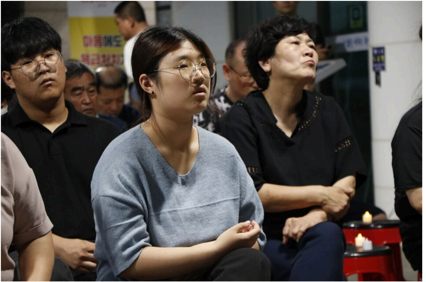
아리셀 중대재해 네 번째 시민추모제가 화성시청 본관 앞에서 4일 오후 7시 열렸다.