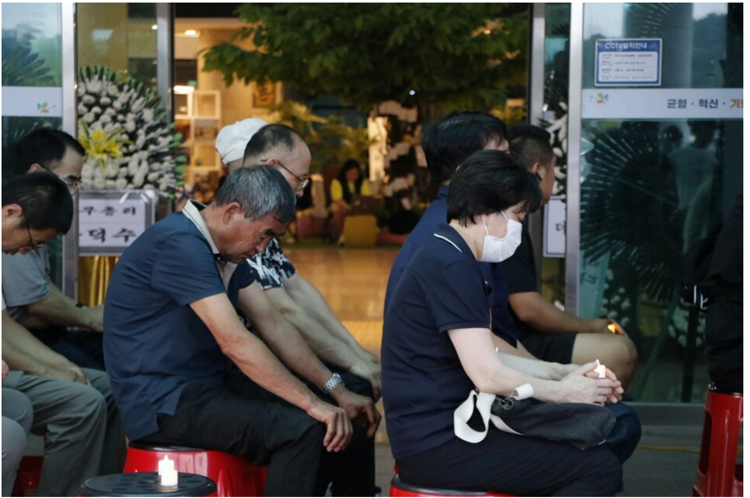
아리셀 중대재해 네 번째 시민추모제가 화성시청 본관 앞에서 4일 오후 7시 열렸다.