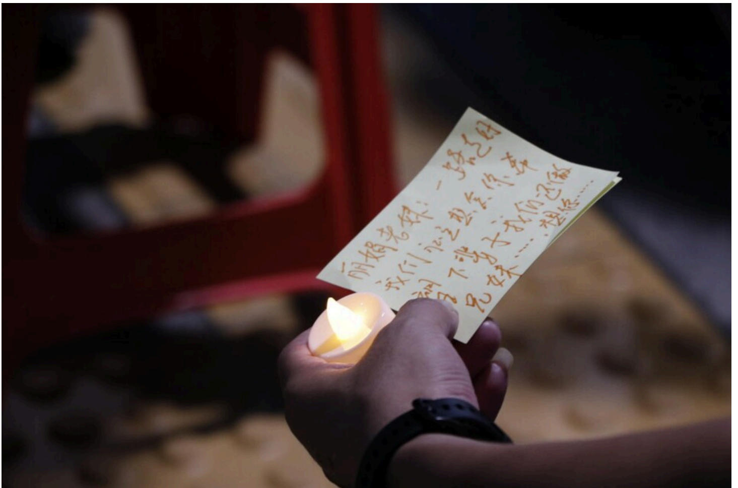
아리셀 중대재해 네 번째 시민추모제가 화성시청 본관 앞에서 4일 오후 7시 열렸다.