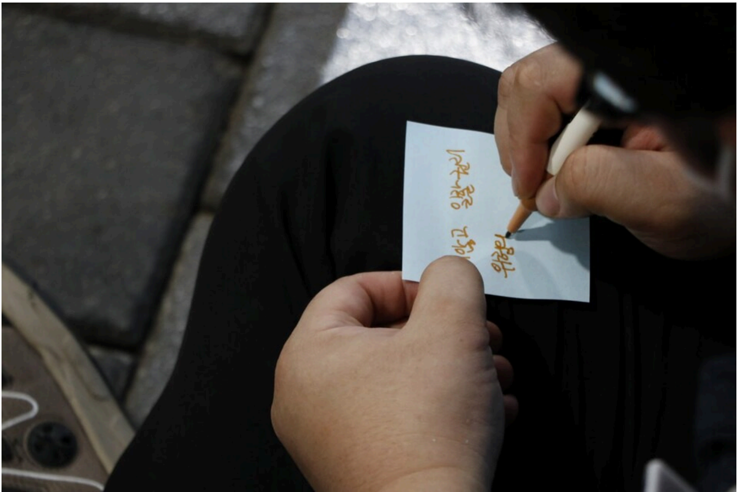
아리셀 중대재해 네 번째 시민추모제가 화성시청 본관 앞에서 4일 오후 7시 열렸다.