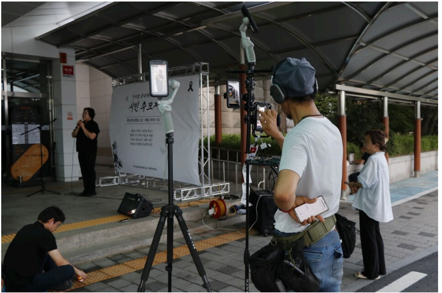
아리셀 중대재해 네 번째 시민추모제가 화성시청 본관 앞에서 4일 오후 7시 열렸다.