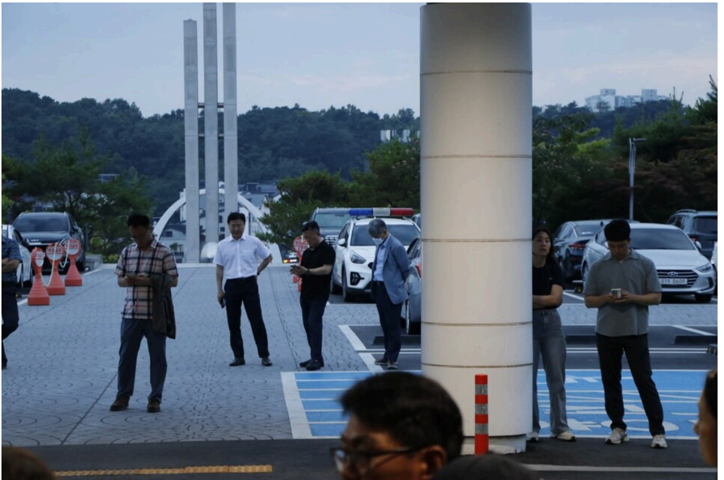
아리셀 중대재해 네 번째 시민추모제가 화성시청 본관 앞에서 4일 오후 7시 열렸다.

추모제 앞의 자리를 끝까지 지키는 유족도 있고, 중간에 자리를 뜨는 유족도 있다. 자리를 뜬 유족들은 류금신의 구슬픈 노래를 배경으로 가족의 영정을 다시 한번 보러갔다. 내새끼 얼굴한번 사진으로나마 한번 더 만져본다. 화성시청 안에서 밖에서 공무원들은 떠나지 않고 행사를 지켜본다. 발언을 듣는듯 하다가 무언가를 보고하는 듯 하다가 한다. 이들이 곧바로 화성시의 얼굴이다.