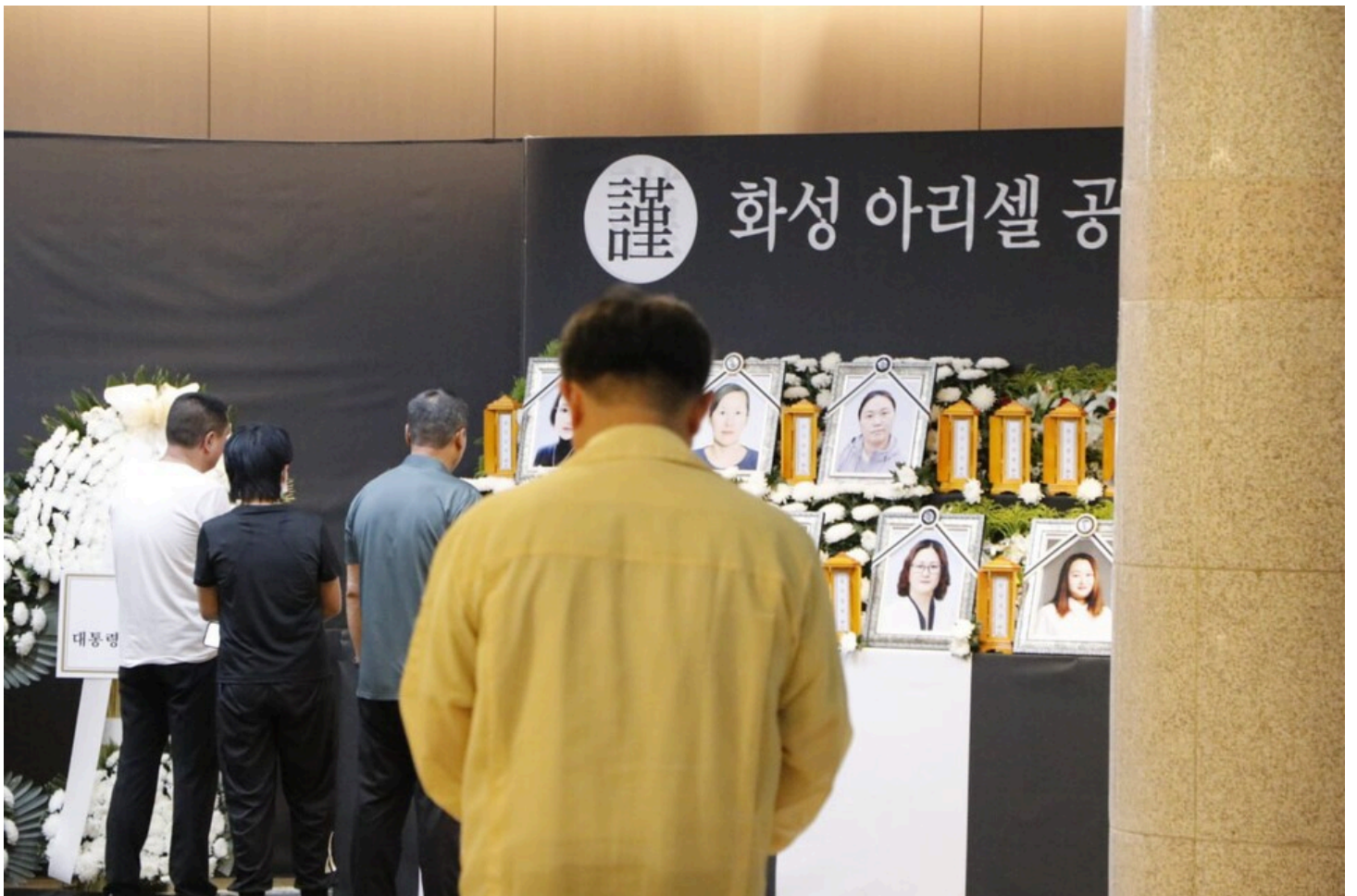
아리셀 중대재해 네 번째 시민추모제가 화성시청 본관 앞에서 4일 오후 7시 열렸다.