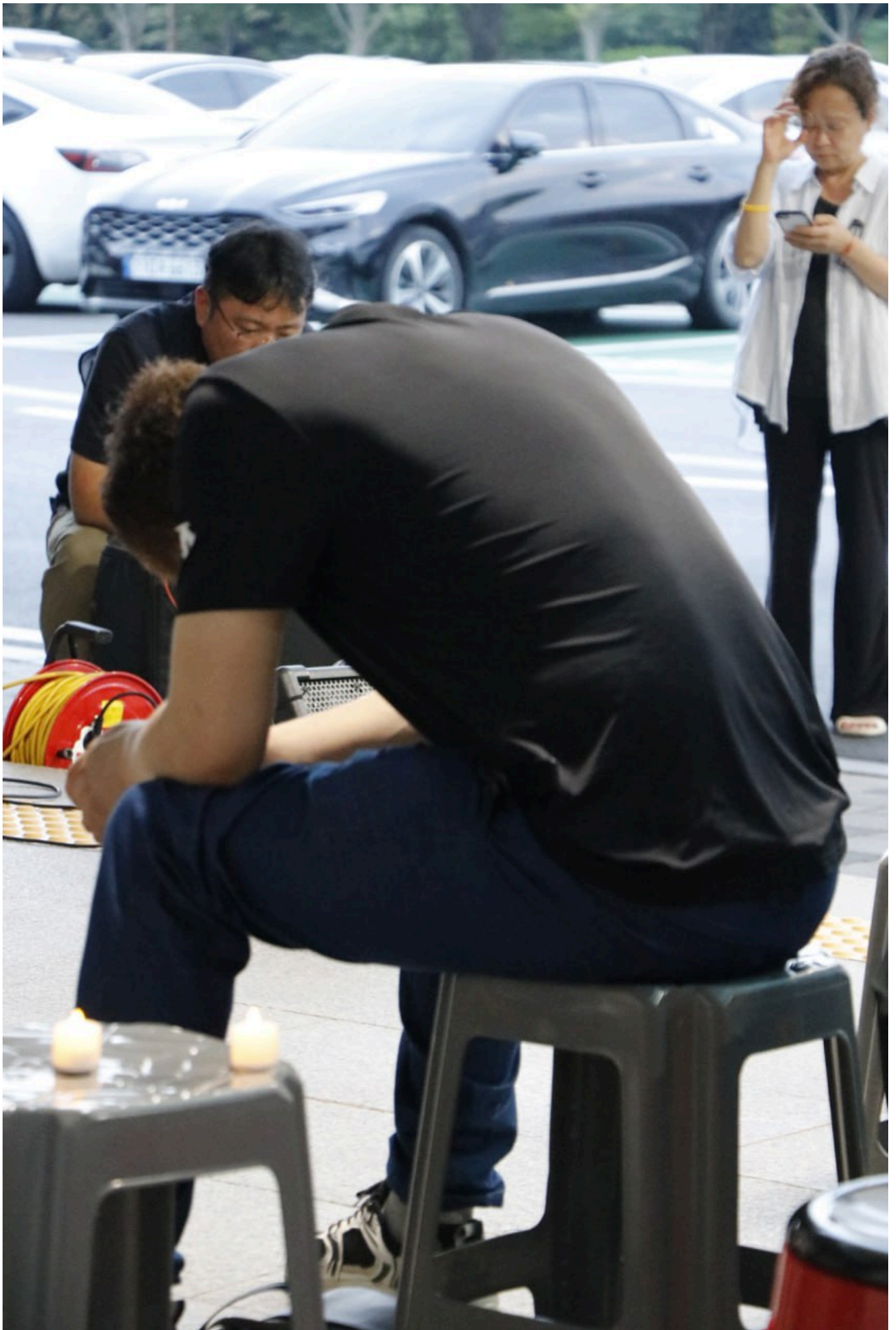
아리셀 중대재해 네 번째 시민추모제가 화성시청 본관 앞에서 4일 오후 7시 열렸다.