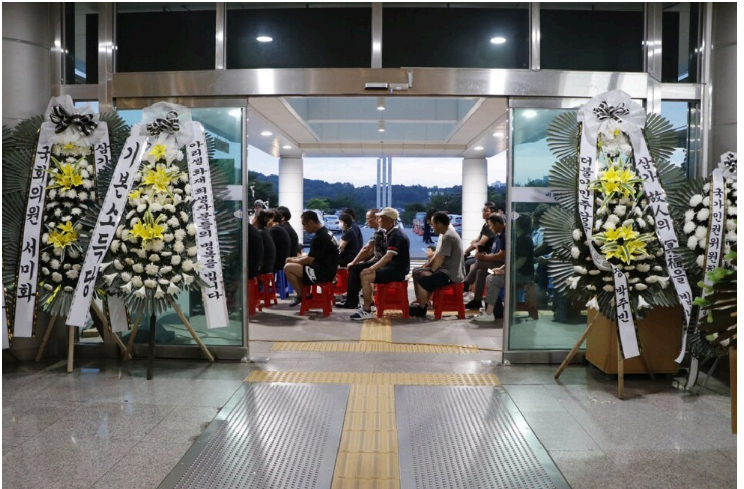
아리셀 중대재해 네 번째 시민추모제가 화성시청 본관 앞에서 4일 오후 7시 열렸다.

오늘 7월 5일 다섯 번째 시민추모제가 열린다. 화성시 날씨는 어제와 비슷할 것이라는 예보다.