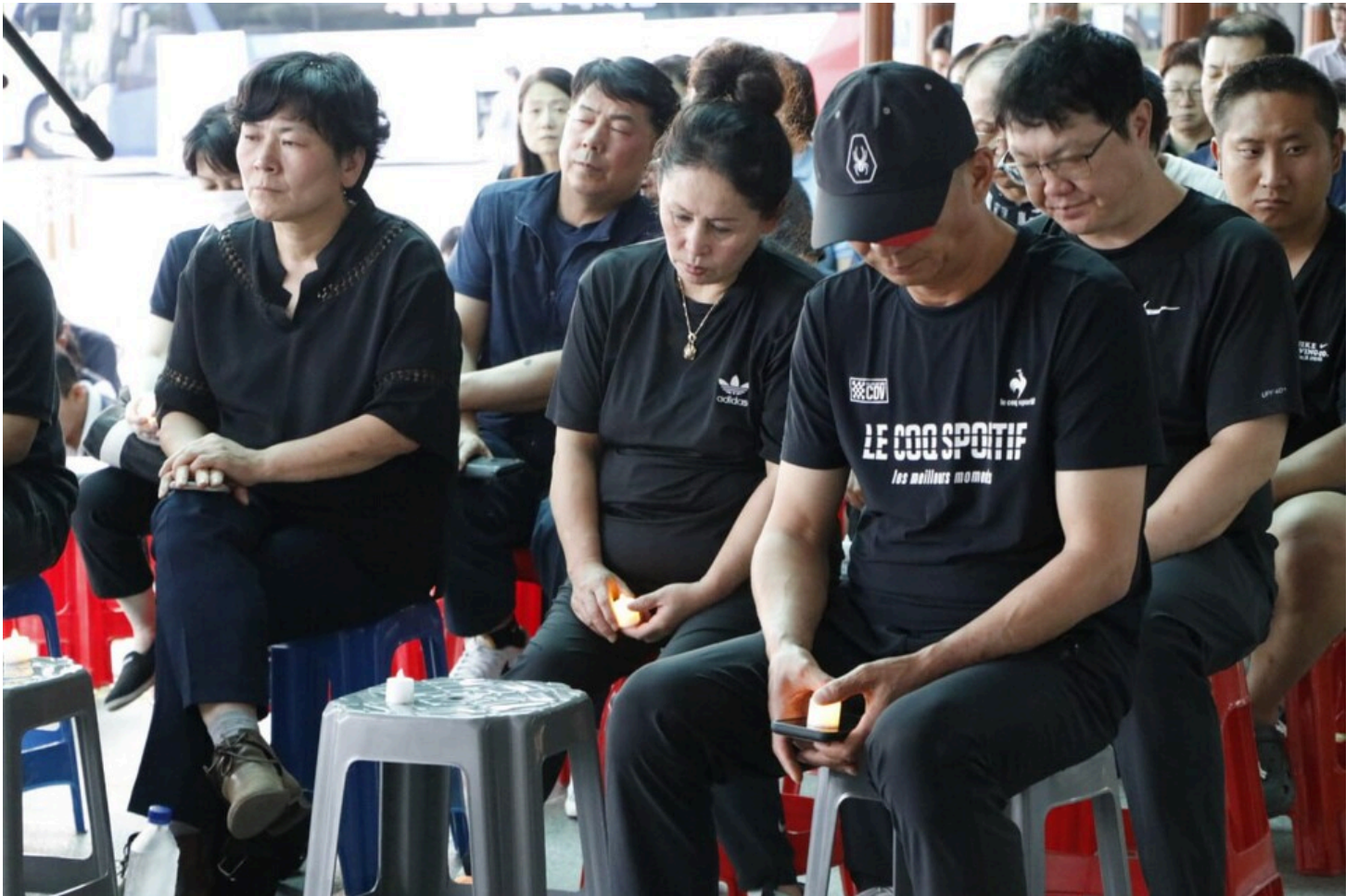
아리셀 중대재해 네 번째 시민추모제가 화성시청 본관 앞에서 4일 오후 7시 열렸다.