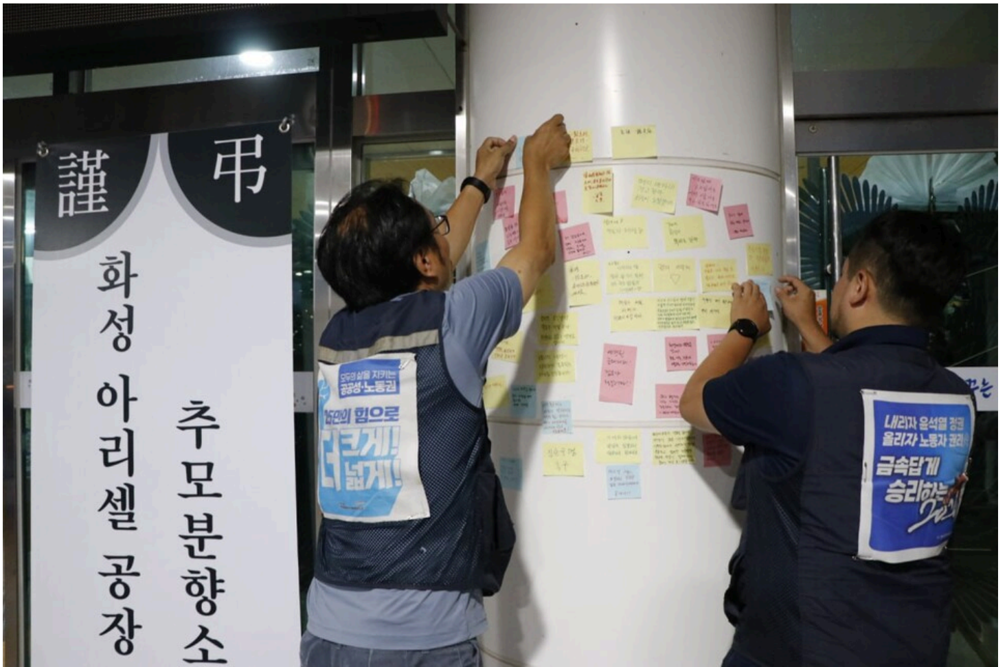
아리셀 중대재해 네 번째 시민추모제가 화성시청 본관 앞에서 4일 오후 7시 열렸다.