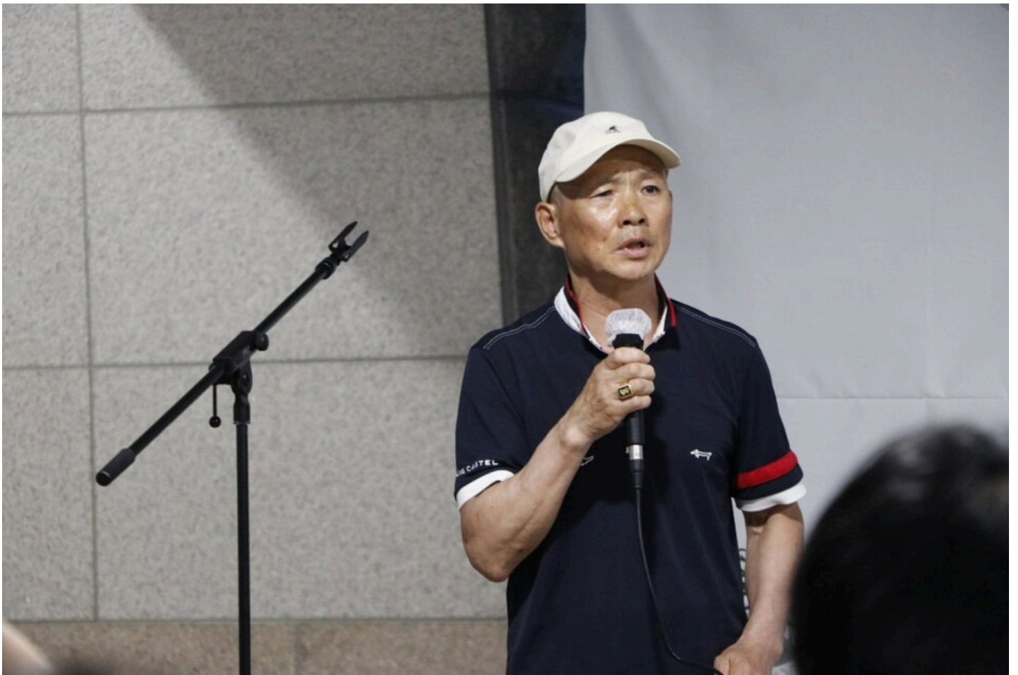
아리셀 중대재해 네 번째 시민추모제가 화성시청 본관 앞에서 4일 오후 7시 열렸다.