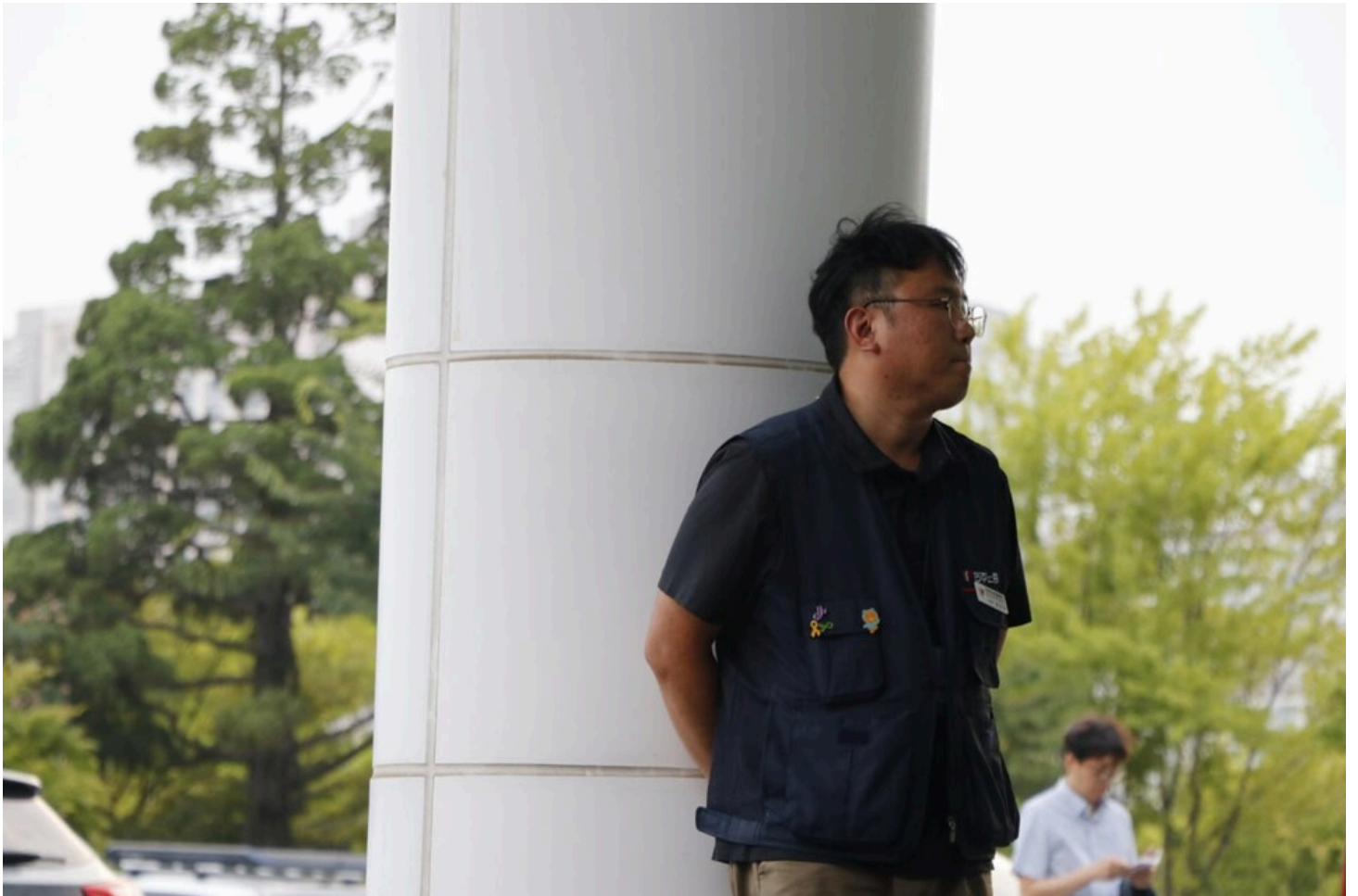
아리셀 중대재해 네 번째 시민추모제가 화성시청 본관 앞에서 4일 오후 7시 열렸다.