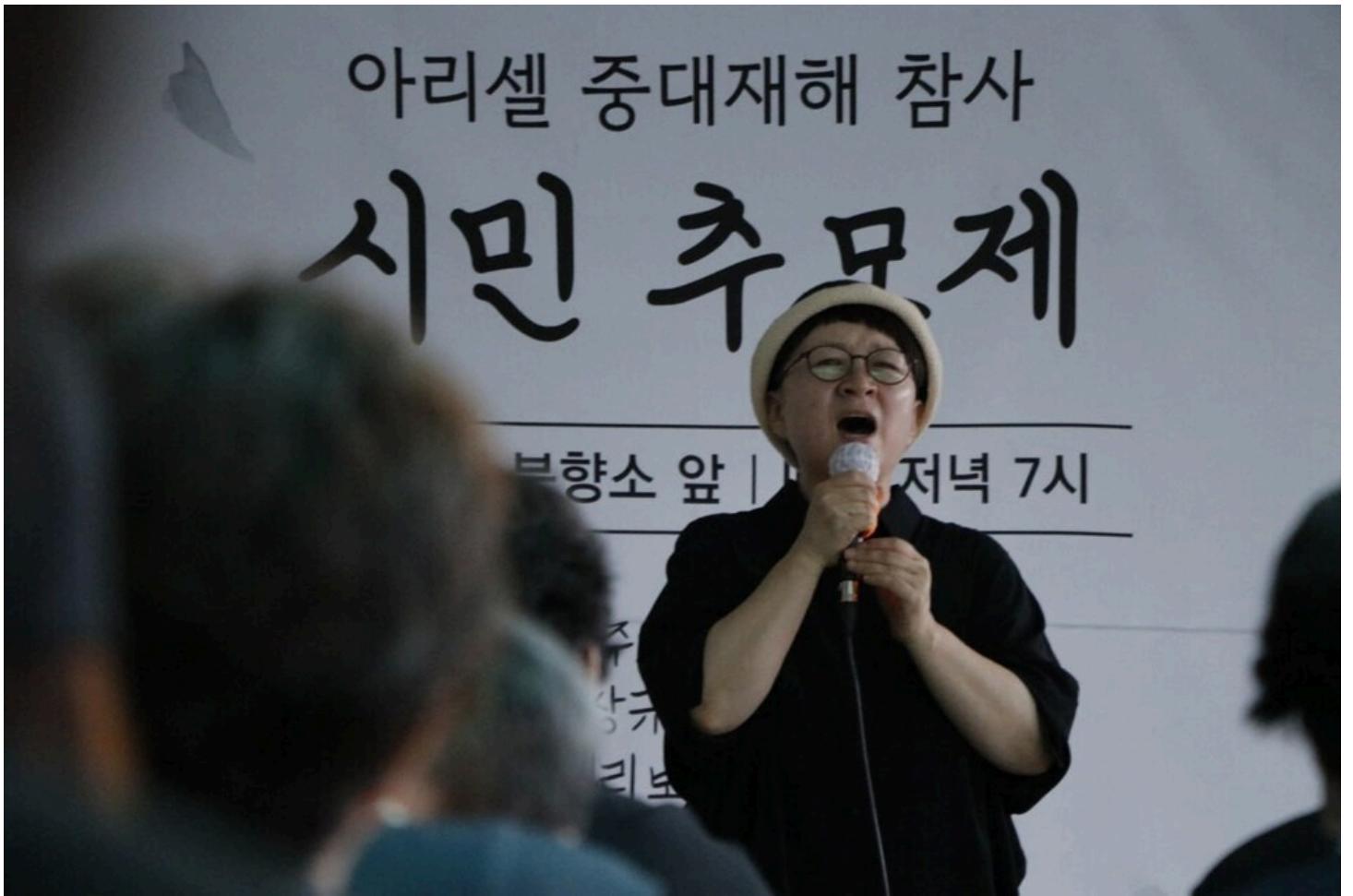
아리셀 중대재해 네 번째 시민추모제가 화성시청 본관 앞에서 4일 오후 7시 열렸다.