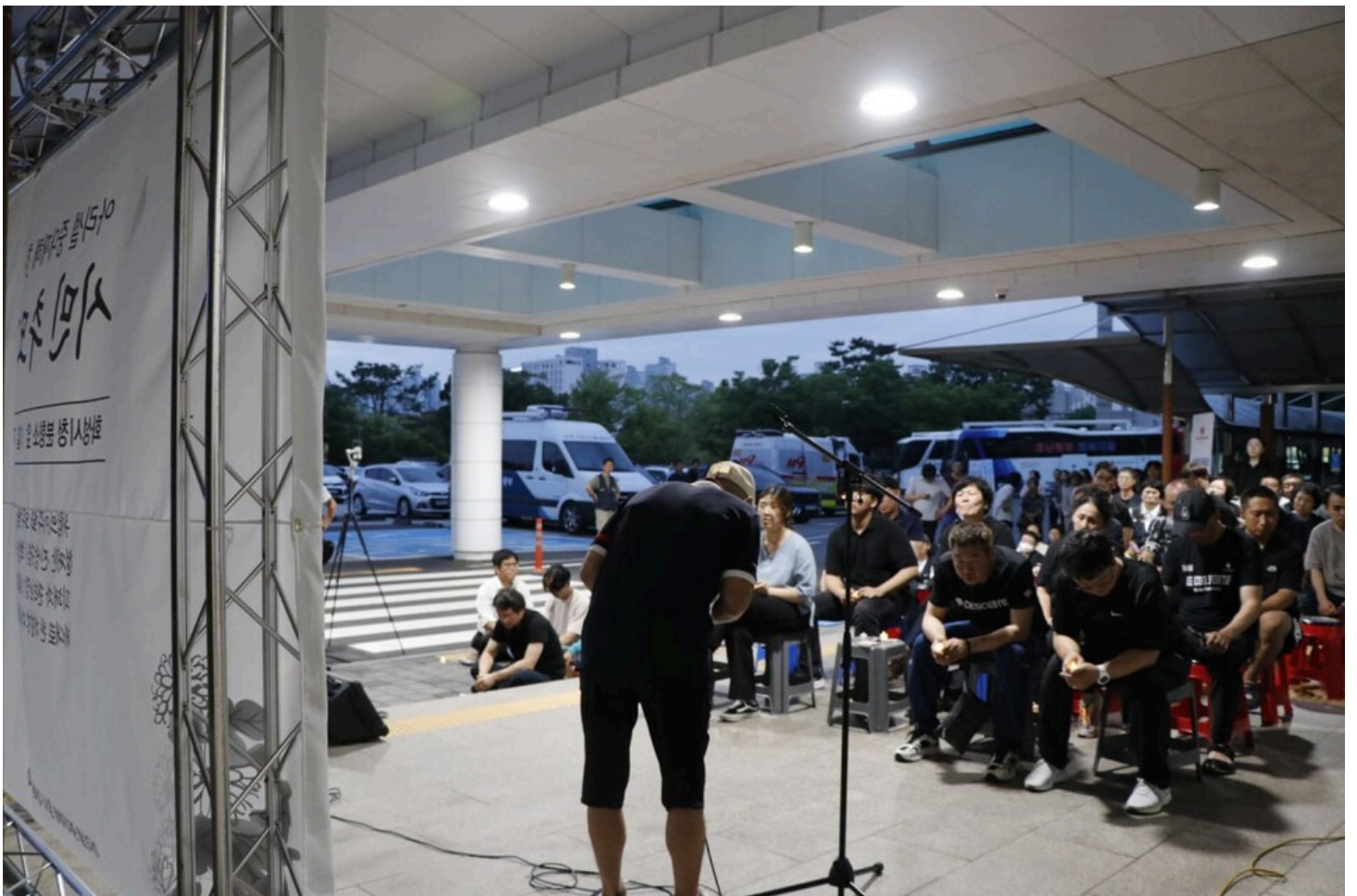
아리셀 중대재해 네 번째 시민추모제가 화성시청 본관 앞에서 4일 오후 7시 열렸다.