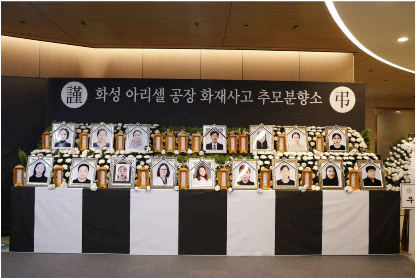
아리셀 중대재해 네 번째 시민추모제가 화성시청 본관 앞에서 4일 오후 7시 열렸다.

유족들은 화성시장 집무실 앞에서 농성했고, 분향소 앞에서도 농성했다. 결국 오후 3시, 화성시청 본관에 도착한 위패와 영정이 드디어 무사히 모셔졌다. 이제서야 희생당한 사람들의 얼굴을 본다. 어떤 유족은 희생자의 이름을 목 놓아 부르며 통곡하다 기력이 다해 응급실로 이송됐다 돌아왔다. 그런 날이었다.