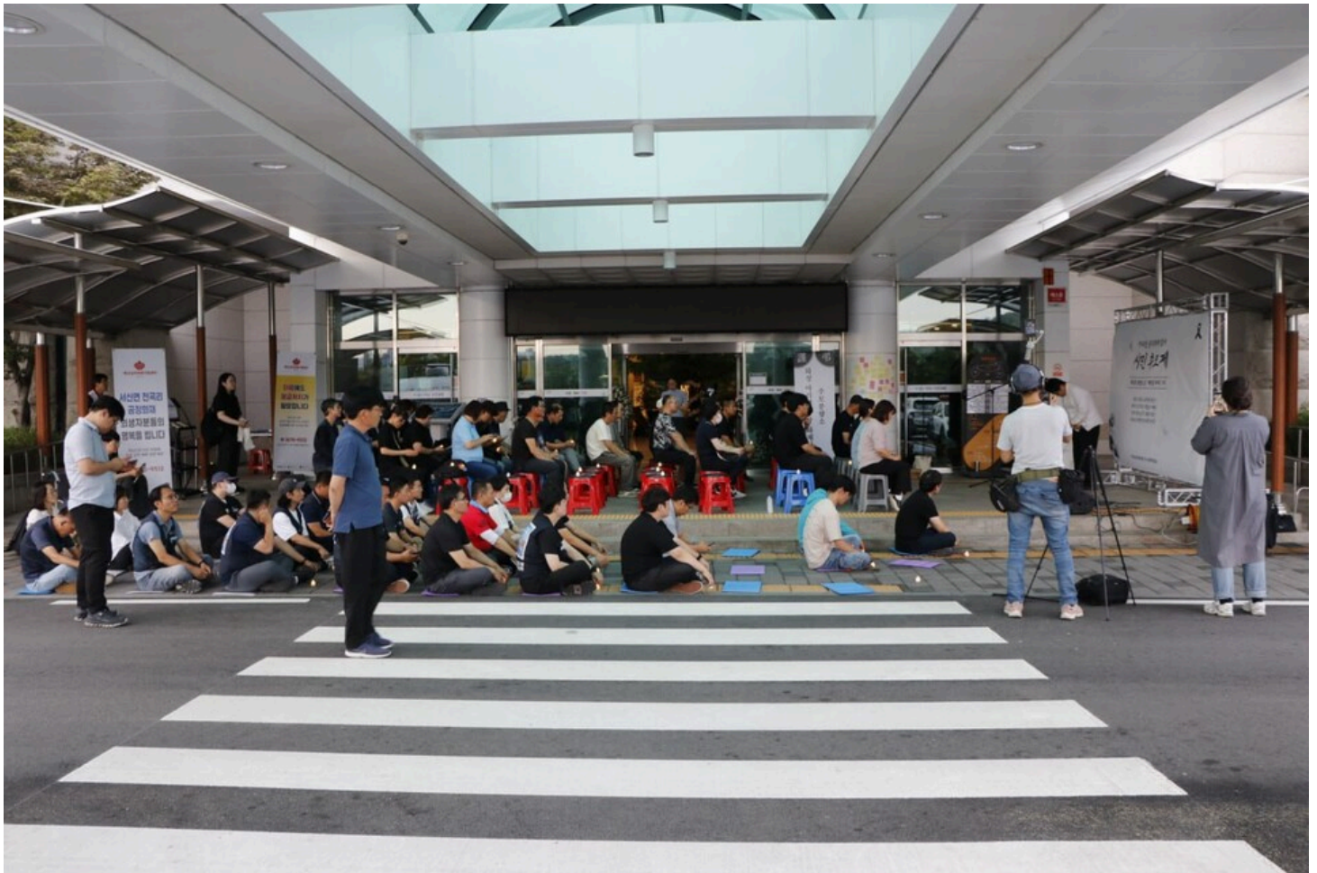
아리셀 중대재해 네 번째 시민추모제가 화성시청 본관 앞에서 4일 오후 7시 열렸다.

일기예보와는 다르게, 천둥을 동반한 비가 오지 않았다. 유족들이 하루종일 쏟아낸 눈물에 비가 물러났는가 싶다. 억울하게 떠난 우리 가족 추모라도 제대로 하게 해달라고, 내질렀던 절규가 아침부터 저녁까지 화성시청을 메워서 천둥이 설자리가 없었는가 싶다.