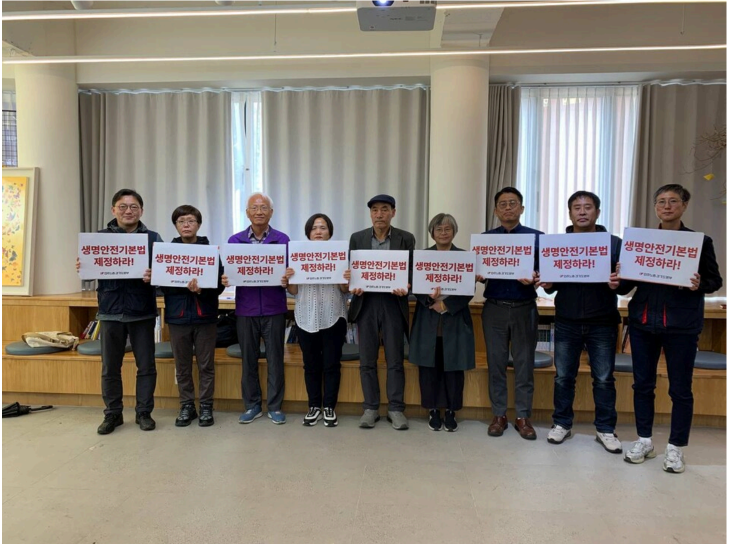
이야기마당의 참여자들이 "생명안전기본법 제정하라!" 손피켓을 들고 있다.