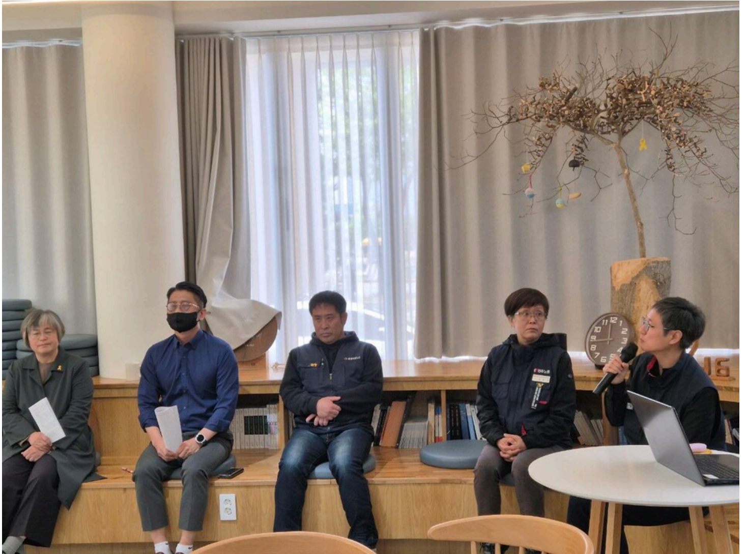
이야기마당 참여자들이 대화하고 있다.