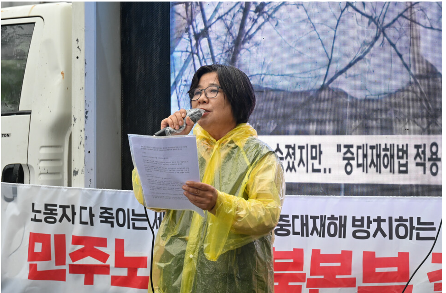
민주노총-생명안전행동이 윤석열표 생명안전 개악 저지를 위한 전국순회투쟁 2일차를 맞아 청주검찰청과 대전 현대프리미엄아울렛, 고용노동부 군산지청 앞에서 오송 궁평 지하차도 참사와 현대프리미엄아울렛 화재참사, 그리고 세아베스틸 군산공장에 대해 철저한 수사와 엄중한 처벌을 촉구했다.