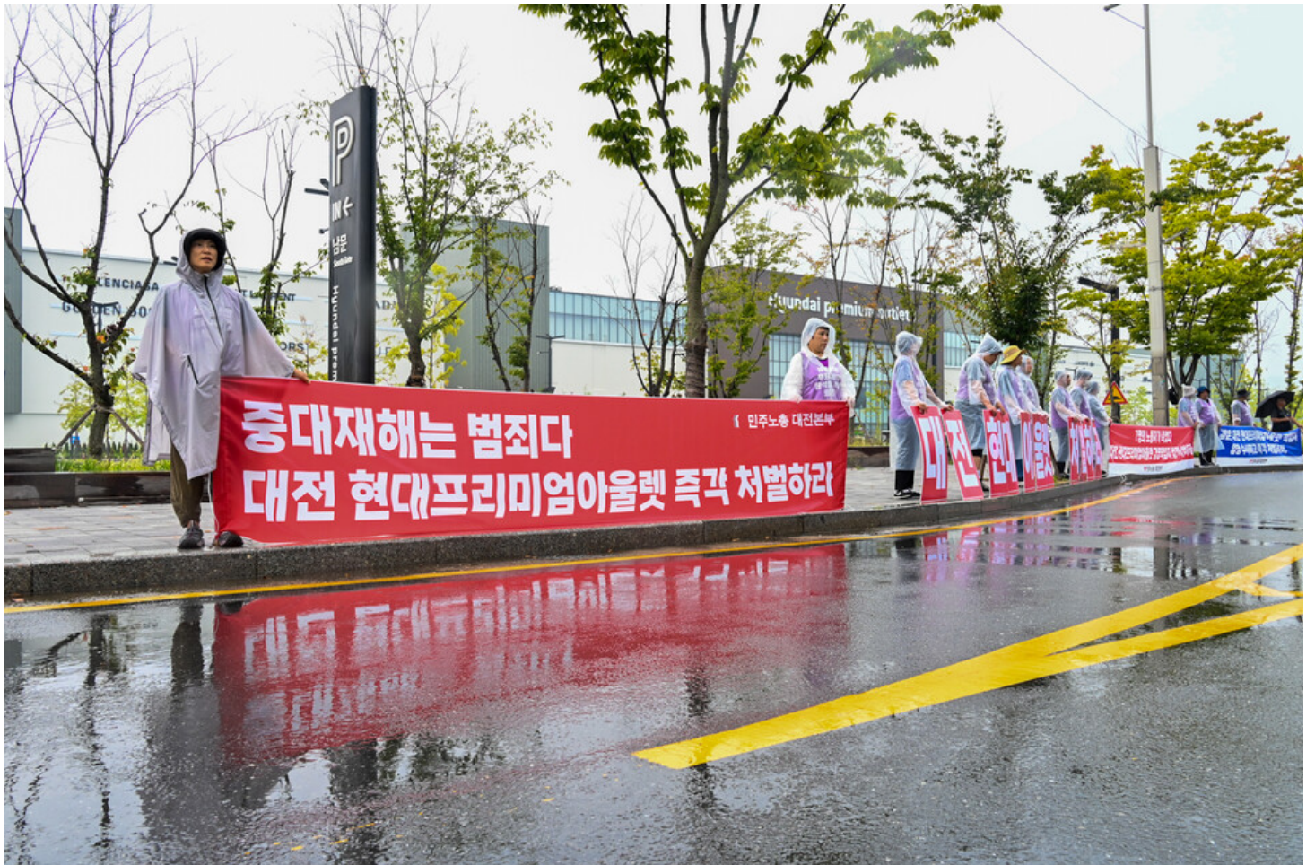
민주노총-생명안전행동이 윤석열표 생명안전 개악 저지를 위한 전국순회투쟁 2일차를 맞아 청주검찰청과 대전 현대프리미엄아울렛, 고용노동부 군산지청 앞에서 오송 공평 지하철도 참사와 현대프리미엄아울렛 화재참사, 그리고 세아베스틸 군산공장에 대해 철저한 수사와 엄중한 처벌을 촉구했다.