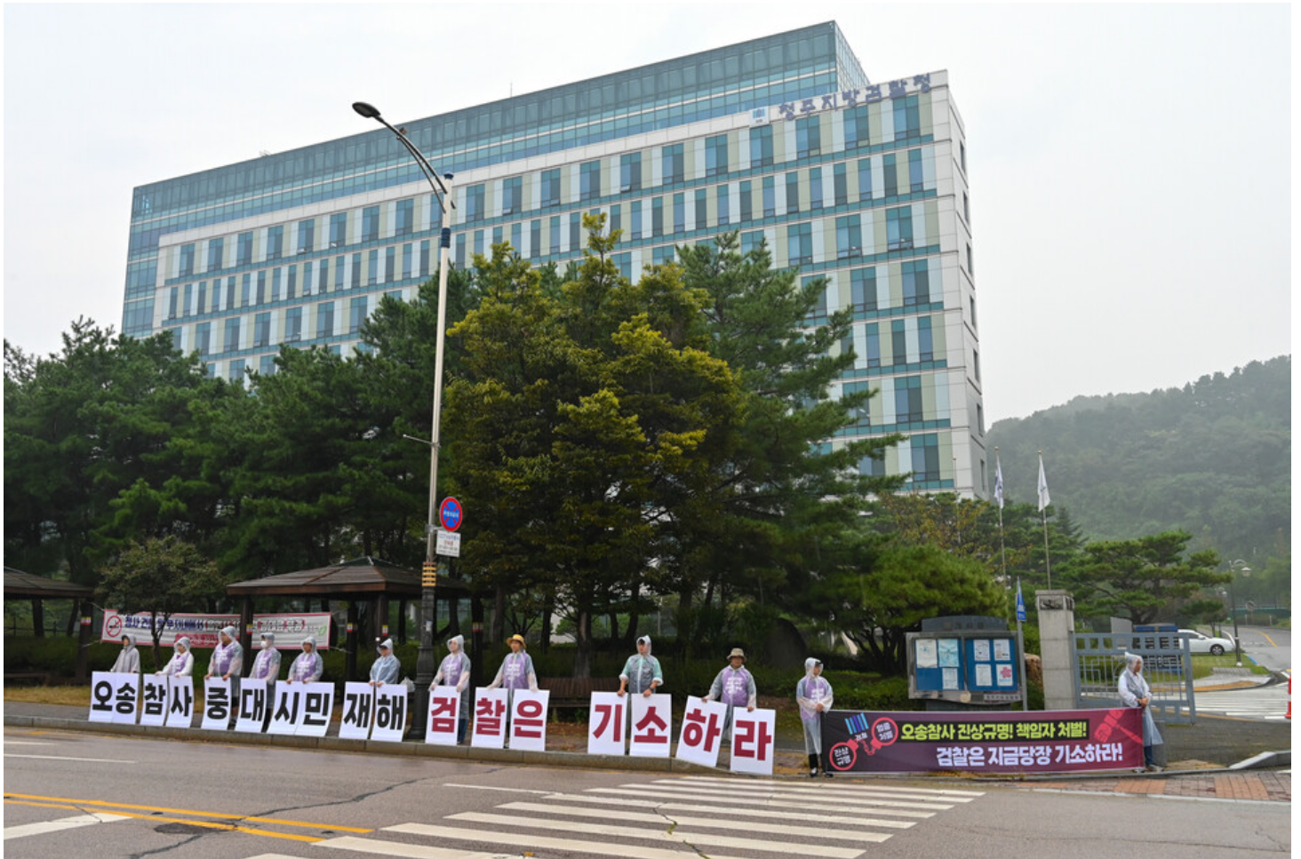
민주노총-생명안전행동이 윤석열표 생명안전 개악 저지를 위한 전국순회투쟁 2일차를 맞아 청주검찰청과 대전 현대프리미엄아울렛, 고용노동부 군산지청 앞에서 오송 궁평 지하차도 참사와 현대프리미엄아울렛 화재참사, 그리고 세아베스틸 군산공장에 대해 철저한 수사와 엄중한 처벌을 촉구했다.

민주노총과 생명 안전 후퇴 및 중대재해처벌법 개악 저지 공동행동(이하 생명안전행동)이 반복되는 중대재해 근절과 윤석열 정권의 생명 안전 후퇴 개악을 저지하기 위해 준비한 순회투쟁단이 19일에 이어 20일에도 2일차 전국순회투쟁을 전개하고 있다.