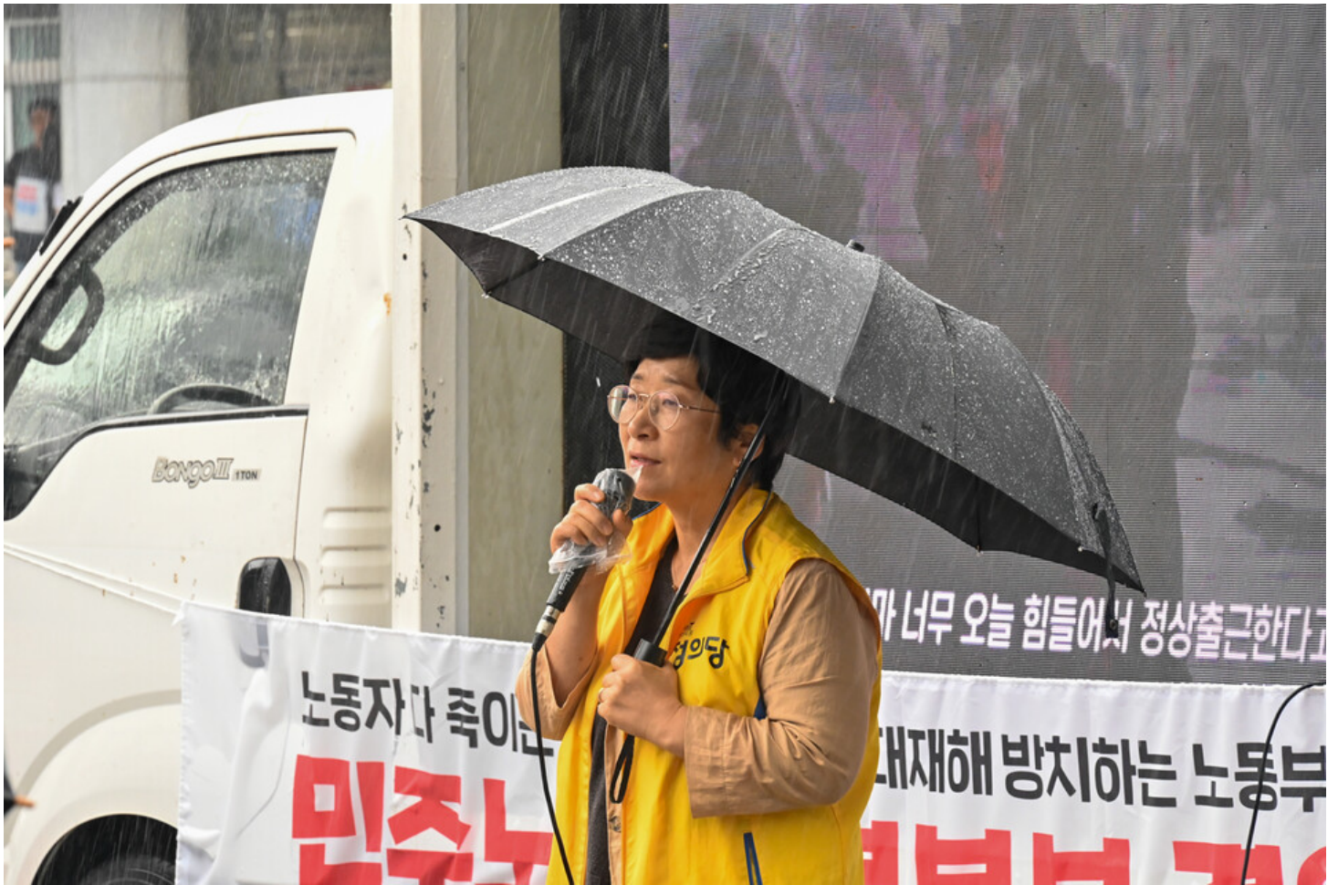
민주노총-생명안전행동이 윤석열표 생명안전 개악 저지를 위한 전국순회투쟁 2일차를 맞아 청주검찰청과 대전 현대프리미엄아울렛, 고용노동부 군산지청 앞에서 오송 궁평 지하차도 참사와 현대프리미엄아울렛 화재참사, 그리고 세아베스틸 군산공장에 대해 철저한 수사와 엄중한 처벌을 촉구했다.