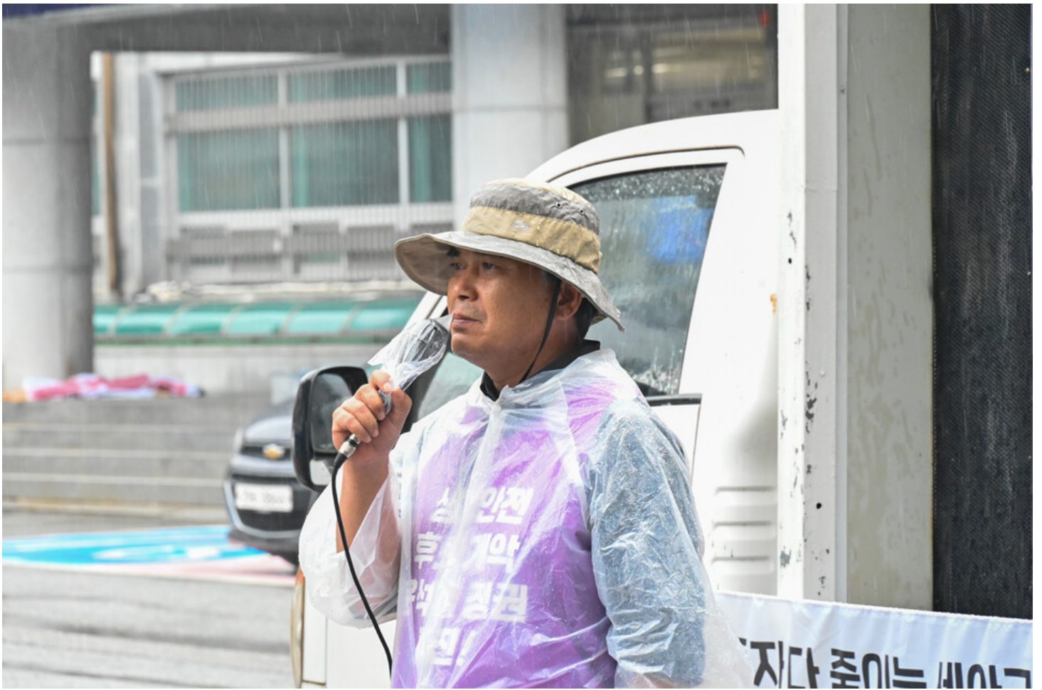
민주노총-생명안전행동이 윤석열표 생명안전 개악 저지를 위한 전국순회투쟁 2일차를 맞아 청주검찰청과 대전 현대프리미엄아울렛, 고용노동부 군산지청 앞에서 오송 공평 지하차도 참사와 현대프리미엄아울렛 화재참사, 그리고 세아베스틸 군산공장에 대해 철저한 수사와 엄중한 처벌을 촉구했다.