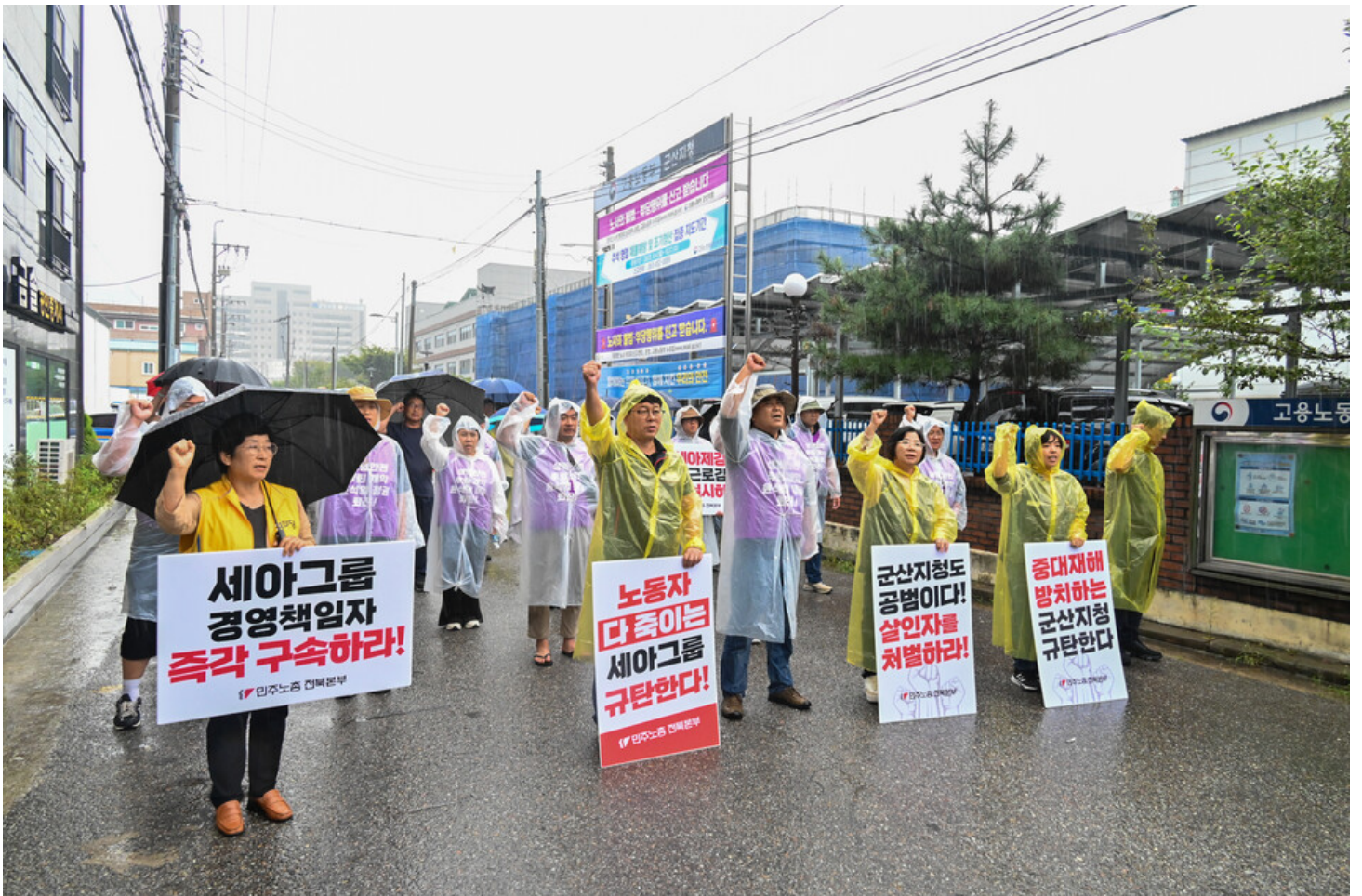
민주노총-생명안전행동이 윤석열표 생명안전 개악 저지를 위한 전국순회투쟁 2일차를 맞아 청주검찰청과 대전 현대프리미엄아울렛, 고용노동부 군산지청 앞에서 오송 공평 지하차도 참사와 현대프리미엄아울렛 화재참사, 그리고 세아베스틸 군산공장에 대해 철저한 수사와 엄중한 처벌을 촉구했다.