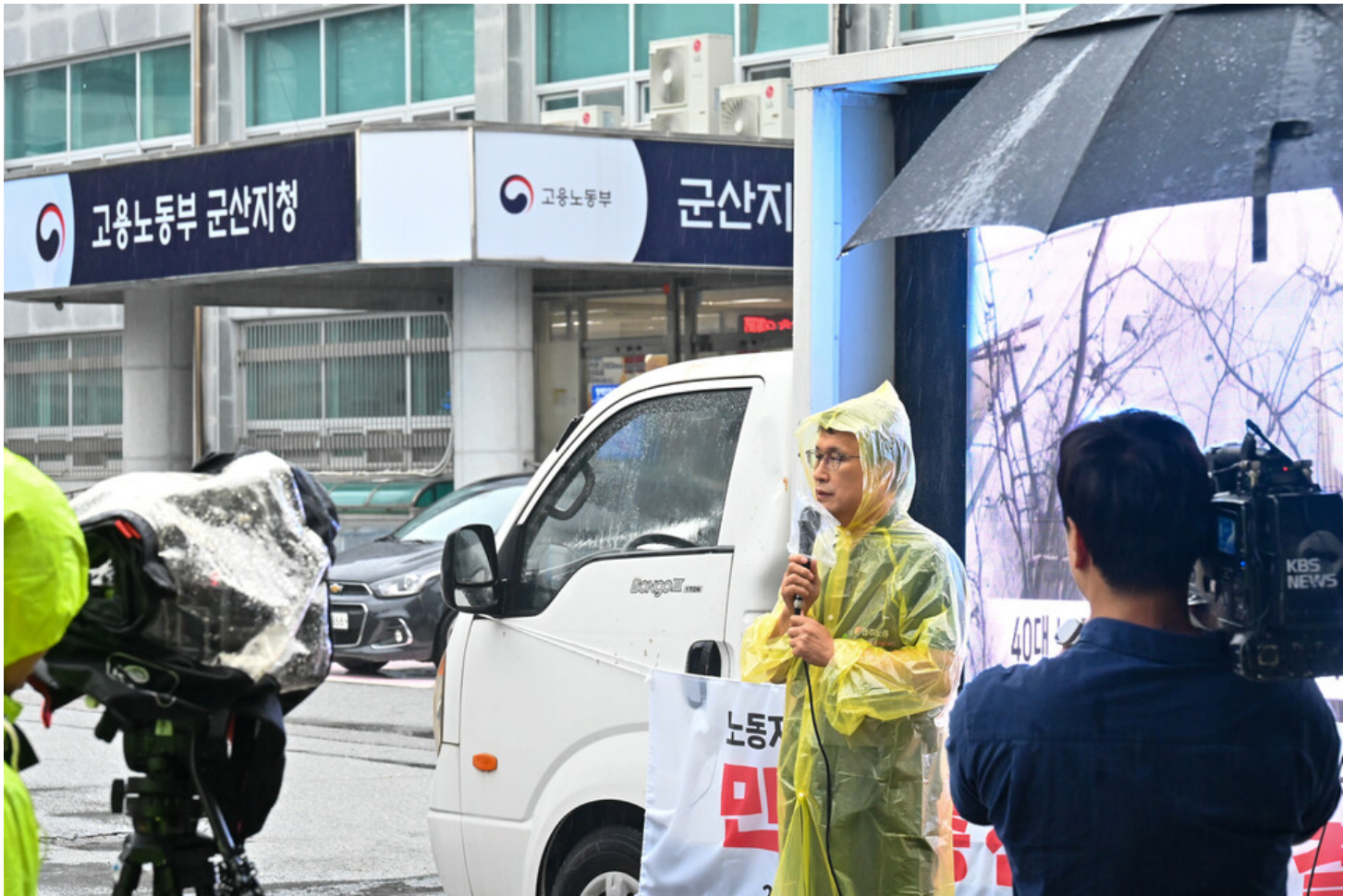
민주노총-생명안전행동이 윤석열표 생명안전 개악 저지를 위한 전국순회투쟁 2일차를 맞아 청주검찰청과 대전 현대프리미엄아울렛, 고용노동부 군산지청 앞에서 오송 공평 지하차도 참사와 현대프리미엄아울렛 화재참사, 그리고 세아베스틸 군산공장에 대해 철저한 수사와 엄중한 처벌을 촉구했다.