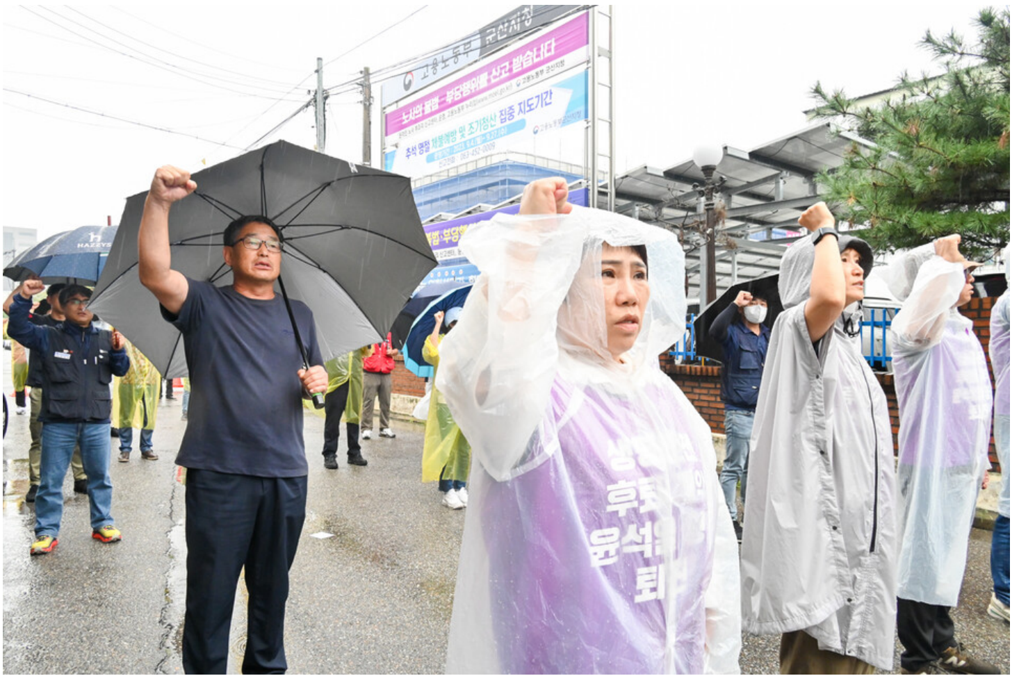
민주노총, 생명안전행동 윤석열표 생명안전 개악 저지를 위한 전국순회투쟁 2일 차. 청주검찰청과 대전 현대프리미엄아울렛, 고용노동부 군산지청 앞에서 오송 궁평 지하차도 참사와 현대프리미엄아울렛 화재참사, 그리고 세아베스틸 군산공장에 대해 철저한 수사와 엄중한 처벌을 촉구