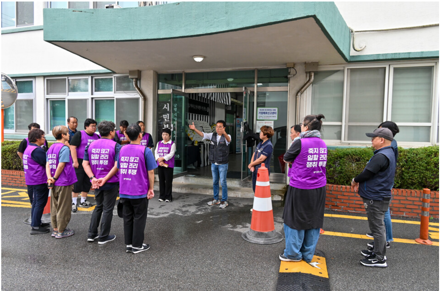
민주노총-생명안전행동이 윤석열표 생명안전 개악 저지를 위한 전국순회투쟁 2일차를 맞아 청주검찰청과 대전 현대프리미엄아울렛, 고용노동부 군산지청 앞에서 오송 공평 지하철도 참사와 현대프리미엄아울렛 화재참사, 그리고 세아베스틸 군산공장에 대해 철저한 수사와 엄중한 처벌을 촉구했다.