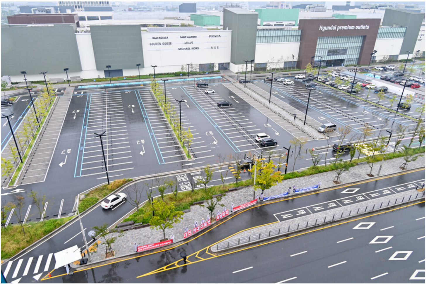
민주노총-생명안전행동이 윤석열표 생명안전 개악 저지를 위한 전국순회투쟁 2일차를 맞아 청주검찰청과 대전 현대프리미엄아울렛, 고용노동부 군산지청 앞에서 오송 공평 지하철도 참사와 현대프리미엄아울렛 화재참사, 그리고 세아베스틸 군산공장에 대해 철저한 수사와 엄중한 처벌을 촉구했다.