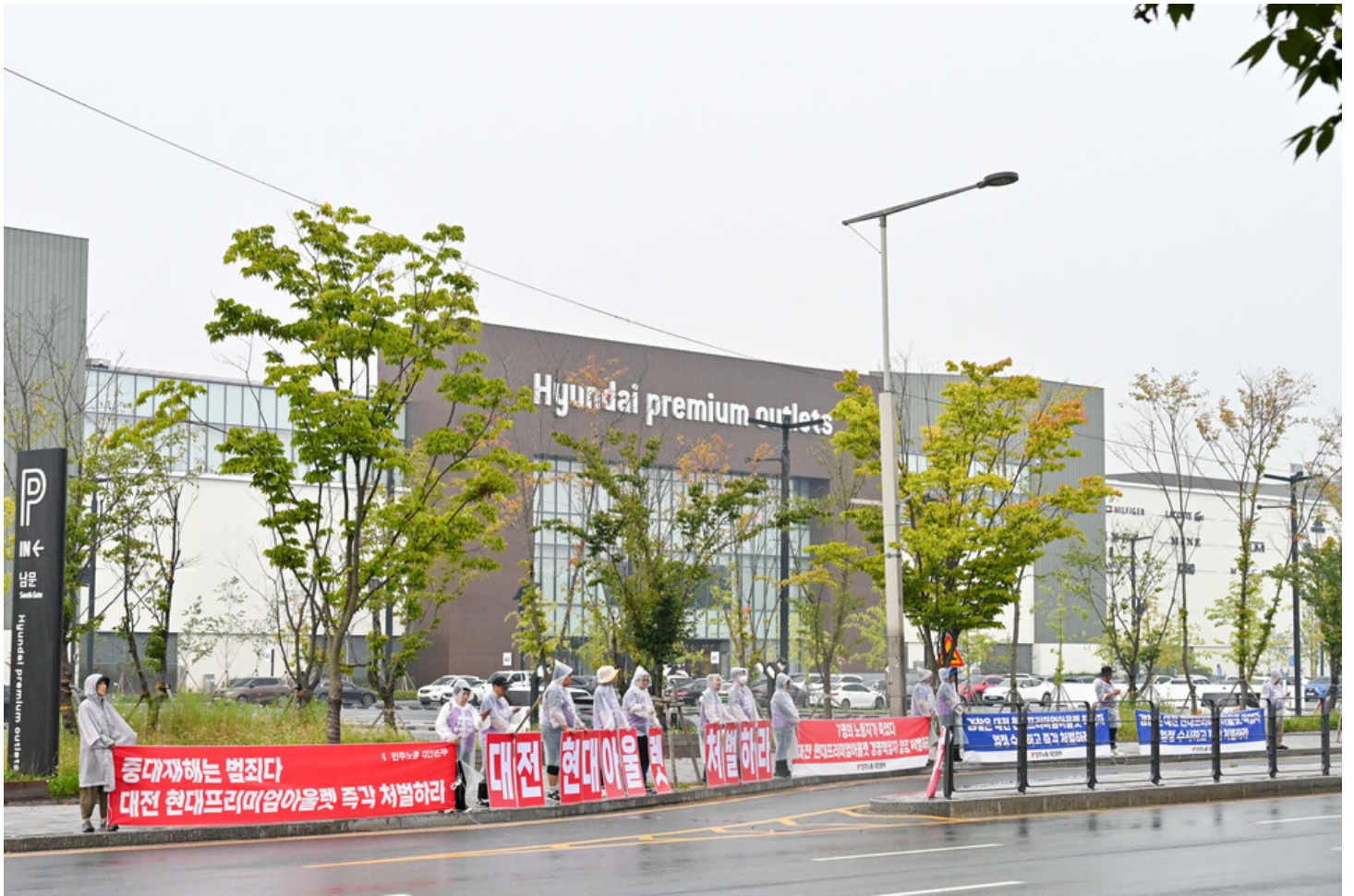
민주노총, 생명안전행동 윤석열표 생명안전 개약 저지를 위한 전국순회투쟁 2일 차. 청주검찰청과 대전 현대프리미아울렛, 고용노동부 군산지청 앞에서 오송 공평 지하차도 참사와 현대프리미아울렛 화재참사, 그리고 세아베스틸 군산공장에 대해 철저한 수사와 엄중한 처벌을 촉구