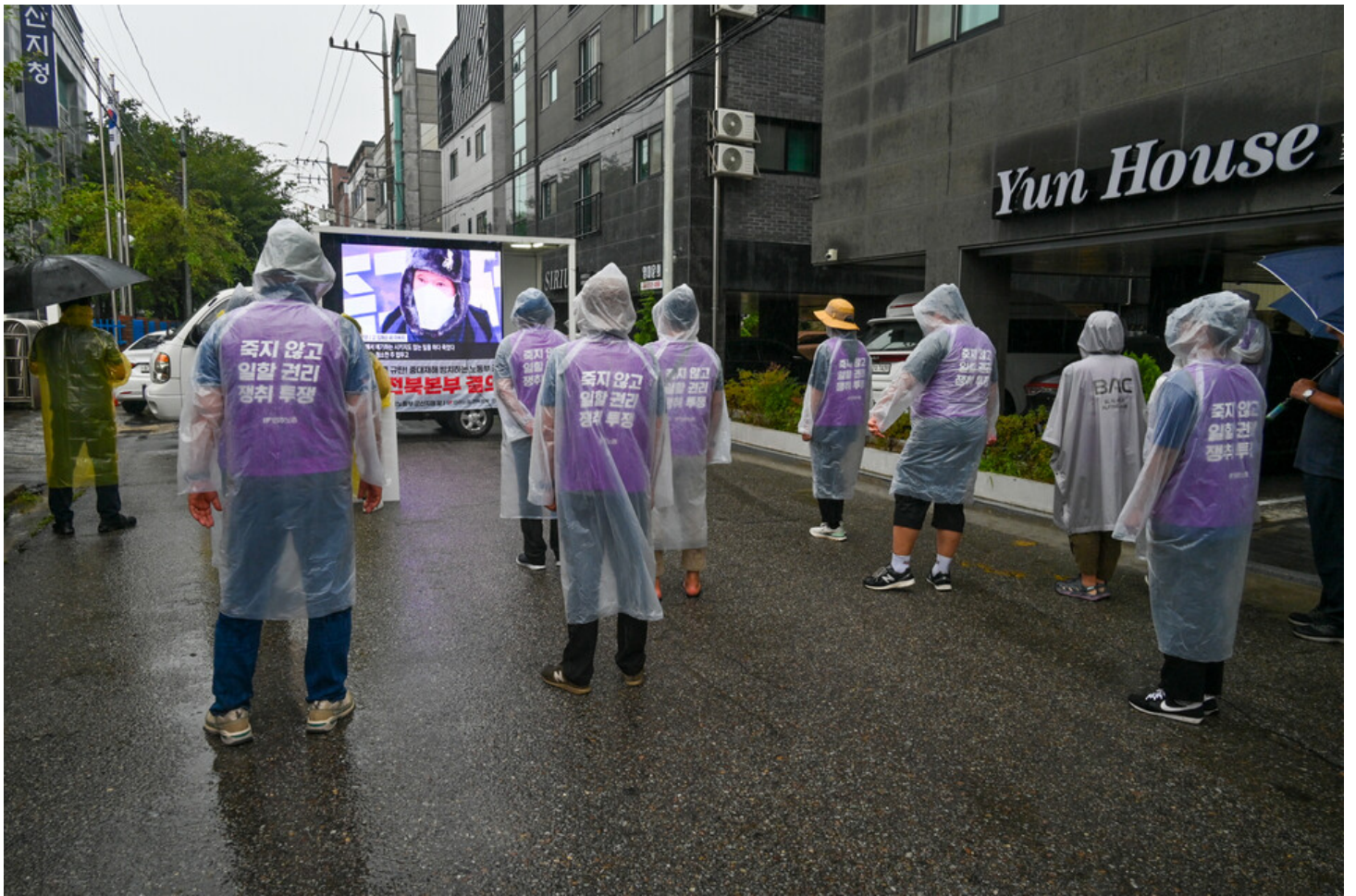
민주노총-생명안전행동이 윤석열표 생명안전 개악 저지를 위한 전국순회투쟁 2일차를 맞아 청주검찰청과 대전 현대프리미엄아울렛, 고용노동부 군산지청 앞에서 오송 궁평 지하차도 참사와 현대프리미엄아울렛 화재참사, 그리고 세아베스틸 군산공장에 대해 철저한 수사와 엄중한 처벌을 촉구했다.

순회투쟁단은 3일차인 21일 근골격계 질환 산재처리 기간을 지연하고 있는 근로복지공단 규탄 선전전과 에스오일 중대재해처벌법 무혐의 불기소 처분 결정을 내린 울산지방검찰청을 규탄하는 선전전과 지역 중대재해 사건 엄정 수사 및 처벌촉구 선전전 그리고 경남지역 중대재해 사업장 책임자 엄정 처벌 촉구 집회를 창원지방검찰청 앞에서 진행하고 2박3일간의 전국순회투쟁을 마무리 할 계획이다.