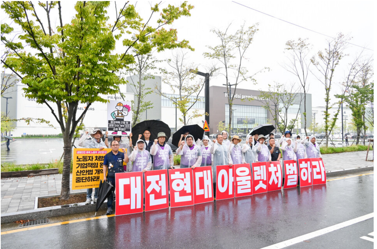
민주노총-생명안전행동이 윤석열표 생명안전 개악 저지를 위한 전국순회투쟁 2일차를 맞아 청주검찰청과 대전 현대프리미엄아울렛, 고용노동부 군산지청 앞에서 오송 공평 지하차도 참사와 현대프리미엄아울렛 화재참사, 그리고 세아베스틸 군산공장에 대해 철저한 수사와 엄중한 처벌을 촉구했다.