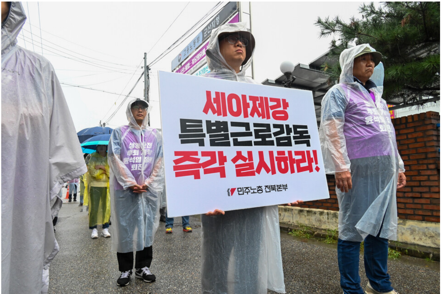
민주노총-생명안전행동이 윤석열표 생명안전 개악 저지를 위한 전국순회투쟁 2일차를 맞아 청주검찰청과 대전 현대프리미엄아울렛, 고용노동부 군산지청 앞에서 오송 공평 지하차도 참사와 현대프리미엄아울렛 화재참사, 그리고 세아베스틸 군산공장에 대해 철저한 수사와 엄중한 처벌을 촉구했다.

중처법 시행 이후 4명이 사망하는 중대재해가 발생한 세아베스틸 군산공장에 대해 미온적인 태도로 일관하며 봐주기를 하고있는 고용노동부 군산지청에 대한 규탄도 이어졌다.