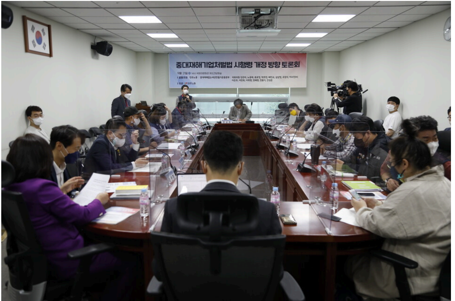
21일, 국회에서 중대재해기업처벌법 시행령 개정 방향 토론회가 열렸다.