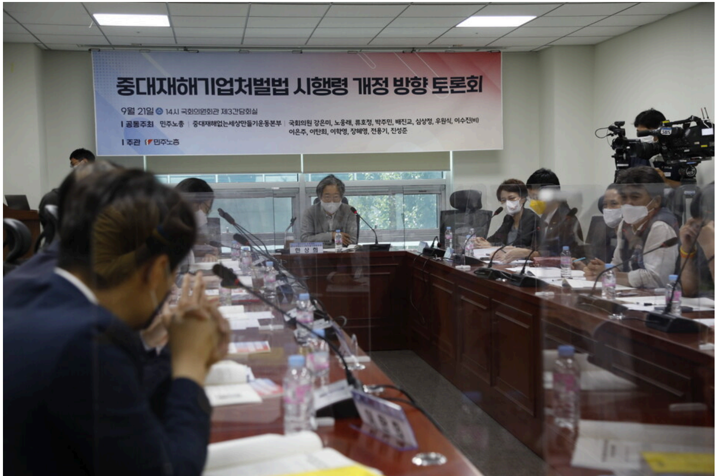
21일, 국회에서 중대재해기업처벌법 시행령 개정 방향 토론회가 열렸다.

기소 1건, 중대재해처벌법 초라한 성적표 정부 여당, 중대재해처벌법 약화 시도