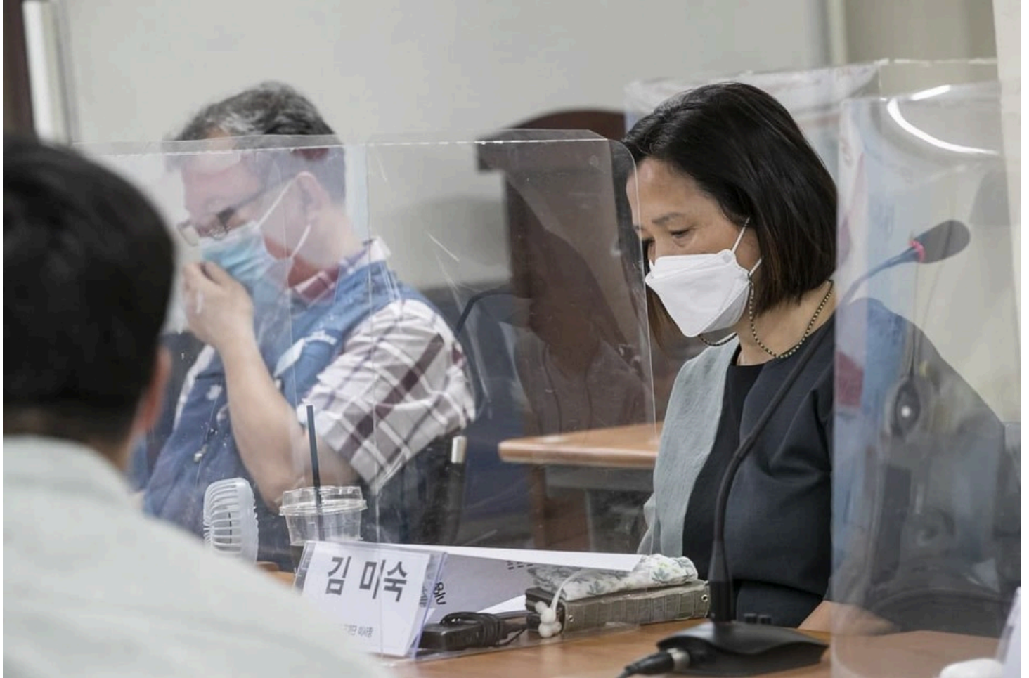
민주노총과 중대재해기업처벌법 제정운동본부가 금속노조 회의실에서 15일 오전 '제대로 된 중대재해기업처벌법 시행령 제정을 위한 긴급토론회'를 개최했다.

또한 '공중이용시설'에 대해 시행령안은 준공이 10년 넘은 도로, 교량 등 여섯 종류의 시설로만 한정하고 있어 해당 장소 밖에서 발생하는 중대재해 시에는 중대재해기업처벌법의 적용이 어려울 것이라고 지적했다. 또한 재해발생 시 생명과 신체의 피해가 초래될 우려가 있는 장소로 정의를 확대해야 한다고 말했다.