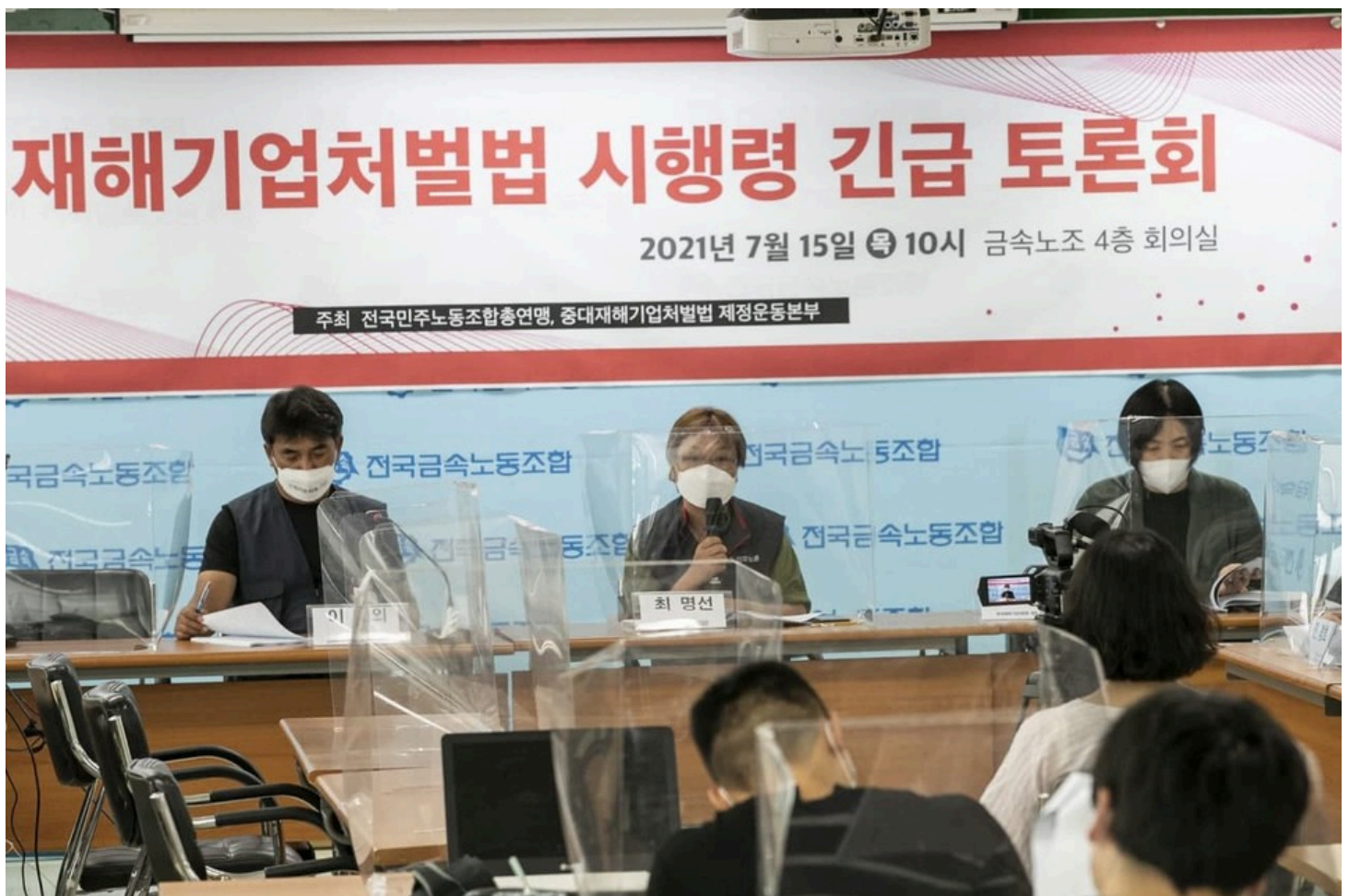
민주노총과 중대재해기업처벌법 제정운동본부가 금속노조 회의실에서 15일 오전 ‘제대로 된 중대재해기업처벌법 시행령 제정을 위한 긴급토론회’를 개최했다.

민주노총·중대재해기업처벌법제정본부 긴급토론회 개최 처벌법 핵심 의제인 ‘2인1조 작업’, ‘과로사’ 내용 없어 뇌심혈관질환 재해 대상되면 고용 줄어든다? ‘궁색한 변명’