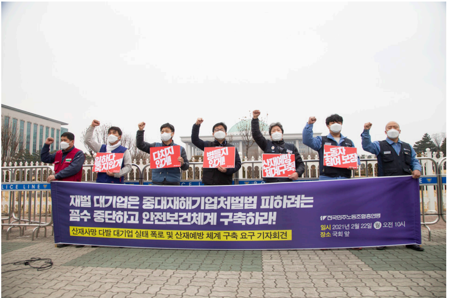
민주노총이 22일 오전 국회 앞에서 산재사망 다발 대기업 실태 폭로 및 산재 예방체계 구축 요구 기자회견을 열었다.

22일, 국회 앞 산재사망 다발 대기업 실태 폭로 및 산재 예방체계 구축 요구 민주노총 기자회견 열려