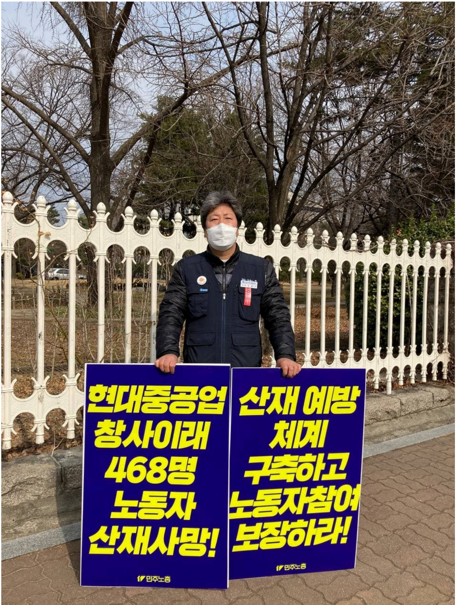
민주노총이 22일 오전 국회 앞에서 산재사망 다발 대기업 실태 폭로 및 산재 예방체계 구축 요구 기자회견을 열었다. 건설산업연맹, 공공운수노조, 금속노조 현대중공업 지부, 금속노조 포항지부 포스코지회 조합원들은 이날 기자회견 뒤 국회 인근 곳곳에서 1인시위를 진행했다.