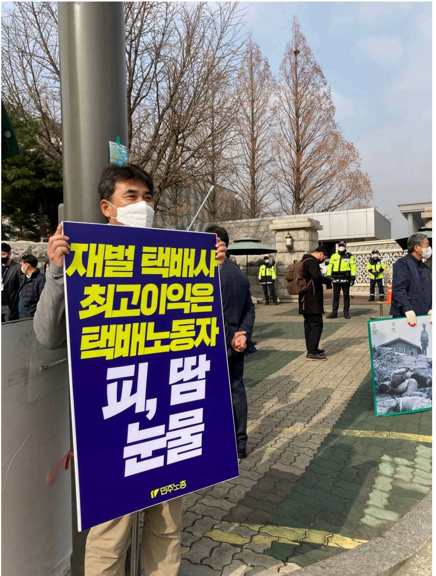
민주노총이 22일 오전 국회 앞에서 산재사망 다발 대기업 실태 폭로 및 산재 예방체계 구축 요구 기자회견을 열었다. 건설산업연맹, 공공운수노조, 금속노조 현대중공업 지부, 금속노조 포항지부 포스코지회 조합원들은 이날 기자회견 뒤 국회 인근 곳곳에서 1인시위를 진행했다.