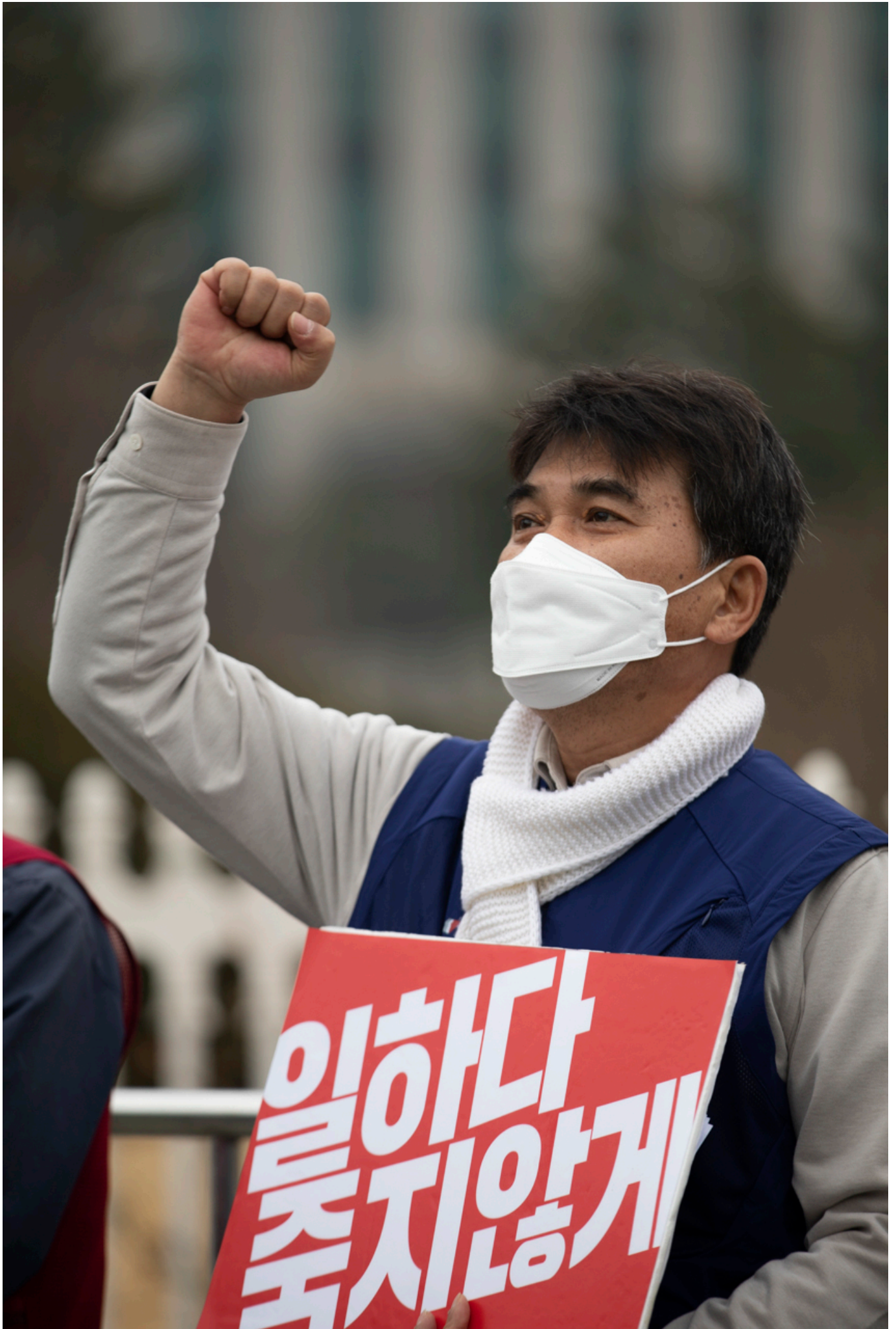
민주노총이 22일 오전 국회 앞에서 산재사망 다발 대기업 실태 폭로 및 산재 예방체계 구축 요구 기자회견을 열었다.