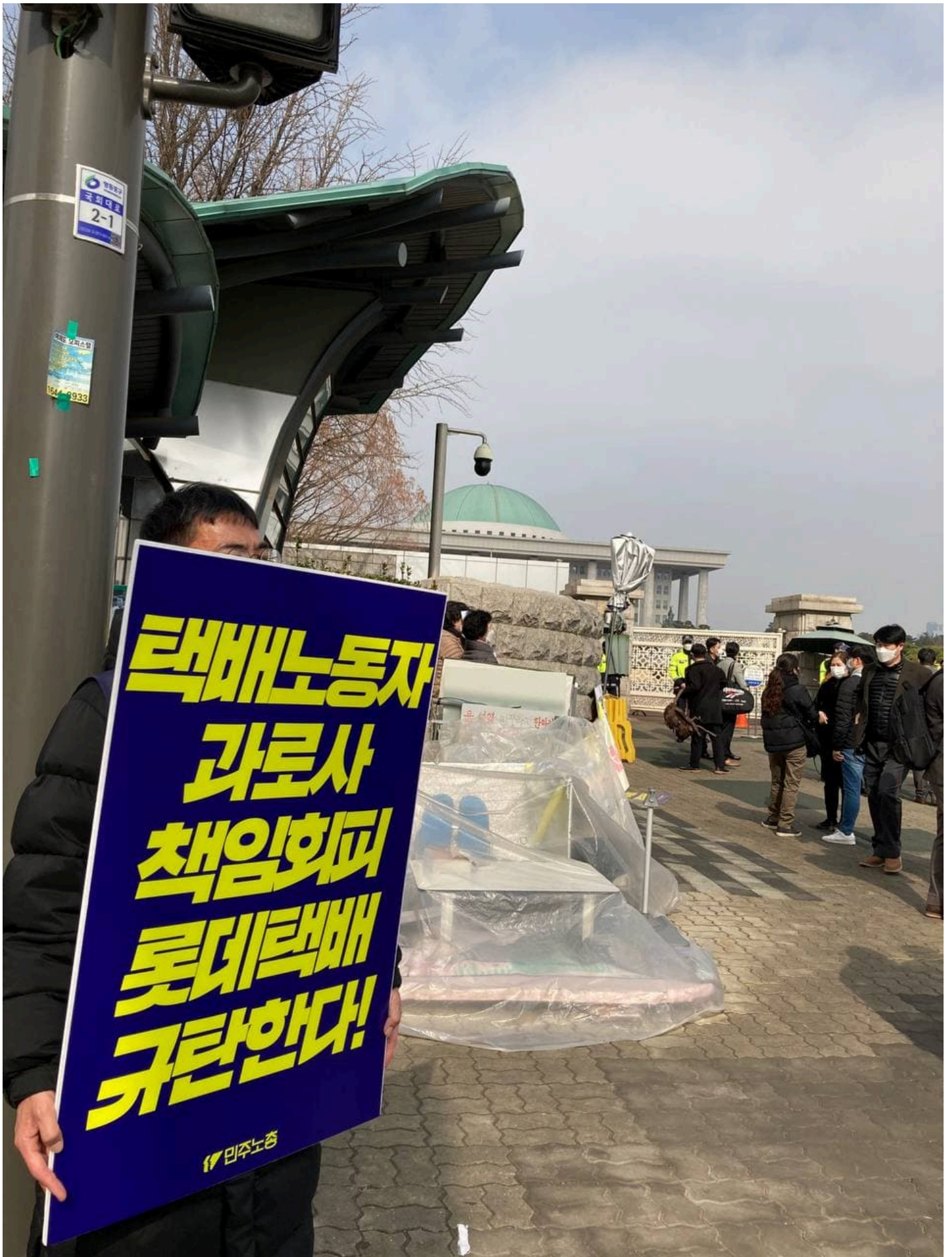
민주노총이 22일 오전 국회 앞에서 산재사망 다발 대기업 실태 폭로 및 산재 예방체계 구축 요구 기자회견을 열었다. 건설산업연맹, 공공운수노조, 금속노조 현대중공업 지부, 금속노조 포항지부 포스코지회 조합원들은 이날 기자회견 뒤 국회 인근 곳곳에서 1인시위를 진행했다.