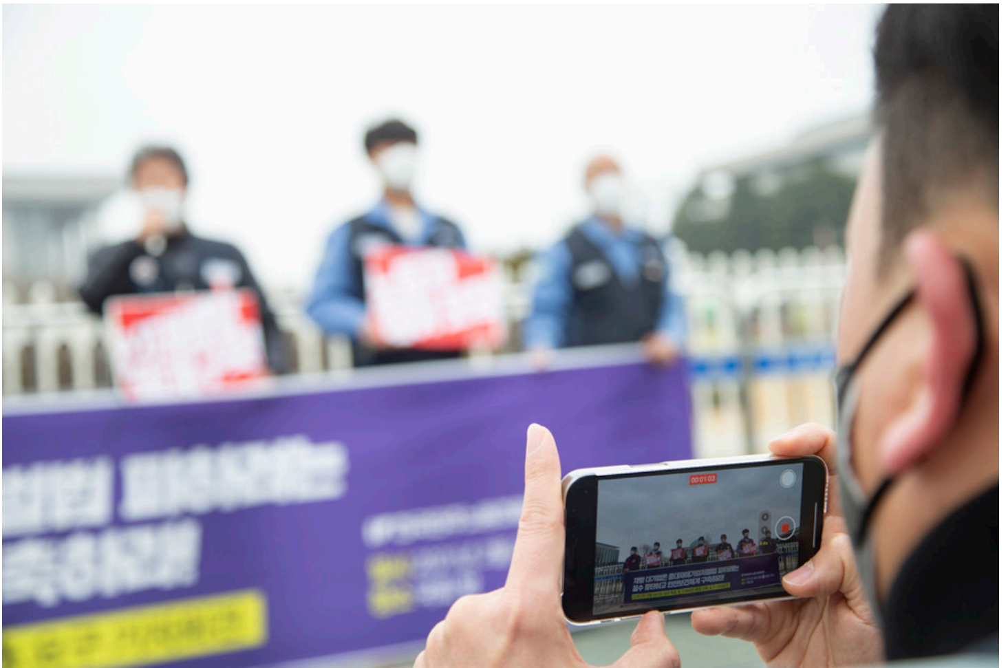
민주노총이 22일 오전 국회 앞에서 산재사망 다발 대기업 실태 폭로 및 산재 예방체계 구축 요구 기자회견을 열었다.