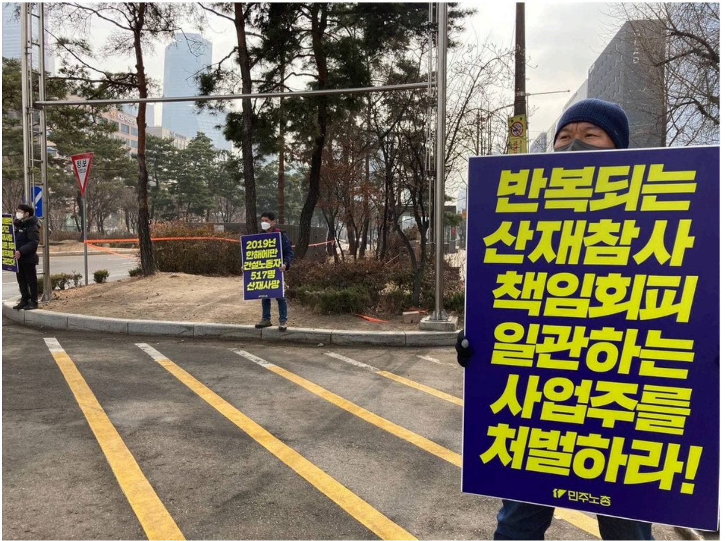
민주노총이 22일 오전 국회 앞에서 산재사망 다발 대기업 실태 폭로 및 산재 예방체계 구축 요구 기자회견을 열었다. 건설산업연맹, 공공운수노조, 금속노조 현대중공업 지부, 금속노조 포항지부 포스코지회 조합원들은 이날 기자회견 뒤 국회 인근 곳곳에서 1인시위를 진행했다.