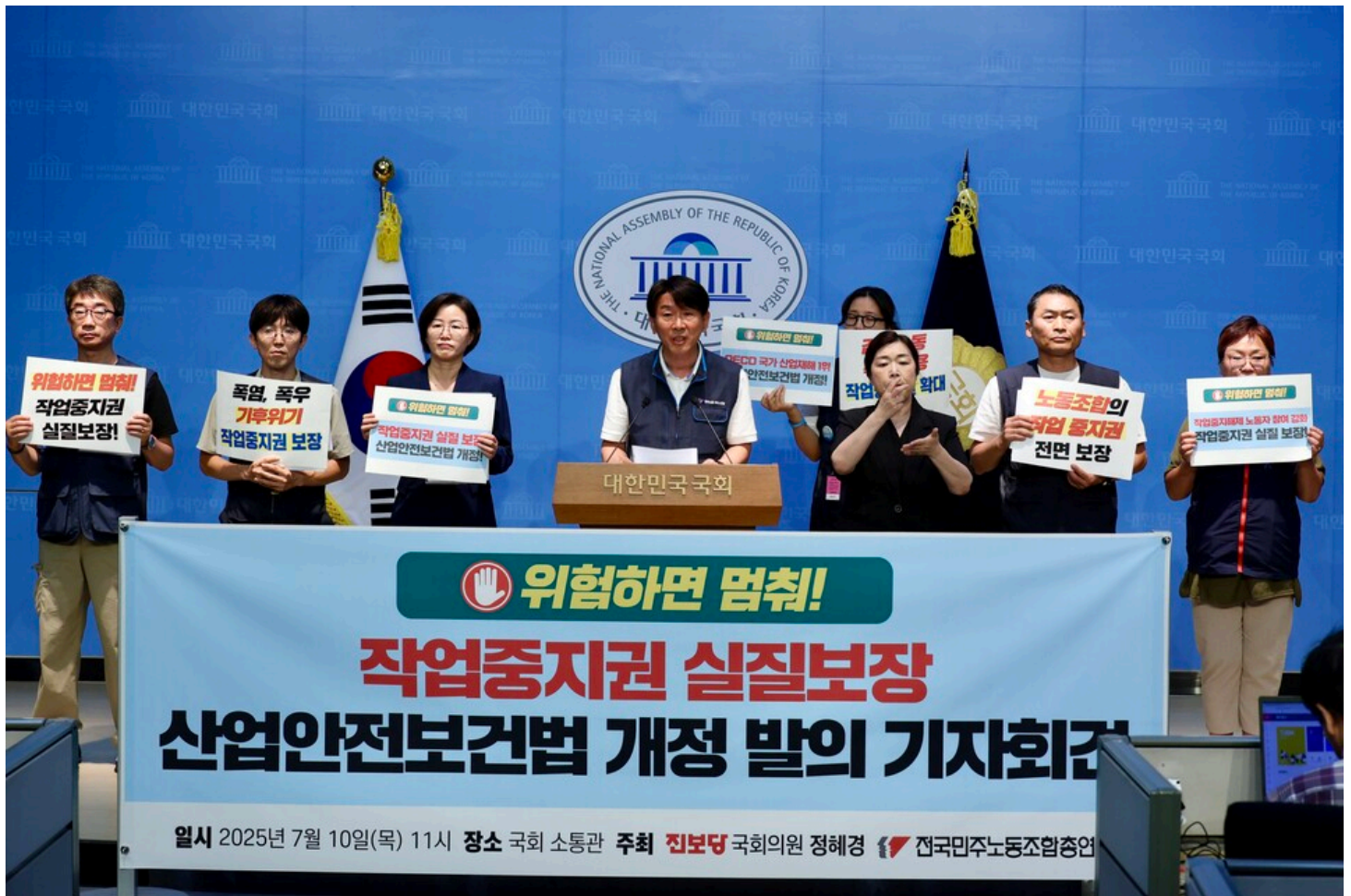
‘위험하면 멈춰! 작업중지권 실질 보장 산업안전보건법 개정 발의 기자회견’이 10일 오전 11시 국회 소통관에서 개최됐다.

“일터 가장 잘 아는 노동자가 작업중지권 실질적으로 보장 받아야” 특수고용·플랫폼·하청 노동자에도 사각지대 없는 작업중지권 보장 “정수기 점검 노동자엔 얼음물도 아까운 정수기 회사” 황당 사례도