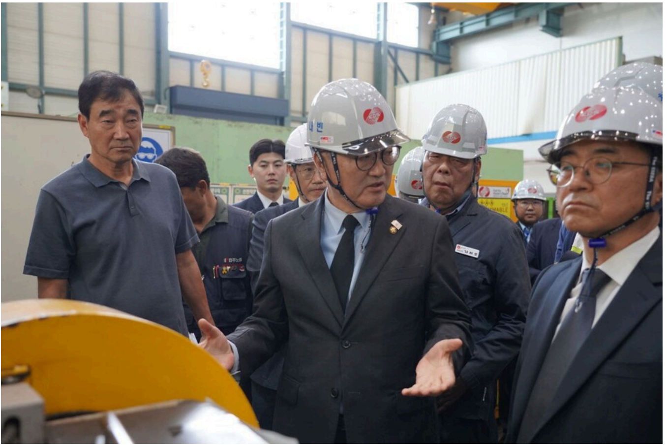
▲8일 태안, 한국서부발전(주) 태안발전본부(태안화력발전소 내 한전KPS 기계공작실) 현장답사 모습

분향소 내 간담회 이후 한국서부발전(주) 태안발전본부(태안화력발전소 내 한전KPS 기계공작실) 현장답사를 진행했다. 그러나 사망 사고가 난 작업대에서 사측과 노동부 대전청장은 “무슨 작업을 하다가 사망했는지 모른다”, “비교적 안전한 작업이었다”, “1인이 할 수 있는 정밀작업이었다” 라는 등 사고 경위조차 제대로 보고하지 못했다.