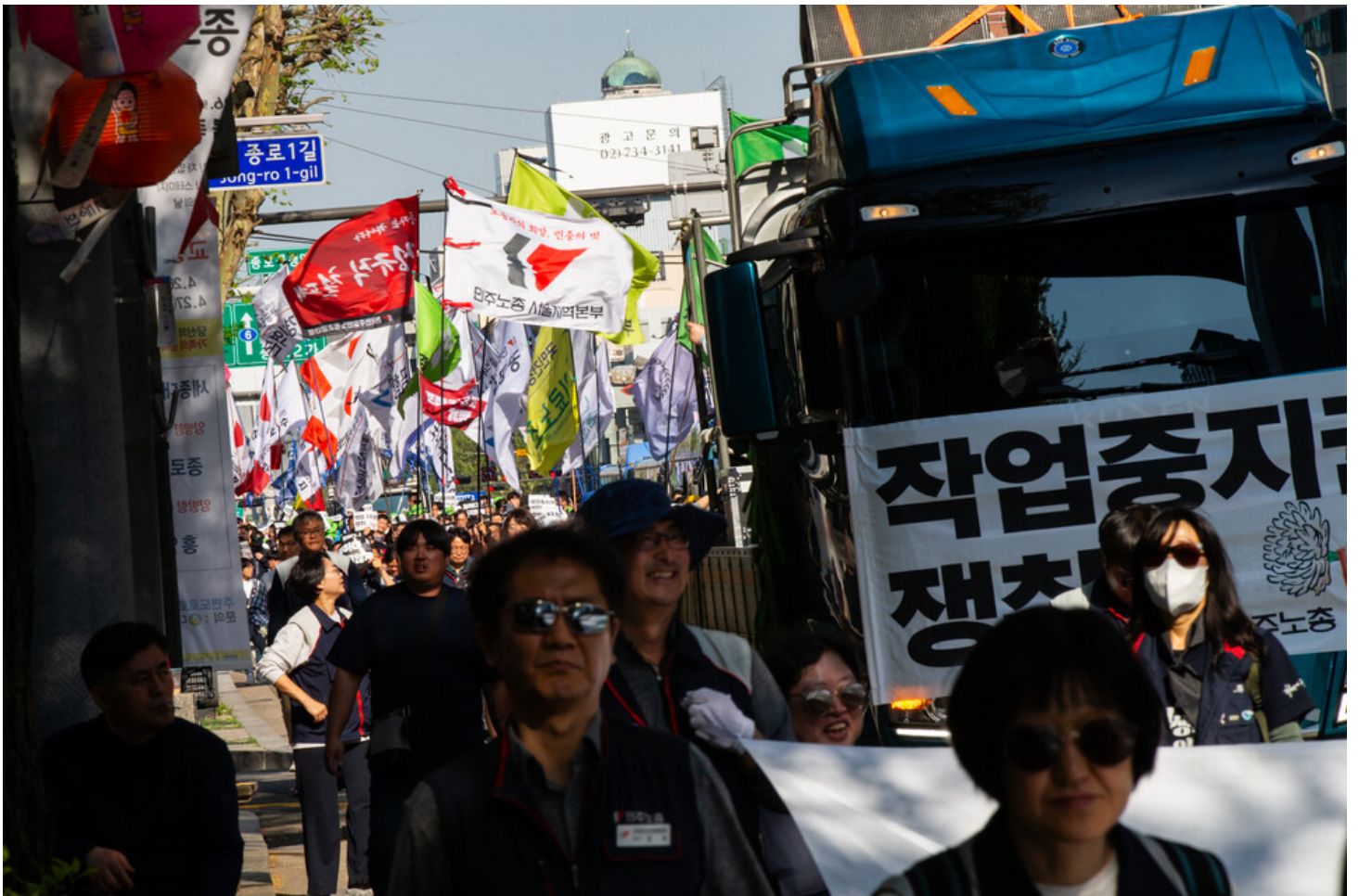
노동자 건강권 쟁취의 달인 4월을 맞아 민주노총이 23일 오후 2시 서울 중구 서울고용노동청 앞에서 결의대회를 열었다. 결의대회 뒤 현대건설과 CJ대한통운, KT, 정부 서울청사를 차례로 찾아 규탄하는 행진을 이어갔다.