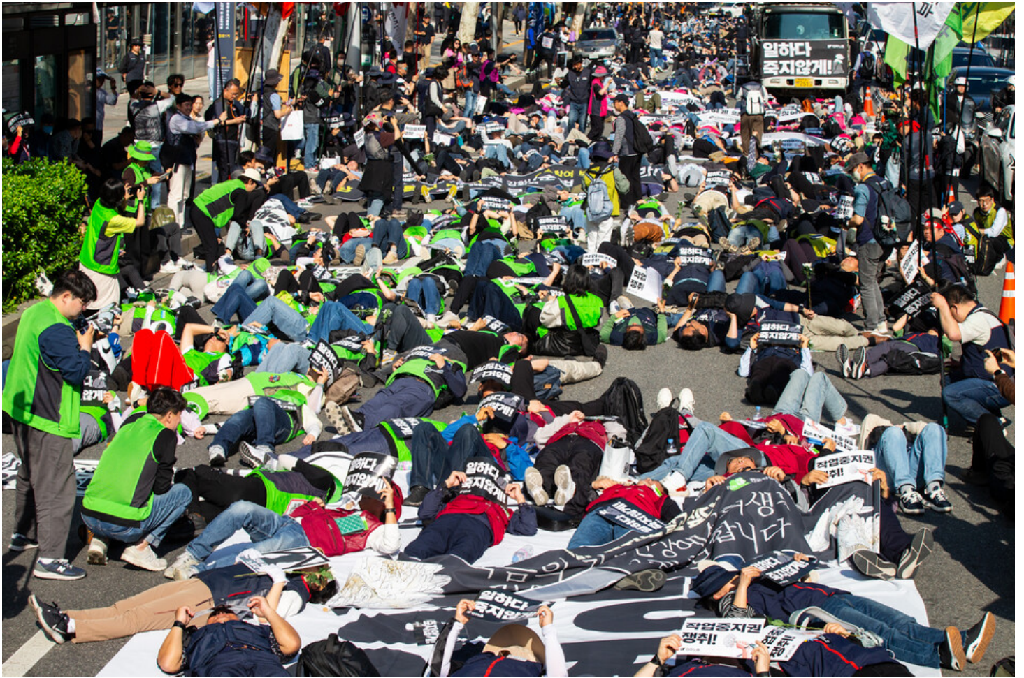
노동자 건강권 쟁취의 달인 4월을 맞아 민주노총이 23일 오후 2시 서울 중구 서울고용노동청 앞에서 결의대회를 열었다. 결의대회 뒤 현대건설과 CJ대한통운, KT, 정부 서울청사를 차례로 찾아 규탄하는 행진을 이어갔다. 종각역 인근 CJ대한통운 앞에서 민주노총 조합원들이 다이-인(die-in) 퍼포먼스를 하고 있다.