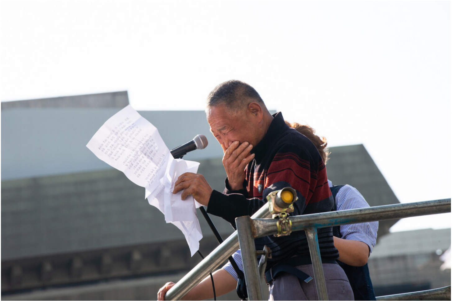
노동자 건강권 쟁취의 달인 4월을 맞아 민주노총이 23일 오후 2시 서울 중구 서울고용노동청 앞에서 결의대회를 열었다. 결의대회 뒤 현대건설과 CJ대한통운, KT, 정부 서울청사를 차례로 찾아 규탄하는 행진을 이어갔다. KT 산재노동자의 장인이 무대에 올라 사위의 억울함을 전하던 중 눈물을 쏟고 있다.