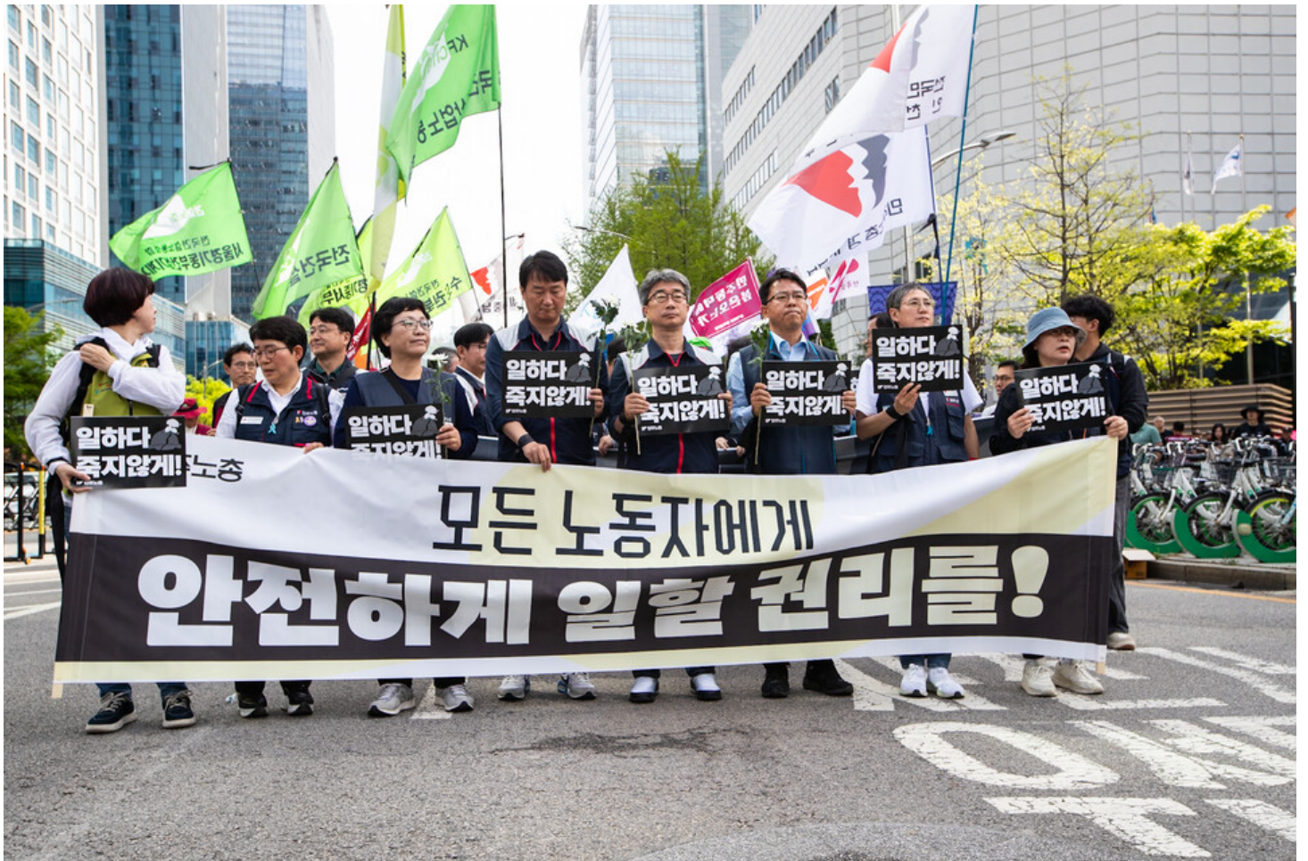
노동자 건강권 쟁취의 달인 4월을 맞아 민주노총이 23일 오후 2시 서울 중구 서울고용노동청 앞에서 결의대회를 열었다. 결의대회 뒤 현대건설과 CJ대한통운, KT, 정부 서울청사를 차례로 찾아 규탄하는 행진을 이어갔다.