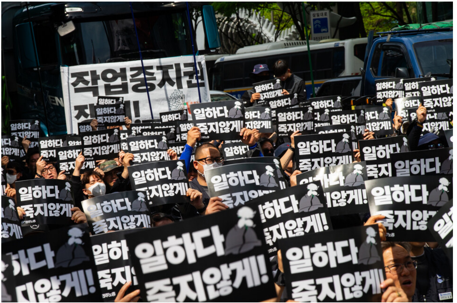
노동자 건강권 쟁취의 달인 4월을 맞아 민주노총이 23일 오후 2시 서울 중구 서울고용노동청 앞에서 결의대회를 열었다. 결의대회 뒤 현대건설과 CJ대한통운, KT, 정부 서울청사를 차례로 찾아 규탄하는 행진을 이어갔다.