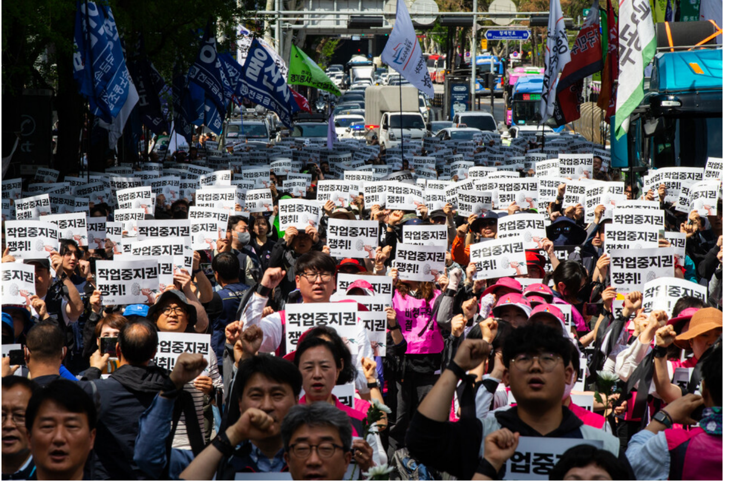
노동자 건강권 쟁취의 달인 4월을 맞아 민주노총이 23일 오후 2시 서울 중구 서울고용노동청 앞에서 결의대회를 열었다. 결의대회 뒤 현대건설과 CJ대한통운, KT, 정부 서울청사를 차례로 찾아 규탄하는 행진을 이어갔다.

본대회를 마친 조합원들은 한화본사 앞 고공농성장~현대건설 본사~CJ대한통운 본사~KT본사~학비연대회의의 농성장을 행진했다.