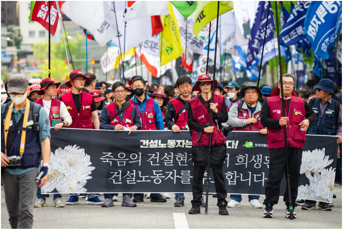
노동자 건강권 쟁취의 달인 4월을 맞아 민주노총이 23일 오후 2시 서울 중구 서울고용노동청 앞에서 결의대회를 열었다. 결의대회 뒤 현대건설과 CJ대한통운, KT, 정부 서울청사를 차례로 찾아 규탄하는 행진을 이어갔다.